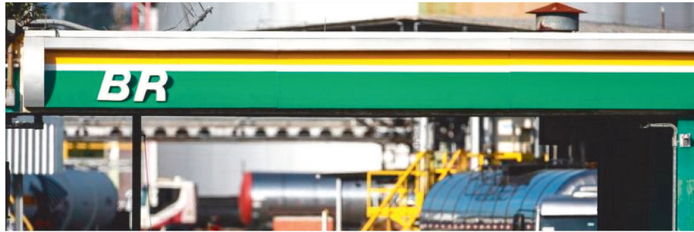
PRESIDENTE DISSE QUE FOCO SERÁ PREÇO DO COMBUSTÍVEL E QUE O VILÃO É O ICMS

O presidente Jair Bolsonaro afirmou, nesta segunda-feira (1º), que a Petrobras deverá anunciar um novo reajuste do preço dos combustíveis em 20 dias. A declaração foi feita a jornalistas em Anguillara Veneta, na Itália, após o chefe do Executivo ter sido questionado se a prioridade no retorno ao Brasil seria o Auxílio Brasil, programa que substituirá o Bolsa Família. Ele respondeu que o foco será o preço do combustível e destacou que o vilão do preço é o Imposto sobre Circulação de Mercadorias e Serviços (ICMS). "A prioridade é o preço do combustível. Eu não quero falar agora, vi muito rapidamente, o lucro da Petrobras. A Petrobras é em parte estatal, né, e monopolista. Se bem que o vilão do preço do combustível é o ICMS que incide em cima do preço final na bomba e não na origem", apontou.