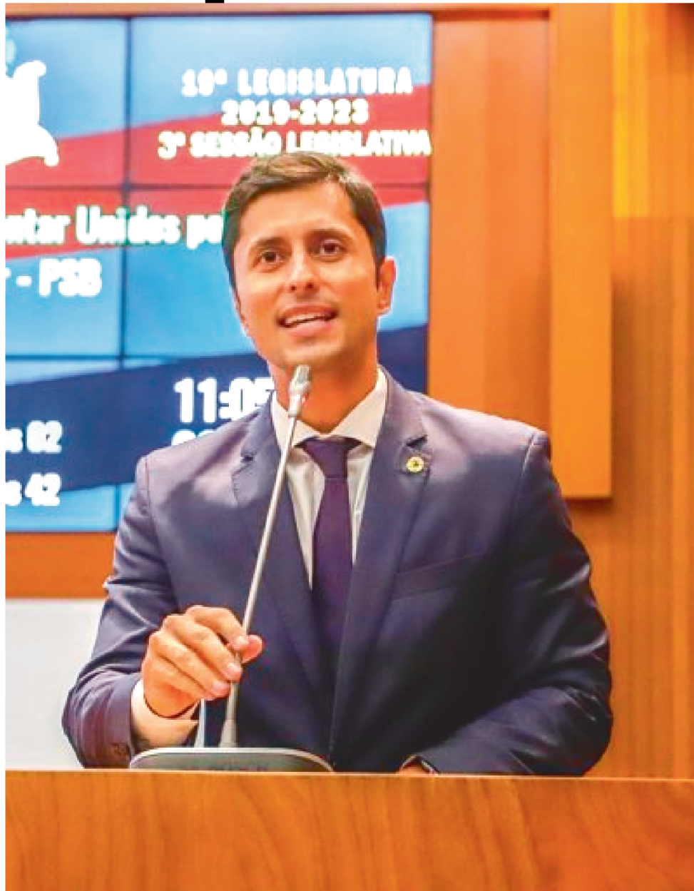
RECURSO AJUDARÁ NA CONTRAPARTIDA QUE ATENDE A RODOVIÁRIOS E EMPRESÁRIOS.

mentar o poder de articulação da prefeitura, que tem encontrado dificuldades em Intermediar o diálogo entre a categoria patronal e os empregados. Além disso, o recurso também garante