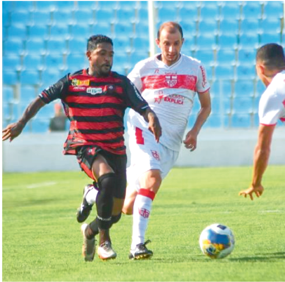
O MOTO PRECISA DE UM EMPATE EM ALAGOAS PARA SE CLASSIFICAR NO NORDESTE.

Agora, os conselheiros devem se unir para conseguir alcançar os valores necessários ao cumprimento da promessa feita aos jogadores antes do jogo com o CRB. Enquanto isso, outras alternativas estão sendo tentadas