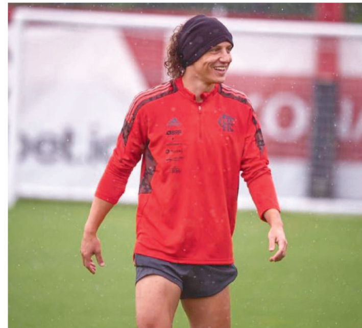
A EXPECTATIVA ERA QUE DAVID LUIZ JOGASSE NESTA TERÇA