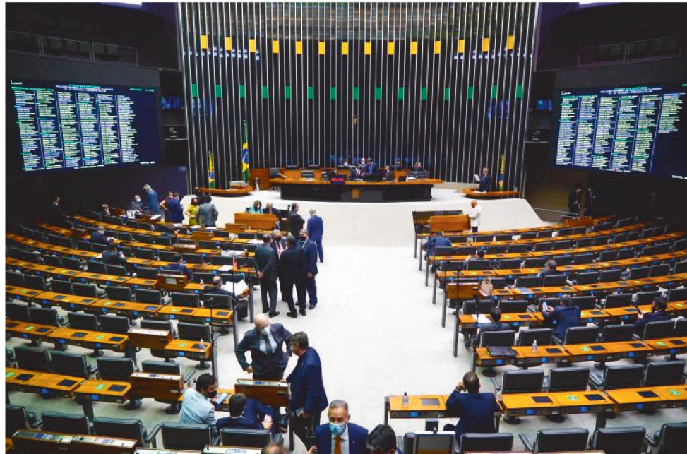
PEC É A PRINCIPAL APOSTA PARA VIABILIZAR O PROGRAMA SOCIAL AUXÍLIO BRASIL.

O deputado federal Rubens Jr (PCdoB) usou as redes sociais para criticar o resultado da votação que segundo o parlamentar coloca o país em insegurança fiscal e jurídica. “E Bolsonaro fez o q dizia q ia fazer: acabou com o Bolsa Família. E não se trata apenas de mudar o nome, mas desfiurar o maior programa de transferência condicionada de renda, q até o Banco Mundial quis estudar e exportar pra outros países”, ressaltou o par-