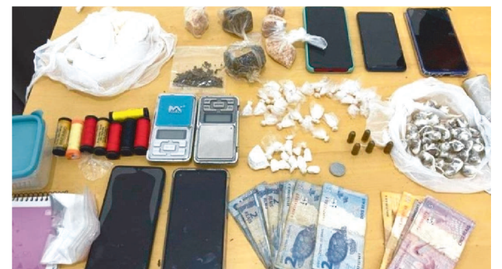
A POLÍCIA ENCONTROU DROGAS, DINHEIRO E CELULARES

Sete pessoas foram presas em flagrante suspeitas pelos crimes de tráfico e associação para o tráfico de drogas em um conjunto de quitinetes no bairro do Bequimão, em São Luís.