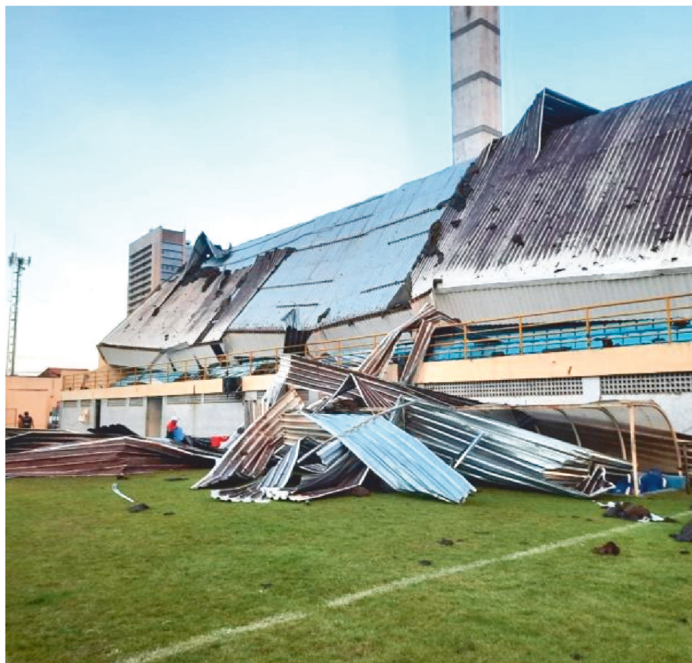
A COBERTURA DO ESTÁDIO FREI EPIFÂNIO DESABOU EM AGOSTO DESTA ANO

O jogo foi paralisado aos 30 minutos do segundo tempo, ninguém ficou ferido por causa do desabamento da