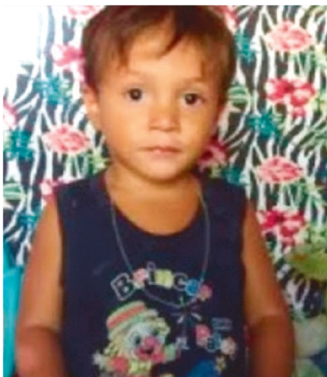
No Maranhão, o menino de dois anos que foi diagnosticado com raiva

humana e estava internado no Hospital Universitário da UFMA, desde o mês passado, faleceu na última quarta-feira.