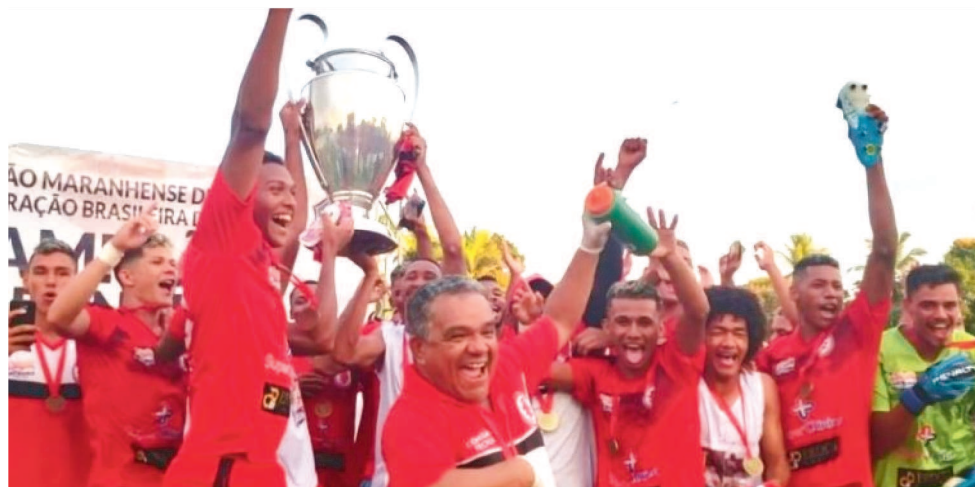
JUVENTUDE SAMAS FOI O ÚLTIMO CAMPEÃO DA COPA FMF DISPUTADA EM 2019.

A Copa FMF tem como fórmula de disputa a fase de grupos, neste caso dois grupos com 4 equipes. No grupo A estão: IAPE, Juventude, Pinheiro e São José. Já no grupo B os times são: Bacabal, Cordino, Imperatriz e Tuntum. A competição tem como regra principal que as equipes possuam jogadores de até 23 anos, sendo que cada clube pode inscrever apenas três jogadores acima desta idade estabele-