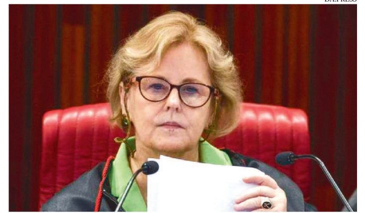
DESPACHO VALE ATÉ O JULGAMENTO DEFINITIVO DAS AÇÕES.

A ministra Rosa Weber, do Supremo Tribunal Federal (STF), ordenou que seja suspensa, “integral e imediatamente”, a execução das chamadas emendas de relator no orçamento de 2021. A magistrada é relatora de ações protocoladas pelos partidos Cidadania, PSB e PSol, que apontam falta de transparência na destinação das verbas e indícios de compra de apoio político pelo governo federal. Também conhecidas como RP9, essas emendas são usadas para financiar obras, serviços e equipamentos em redutos de parlamentares da base aliada.