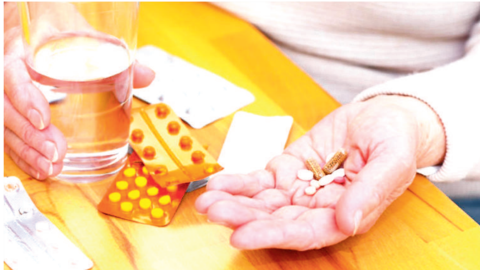
A AUTOMEDICAÇÃO SE TORNOU COMUM PRINCIPALMENTE PELA FALTA DE INFORMAÇÃO

Também houve aumento do consumo de antidepressivos e estabilizadores de humor durante esse período, subindo de 56,3 milhões de unidades vendidas em 2019 para 64,1 milhões em 2020 e medicamentos anticonvul-