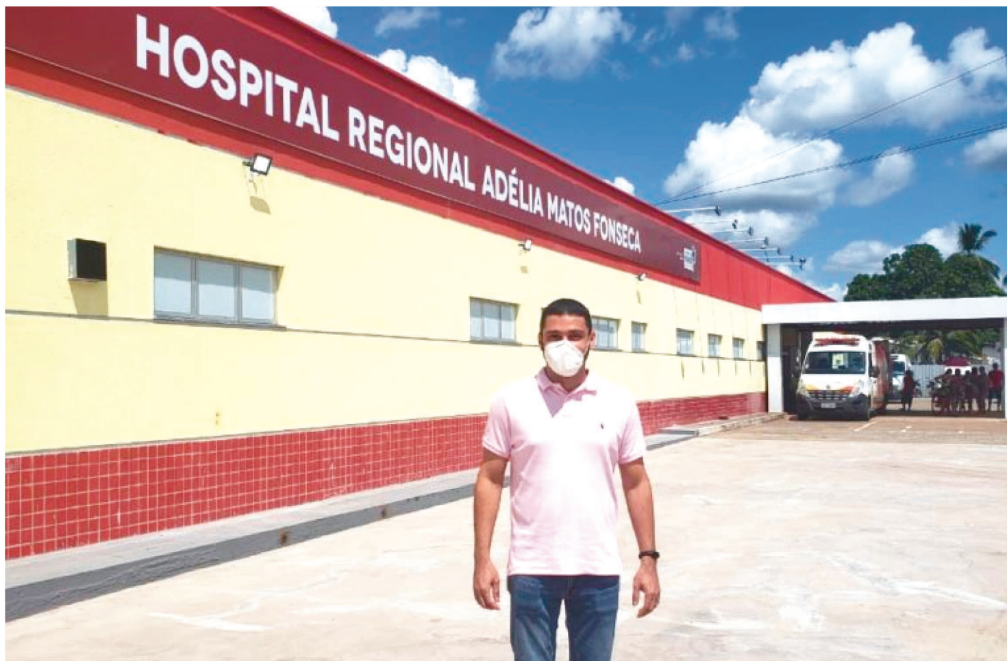
O DEPUTADO WENDELL LAGES (PMN) DESTINOU EMENDA PARA O MUTIRÃO DE CIRURGIAS OFTALMOLÓGICAS NO HOSPITAL REGIONAL

Começa nesta quarta-feira (24) e segue até sábado, dia 27 de novembro, o Mutirão de Cirurgias Oftalmológicas no Hospital Regional de Itapecuru-Mirim. A ação tem o apoio do deputado estadual Wendell Lages (PMN), que destinou emenda parlamentar no valor de 400 mil reais.