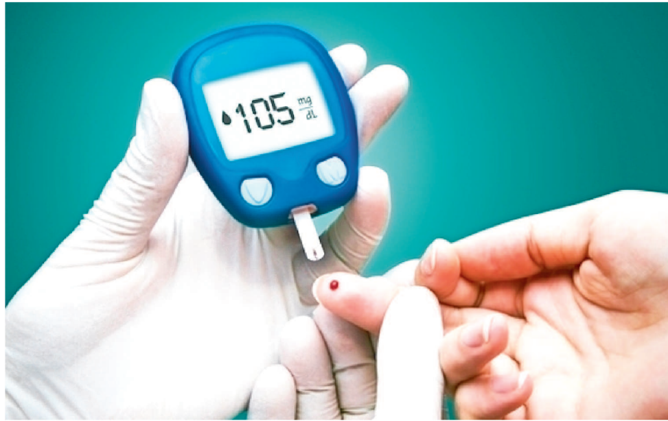
AS COMPLICAÇÕES DA DOENÇA AFETAM VÁRIAS PARTES DO CORPO HUMANO

Estima-se que mais de 50% dos indivíduos com diabetes não tenham conhecimento da própria condição porque ela é silenciosa. Muitas vezes, a doença somente dá pistas de que está fazendo estragos no organismo