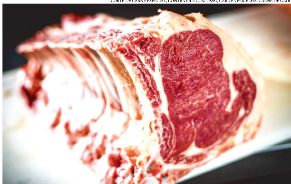
CORTE DE CARNE ESPECIAL, CONTRA FILÉ COM OSSO, CARNE VERMELHA, CARNE DE GADO

A Rússia, que no passado chegou a ser um dos maiores mercados para o