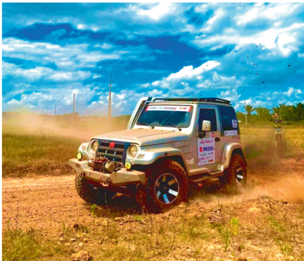
NO RALLY INDOOR, OS COMPETIDORES TERÃO QUE CUMPRIR UM ROTEIRO DE 4 VOLTAS