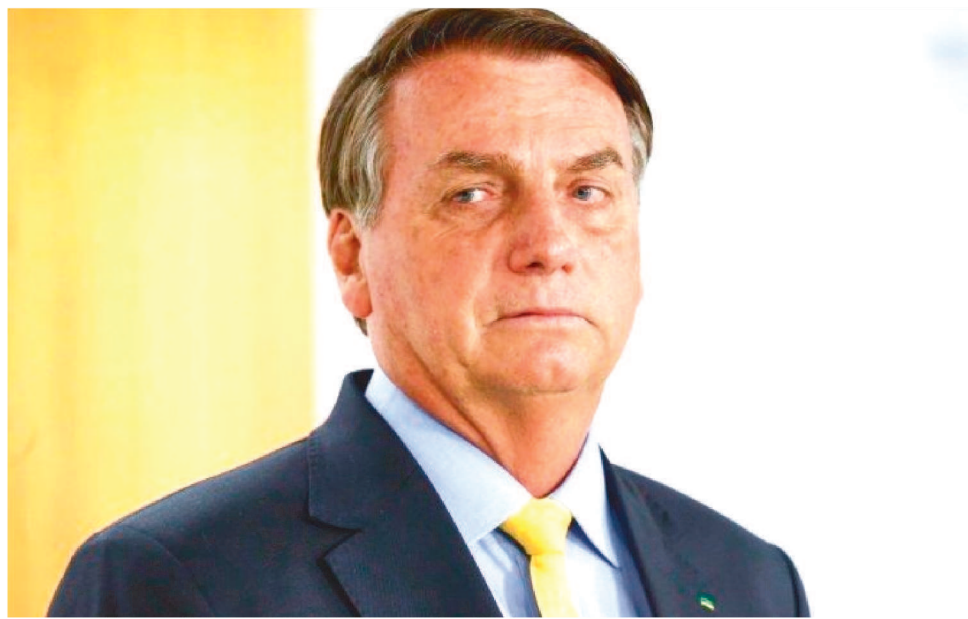
A AGU ENTROU COM UM MANDADO DE SEGURANÇA PARA QUE O SIGILO FOSSE MANTIDO

Na decisão, Moraes afirmou que “não viu utilidade na obtenção pela CPI das informações e dos