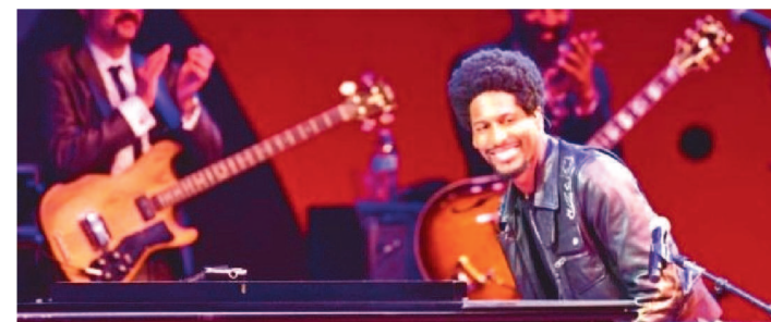
VENCEDOR DO OSCAR, JON BATISTE LIDERA AS INDICAÇÕES AO GRAMMY COM 11

A Academia de Gravação anunciou, nesta terça-feira (23/11), os indicados à 64ª edição do Grammy Awards, maior premiação musical do mundo. Recheada de grandes nomes do mundo da música. A cerimônia de entrega será realizada em 31 de janeiro de 2022. Ainda não há o anúncio de quem vai apresentar o prêmio.