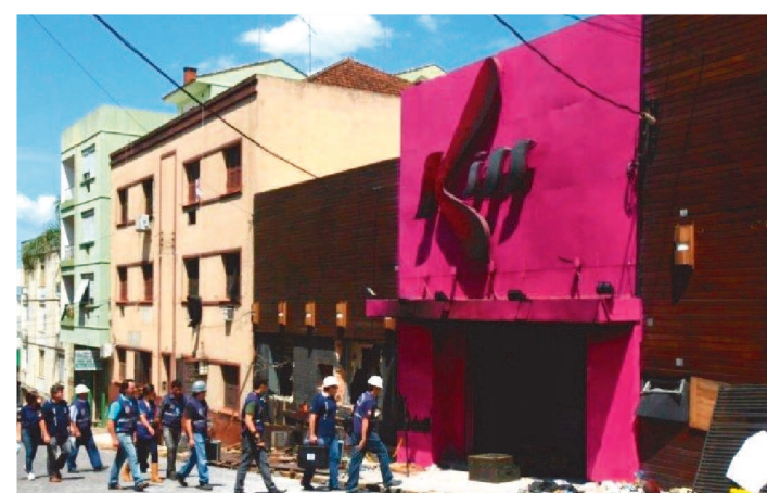
AS GRAVAÇÕES DA MINISSÉRIE SERÃO INICIADAS EM 2022

A Netflix anunciou, nesta terça-feira (23/11), a produção de uma minissérie sobre o incêndio na boate Kiss.