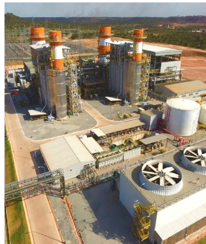
AS VAGAS SÃO PARA USINA EM SANTO ANTÔNIO DOS LOPES

A Techint Engenharia e Construção, responsável pela construção e montagem da Usina Termelétrica Parnaíba V, busca profissionais especializados para atuar no projeto de Santo Antônio dos Lopes. As oportunidades são para profissionais nas seguintes funções: Isolador, funileiro montador e funileiro traçador.