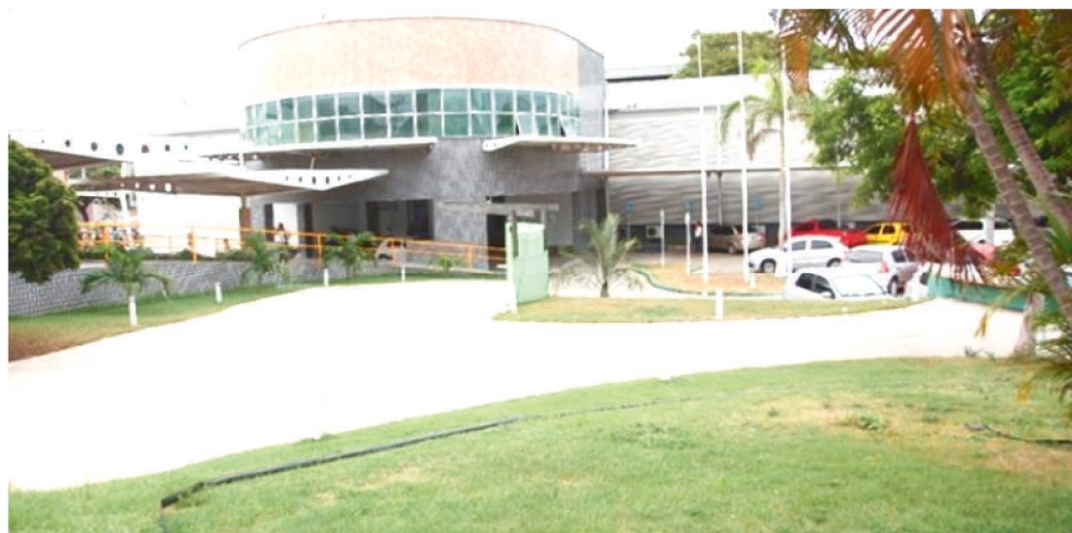
A SELEÇÃO OCORRERÁ POR MEIO DE PROVAS, APLICADAS NO DIA 16 DE JANEIRO DE 2022

Em relação às formas de ensino dos cursos ofertados, os candidatos poderão optar por uma das três: integrado, voltados para quem ainda vai cursar as disciplinas regulares do currículo do ensino médio, e ao mesmo tempo receber a formação técnica na área desejada; concomitante, para quem está matriculado no ensino médio em outra instituição de ensino e pretende apreender paralelamente os conhecimentos técnicos de um curso profissionalizante; e subsequente, destinado