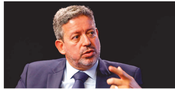
PEC É APOSTA DO GOVERNO PARA VIABILIZAR AUXÍLIO BRASIL

A promulgação da PEC dos Precatórios tem provocado um impasse no Congresso. O presidente da Câmara, Arthur Lira (PP-AL), defende que os pontos do texto que forem consenso entre a Casa e o Senado sejam desmembrados e promulgados, ainda neste mês. As demais partes, na avaliação dele, devem tramitar normalmente pelas comissões antes de irem ao plenário da Câmara. Uma decisão deve ser tomada nesta segunda-feira.