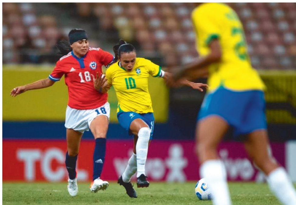
MARTA REVELOU QUE TODOS TEM QUE TER PACIÊNCIA COM A RENOVAÇÃO DA SELEÇÃO

A Rainha e capitã da Seleção lembrou da importância de ter paciência e confiança no processo de aprendizado de quem está chegando ao grupo e destaca que o Torneio Internacional de Manaus serviu para que o público também conhecesse as “novas caras”. “Acho que foi super importante, principalmente para as meninas mais novas, e para que o público comece a identificar as caras novas da Seleção. A gente visa coisas muito maiores, sabemos que os desafios serão sempre maiores, e é importante para elas vivenciar isso aqui. Em datas Fifa é sempre importante fazer jogos. Nem sempre teremos a oportunidade de enfrentar equipes tão qualificadas,