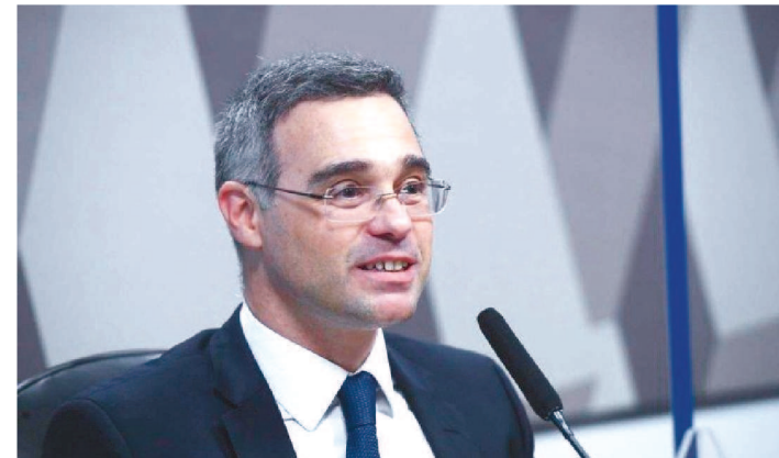
NOVO MINISTRO JULGARÁ TEMAS CONSIDERADOS POLÊMICOS

O novo ministro do Supremo Tribunal Federal (STF), André Mendonça, vai herdar 911 processos que estavam sob relatoria do seu antecessor, o ministro aposentado Marco Aurélio Mello — que se retirou da Corte em julho deste ano. Mas o que está incomodando um grupo de apoiadores do governo é que o recém-chegado magistrado participará do julgamento de temas considerados polêmicos — alguns deles abordarão questões como o bloqueio de perfis de bolsonaristas nas redes sociais, a prisão após condenação em segunda instância e os direitos da comunidade LGBTQIA.