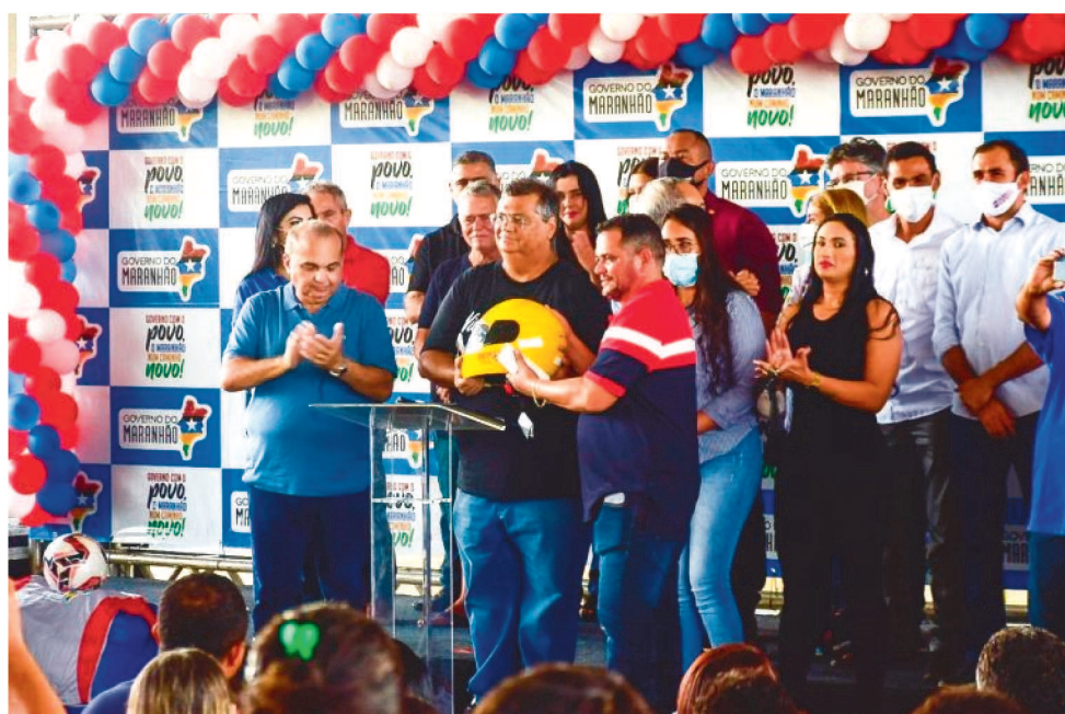
GOVERNADOR ANUNCIU NOVAS OBRAS EM DIVERSAS ÁREAS DO MUNICÍPIO

Na ocasião, o governador Flávio Dino lembrou investimentos anteriores,