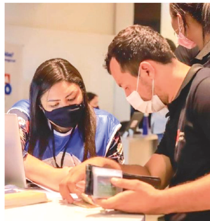
A CENTRAL DE ATENDIMENTO FUNCIONARÁ ATÉ O DIA 10

Começam nesta segunda-feira (6), em Balsas, as negociações do Programa Dívida Zero, do Instituto de Promoção e Defesa do Cidadão e Consumidor do Maranhão (Procon/MA). O evento ocorre até sexta-feira (10), na unidade do VIVA/Procon.