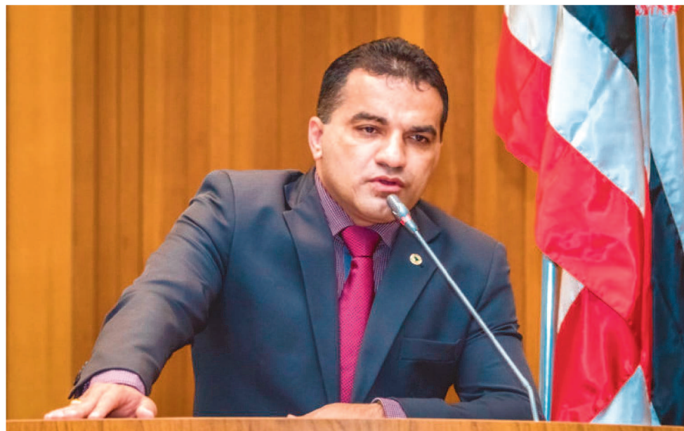
PRÉ-CANDIDATO A GOVERNO DO MARANHÃO DIZ QUE QUEREM MANCHAR SUA IMAGEM

Já o deputado nega qualquer irregularidade. “Vocês sabem que sou empresário, mas mesmo assim os adversários usam esse momento para tentar nos agredir”, foi o que disse em vídeo publicado em suas redes sociais.