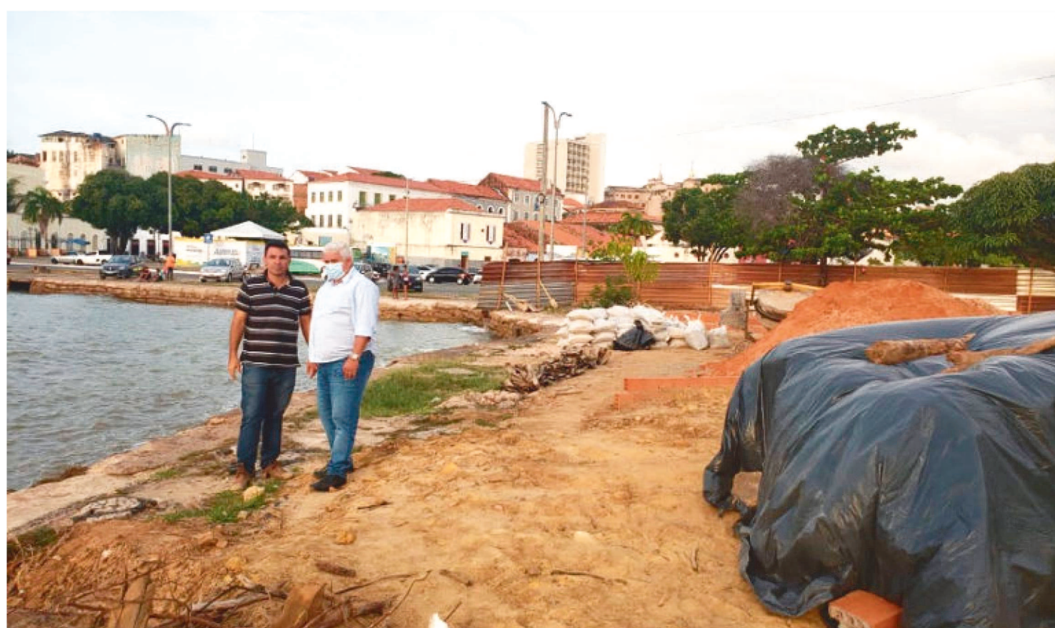
ESTAREMOS GERANDO UM LOCAL SEGURO E BONITO E POTENCIALIZANDO O TURISMO NA REGIÃO, DISSE O PRESIDENTE DA AGEM

Um espaço localizado entre o Terminal Integração e a Rampa Campos Melo está recebendo serviços para se transformar em uma praça. A iniciativa é do Governo do Estado, por meio da Agência Executiva Metropolitana (AGEM) e tem por objetivo a melhoria de um dos pontos de maior potencial turístico do Centro Histórico da capital.