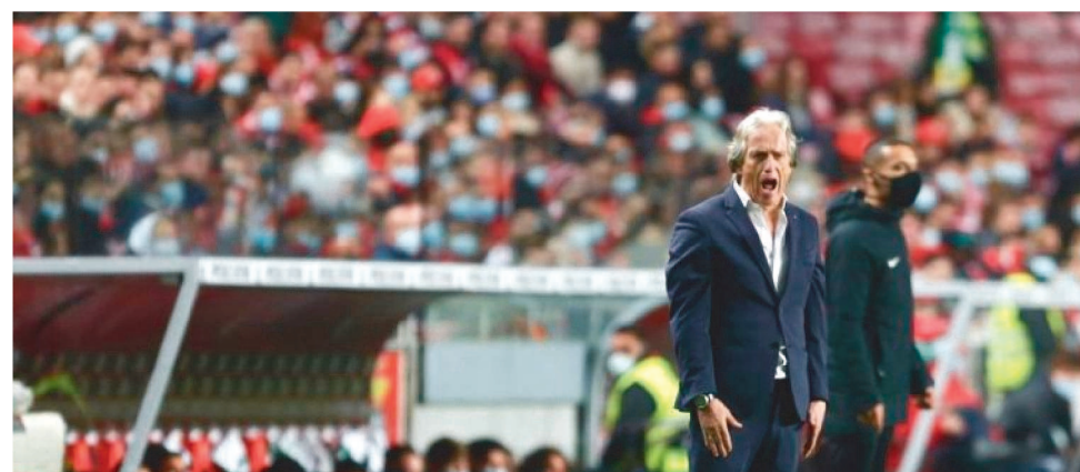
FLAMENGO ESPERA POR DEFINIÇÃO DA CHAMPIONS LEAGUE PARA TER JORGE JESUS

A avaliação do Flamengo é de que questionar Jorge Jesus sobre a chance