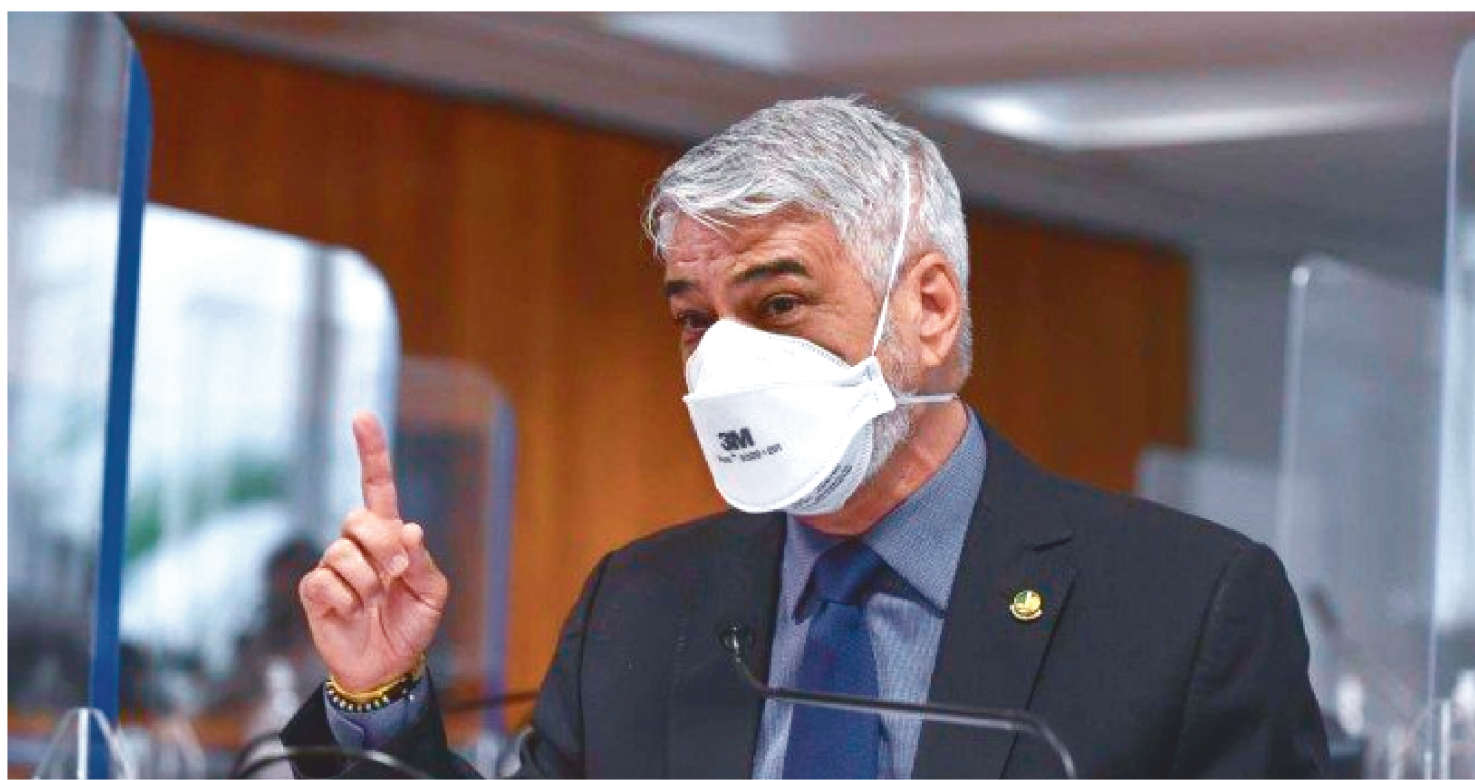
A PRESIDENTE DO PARTIDO, DEPUTADA GLEISI HOFFMAN (PR), APRESENTOU A PROPOSTA, QUE FOI ACEITA PELO DIRETÓRIO NACIONAL

O PT decidiu, ontem, abrir uma série de conversas para criar uma federação partidária com o PSB, PCdoB, PSol e PV. A presidente do partido, deputada Gleisi Hoffman (PR), apresentou a proposta, que foi aceita pelo diretório nacional.