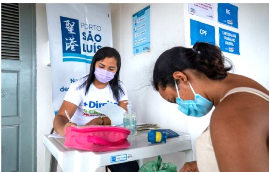
Os moradores da comunidade receberam além da ação de saúde, oferta de serviços de cidadania em parceria com o PROCON-MA

O Porto São Luís promoveu mais uma ação social beneficiando os moradores do Cajueiro, Mãe Chica e comunidades vizinhas do empreendimento. Dessa vez o foco foi a oferta de serviços de saúde e de cidadania. Na última terça-feira (7) foram ofertados à comunidade diversos serviços gratuitos: Palestras sobre violência em geral, assistência jurídica, consultas médicas e farmácia básica, exames de glicemia e aferição de pressão arterial, exame ginecológico e preventivo para mulheres; além de vacinação geral e testes rápidos de HIV, Sífilis e Hepatites. Do Viva Cidadão teve ainda: emissão de rg, cpf, carteira de trabalho, cartão do sus e atendimentos do Procon – MA. A ação foi realizada na sede do Porto São Luís em parceria com Procon-MA, Secretaria de Estado da Saúde, SEMU e Posto de Saúde da Vila Nova. A comunidade compareceu em peso e aprovou a ação, que veio suprir uma situação de carência daquela região. O saldo foi mais que positivo. Em apenas um dia, no total foram realizados 751 atendimentos, sendo 472 atendimentos de saúde e 279 atendimentos do PROCON-MA.