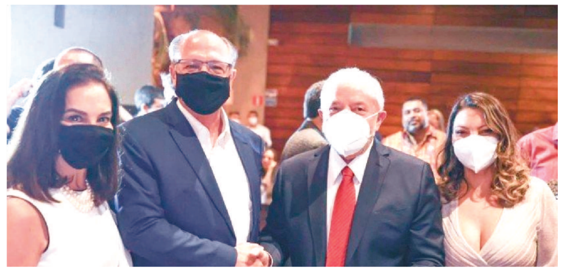
A LEGENDA TAMBÉM APROVOU A CRIAÇÃO FEDERAÇÃO COM O PSB, PCDOB E PT

Os presidentes regionais do Partido Verde aprovaram a criação federação com o PSB, PCdoB e PT em reunião com presidentes estaduais da legenda, nesta terça-feira (21/12). Também foi aprovado o apoio à candidatura do ex-presidente Luiz Inácio Lula (PT) à Presidência da República. O presidente nacional da legenda, José Luiz Penna, diz que a chapa Lula-Alckmin representa “a frente democrática que irá vencer o autoritarismo, tirando Jair Bolsonaro da Presidência da República”. Em 2017, Penna foi secretário da Cultura do Estado de São Paulo, durante o governo Alckmin.