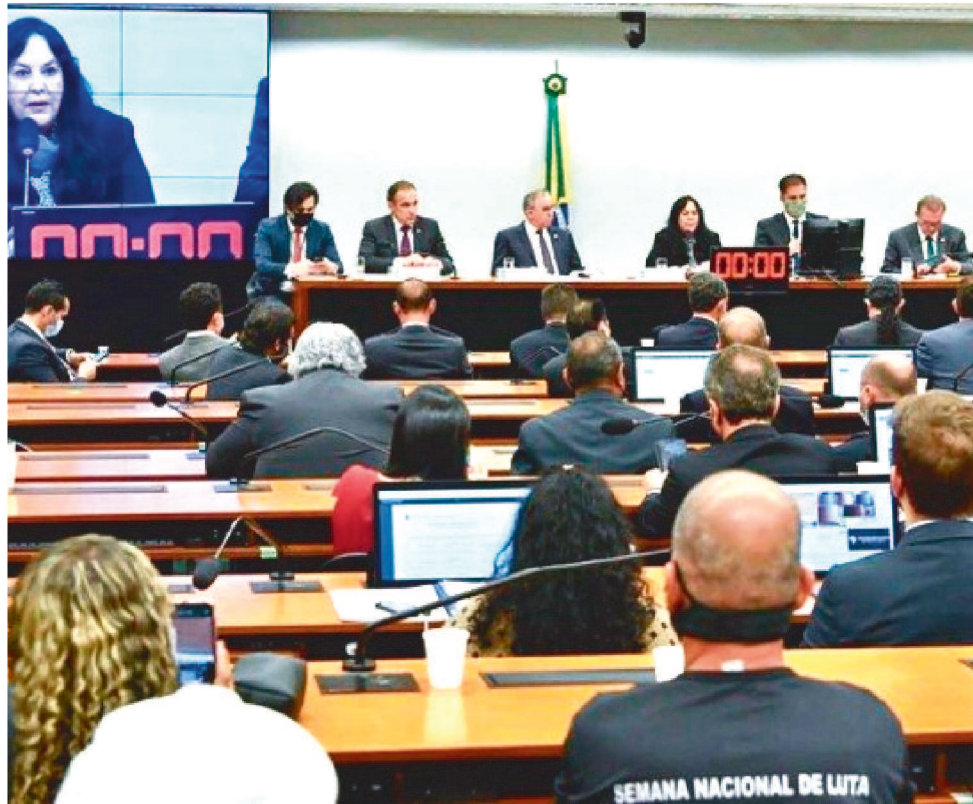
RODRIGO PACHECO E MARCELO RAMOS QUEREM FAZER A VOTAÇÃO RAPIDAMENTE

Orçamento de 2022 segue agora para apreciação do Congresso Nacional. Em sessões diferentes, deputados e senadores vão votar o texto.