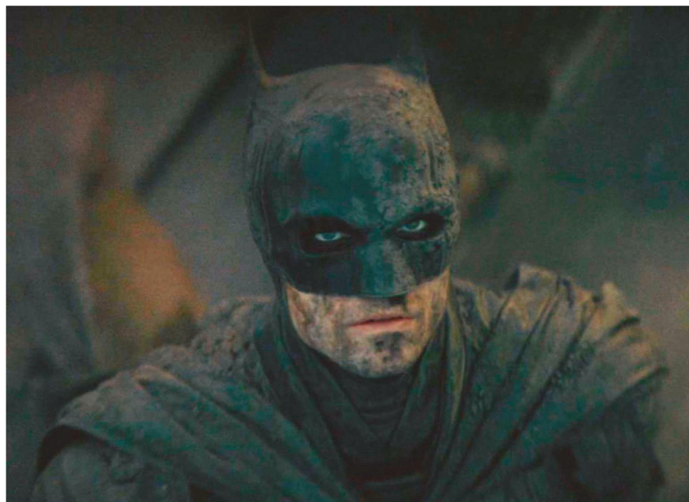
THE BATMAN FOI UM DOS FILMES ADIADOS DESDE O INÍCIO DA PANDEMIA DE COVID-19

Pânico – 13 de janeiro; Morbius – 21 de janeiro; Uncharted – 18 de fevereiro; The Batman – 03 de março; Red: Crescer é uma Fera – 11 de março; Sonic 2 – O Filme – 07 de abril de 2022; Animais Fantásticos: Os Segredos de Dumbledore – 15 de abril; Doutor Estranho no Multiverso da