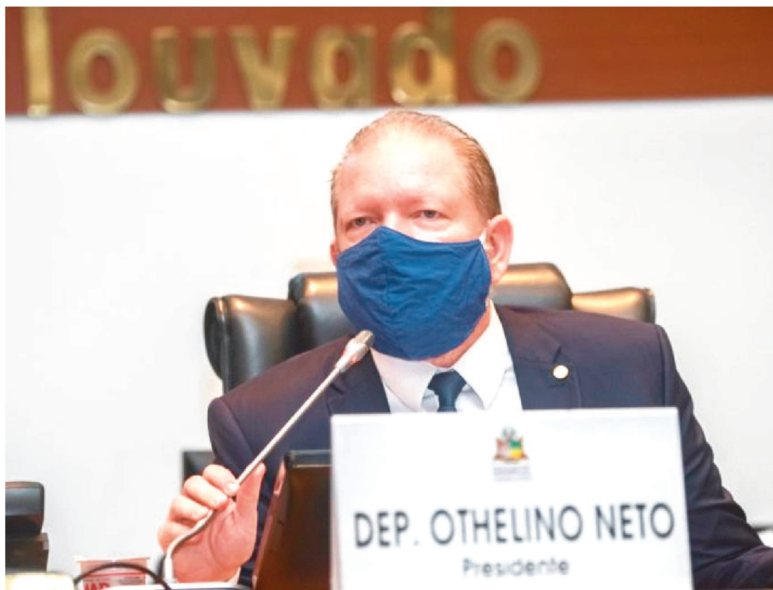
DEPUTADO APRESENTA O RELATÓRIO DE ATIVIDADES DESENVOLVIDAS PELA CASA NO ANO DE 2021

O presidente da Assembleia Legislativa do Maranhão, deputado Othelino Neto (PCdoB), apresenta o Relatório de Atividades desenvolvidas pela Casa no ano de 2021. Será no hall de entrada do plenário da Assembleia, nesta quarta-feira (22), às 9h. A ação visa reafirmar a importância do trabalho legislativo e o impacto deste na vida do cidadão maranhense.