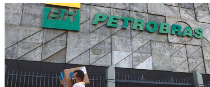
TODAS AS VAGAS SÃO PARA PROFISSIONAIS DE NÍVEL SUPERIOR

A Petrobras abriu inscrições para concurso público que selecionará 757 profissionais para cargos de nível superior, além da formação de cadastro de reserva. As inscrições ficarão abertas até o dia 5 de janeiro de 2022.