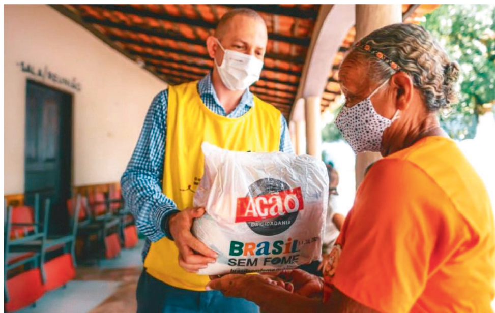
CESTAS BÁSICAS SÃO DISTRIBUÍDAS EM TODO O PAÍS, INCLUSIVE PARA O MARANHÃO

A Ação da Cidadania atuou em parceria com a Rede Voluntária Vale, plataforma de voluntariado da Vale, via matching: a cada R$ 1 doado pelo site da Rede Voluntária, a Vale doava R$ 10. A meta de R$ 200 mil em doações de voluntários para garantir R$ 2 milhões em doações da Vale foi alcançada e todo o valor foi revertido em cestas básicas entregues pela Ação da Cidadania nos estados do Rio de Janeiro, Espírito Santo, Minas Gerais, Maranhão, Pará e Mato Grosso do Sul. "Acreditamos no potencial da união de pessoas, empresas e entidades para contribuir para a transformação social e para a melhoria da qualidade de vida das pessoas. É gratificante ver que a nossa mobilização com agentes que atuam no combate à fome tenha amenizado um pouco a dor de tantas famílias brasileiras que enfrentam dificuldades para se alimentar diariamente", afirma Eduardo Bartolomeo, presidente da Vale. "Na guerra contra a fome, nos aliamos a entidades especializadas e conhecedoras do Brasil profundo, para criar a capilaridade e inteligência suficientes e levar alimento aos mais necessitados, especialmente em áreas rurais ou isoladas.