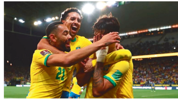
BRASIL ESTÁ COLADO NA BÉLGICA, QUE LIDERA A LISTA DA FIFA

A Fifa divulgou o último ranking de 2021. Pelo quarto ano consecutivo, a Bélgica liderou a lista, mas o Brasil, o segundo colocado, vem logo na cola, com uma pequena diferença de 2,1 pontos. Atual campeã mundial, a França completa o “pódio”, que se mantém inalterado.