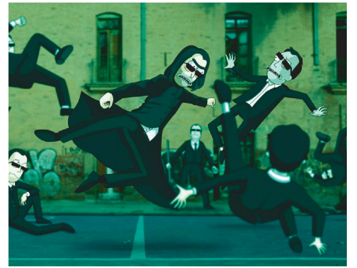
NA IMAGEM, RICK SANCHEZ ESTÁ VESTIDO COMO O NEO

The Matrix Resurrections, o novo filme da saga Matrix, mal estreou nos cinemas e já está rendendo burburinho nas redes sociais. A animação Rick and Morty é uma das atrações que entraram no hype do novo filme e publicaram uma arte própria no universo da simulação.