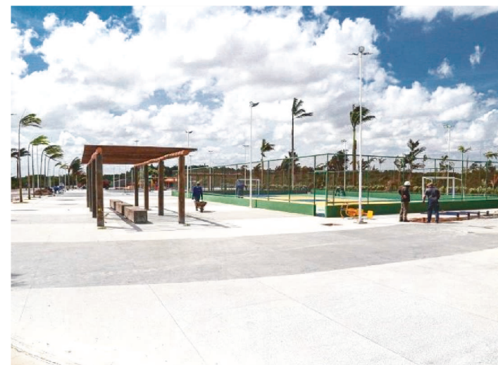
URBANIZAÇÃO DA ORLA ESTÁ EM FASE DE CONCLUSÃO

Na área Itaqui-Bacanga, em São Luís, estraram em fase final as obras de urbanização da orla marítima da Praia do Bonfim, que deve ser entregue ainda no final deste ano. O novo equipamento, que tem modificado a paisagem e irá gerar emprego e renda em todo o entorno da praia, também será um novo espaço para integração e convívio de famílias. Este é mais um investimento do Governo do Maranhão em São Luís, por meio da Secretaria de Estado das Cidades e Desenvolvimento Urbano (Secid).