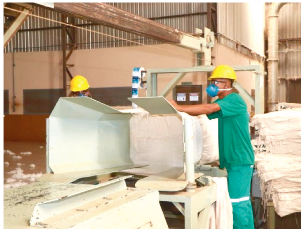
NO TOTAL, FORAM 41.567 NOVAS VAGAS GERADAS. UMA VARIAÇÃO RELATIVA DE 8,44%

“Para enfrentar a pandemia do coronavírus, não medimos esforços para criar oportunidades que pudessem chegar a todos os maranhenses. Assim tem sido a gestão do governador Flávio Dino para continuar o trabalho