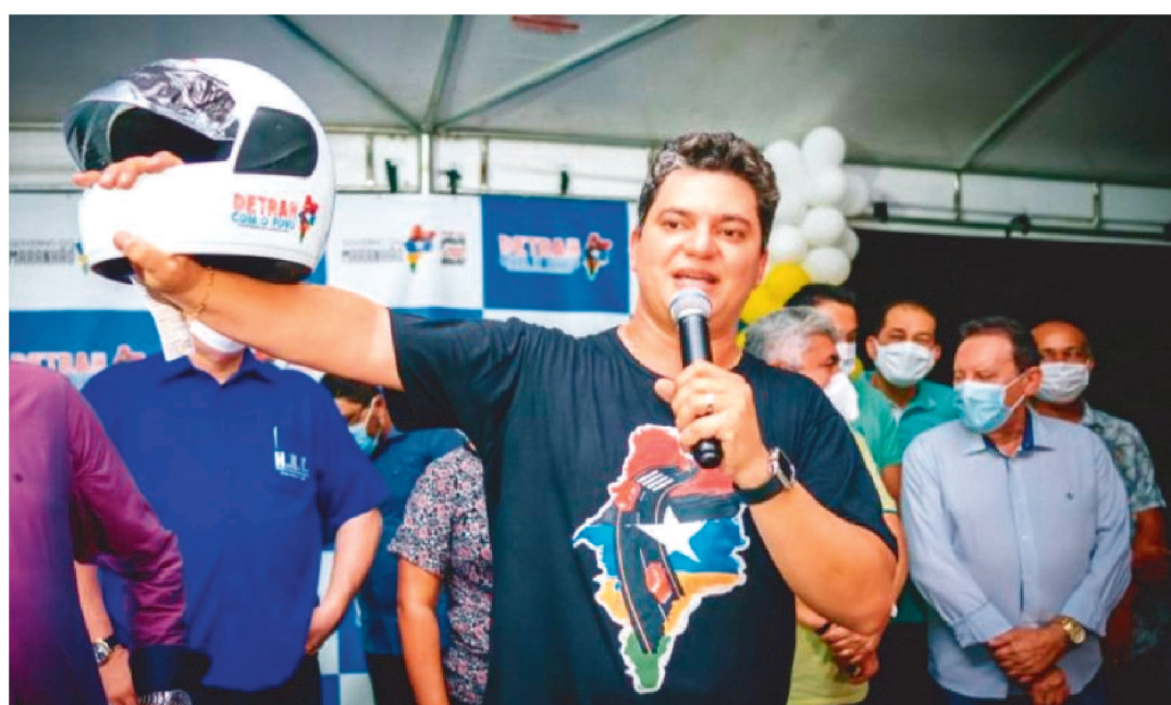
AÇÃO NO TERM. RODOVIÁRIO DE SÃO LUÍS SERÁ REALIZADA HOJE PARA ALERTAR CONDUTORES

O Detran Maranhão, em parceria com a Polícia Rodoviária Federal (PRF), desenvolverá, no dia 24 de dezembro, um conjunto de atividades educativas que unificam as campanhas estadual ‘Feriado Bom é Feriado Seguro’ e a federal ‘Operação Rodovia’, ambas com objetivo de reduzir acidentes e vítimas no trânsito. A ação acontecerá no terminal rodoviário de São Luís.