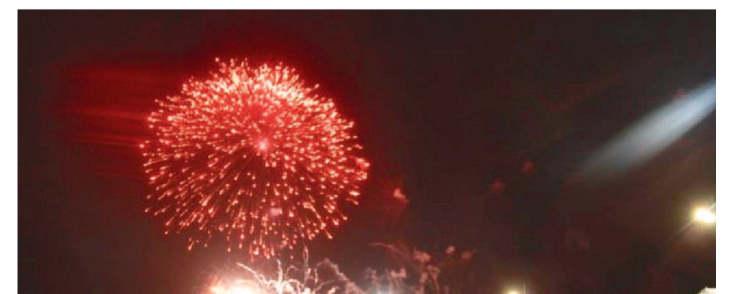
POLICIAMENTO NA CAPITAL. JÁ ESTÁ REFORÇADO PARA NATAL

Neste período festivo de fim de ano, quem participar das atrações em locais como a RFFESA e a Praça Pedro II, no Centro Histórico da capital, assim como em outros lugares da Grande Ilha, já pode contar com toda a segurança reforçada e ações intensificadas pelas operações em vigor da Polícia Militar do Maranhão. O comandante de Polícia Militar do Maranhão, coronel Aritanã Lisboa, destaca que o planejamento para o reforço do policiamento no Centro Histórico foi colocado em prática desde o início das compras de fim de ano.