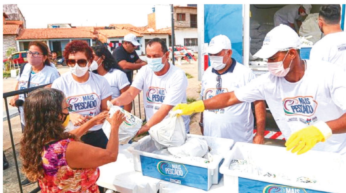
MAIS PESCADO IRÁ ATENDER TAMBÉM AS FAMÍLIAS DOS MUNICÍPIOS QUE COMPÕEM A GRANDE ILHA

Em continuidade às ações que garantem alimento às famílias maranhenses que mais necessitam, o Governo do Maranhão realizou a distribuição de peixes do Projeto Mais Pescado, nesta quarta-feira (23), em São Luís, por meio da Secretaria de Estado da Agricultura (Sagrira).