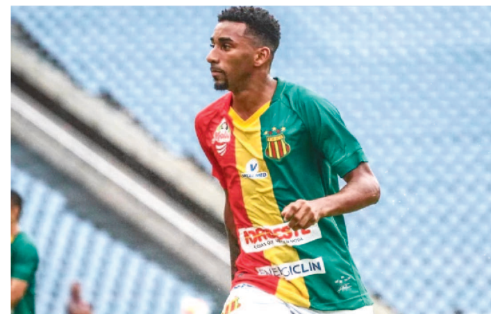
SAMPAIO VAI A SÃO PAULO ENCARAR O ITUANO NO SÁBADO