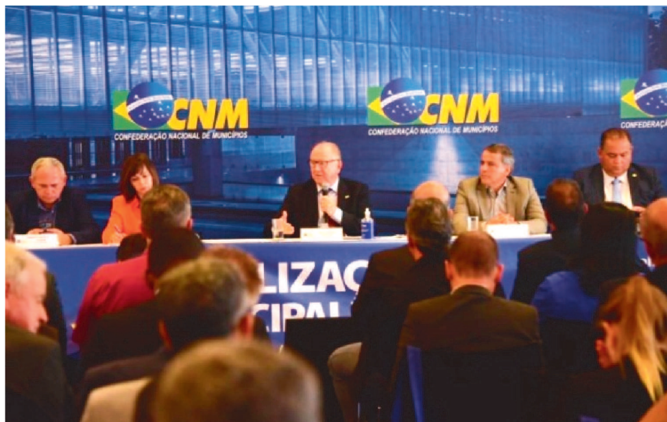
PREFEITOS PEDEM EQUILÍBRIO DA REPARTIÇÃO DA ARRECAÇÃO TRIBUTÁRIA DO PAÍS

A CNM também enfatiza a importância dos municípios na construção da educação brasileira. A instituição pede que as cidades participem "igualmente" da formulação e da definição das políticas educacionais com mecanismos eficientes de financiamento do ensino básico no país.