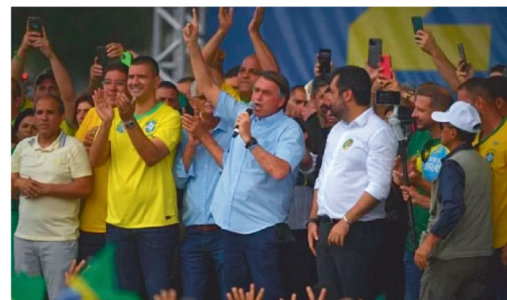
BOLSONARO PARTICIPOU DE COMÍCIO EM SÃO GONÇALO

O presidente Jair Bolsonaro (PL) participou nesta terça-feira (18/10) de um comício na cidade de São Gonçalo, segundo maior colégio eleitoral do Rio de Janeiro. Com ele, no palanque, estavam lideranças cariocas, como o governador do estado, Claudio Castro, que venceu o pleito ao Palácio da Guanabara ainda no primeiro turno.