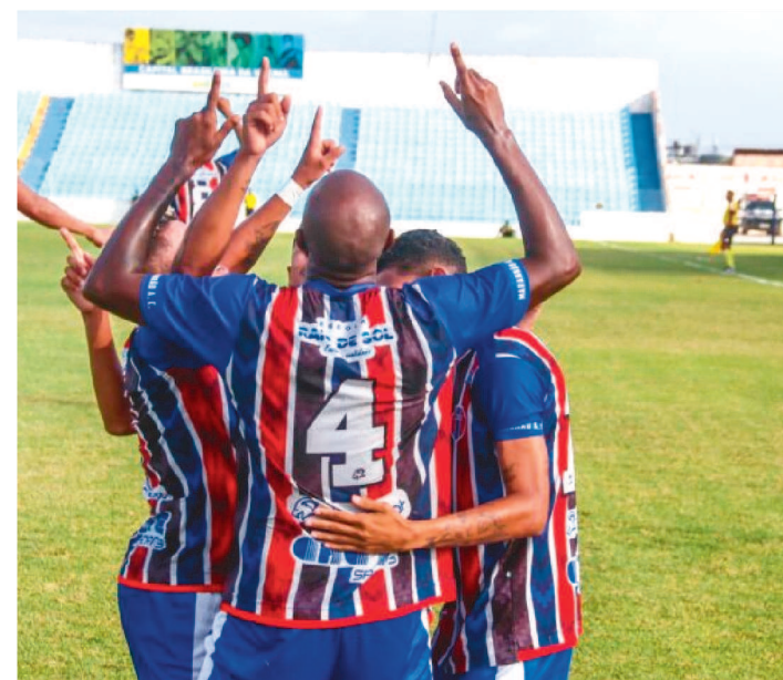
O MAC VEM DE UM EMPATE COM O JUVENTUDE SAMAS

Está definida a data do jogo entre Maranhão Atlético e São José, pela segunda rodada da Copa FMF. A entidade comunicou aos dois clubes que a partida será disputada na noite da segunda-feira (24), a partir das 19h, no Estádio Nhozinho Santos. Esta partida estava com data indefinida na tabela publicada no último fim de semana.