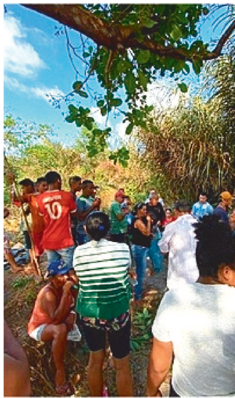
De acordo com o Movimento dos Atingidos por Barragens (MAB), du-

Os relatos dos moradores, no entanto, apontam que a água não está sendo fornecida pela empresa em quantidade e qualidade adequadas. Como resultado, os moradores têm enfrentado problemas de saúde relacionados ao consumo da água, como coceiras, irritações na pele e dores estomacais