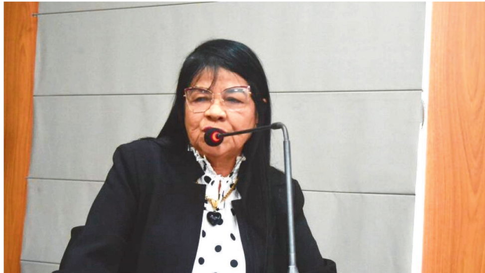
INICIATIVA TRAMITA NAS COMISSÕES DE JUSTIÇA, MOBILIDADE URBANA E ORÇAMENTO

“Transparência pública é dever dos governantes e direito dos cidadãos. A proposta é que todos tenham acesso, com clareza, às informações sobre a gestão financeira ligada aos valores recolhidos em decorrência das multas de trânsito aplicadas em nossa cidade. A divulgação das infrações de trânsito e dos valores arrecadados em razão das multas e a sua destinação,