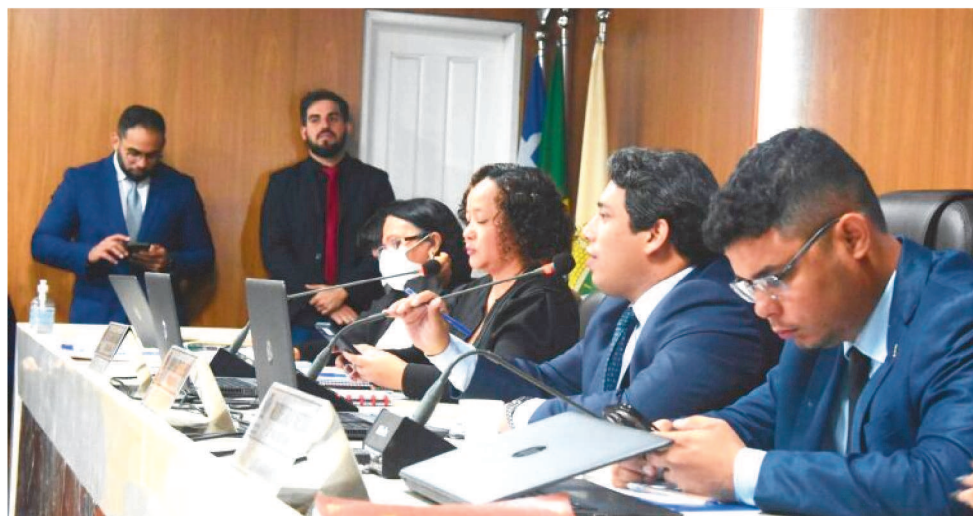
FOI PROPOSTA A ALTERAÇÃO DE LEI CONTRATAÇÃO TEMPORARIA DE PROFESSORES

Na mensagem governamental, o prefeito Eduardo Braide (sem partido) esclarece que o dispositivo visa suprir a demanda temporária e excepcional por profissionais do magistério público municipal, em decorrência da expansão das unidades de ensino. “O incluso do projeto de lei visa suprir a demanda temporária e excepcional por profissionais do magistério público municipal, em decorrência da expansão das unidades de ensino, abertura de turmas, projetos específicos ou disciplinas experimentais, além de substituir servidores, caso não haja