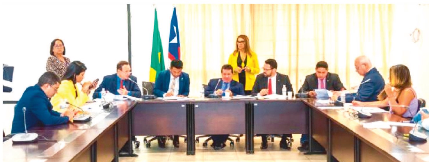
PROPOSIÇÃO TRANSFERE O ORÇAMENTO DO FUNDO DO TRABALHO DO ESTADO DO MARANHÃO PARA O ORÇAMENTO GERAL

A Comissão de Constituição, Justiça e Cidadania (CCJ) aprovou, na última terça-feira (18), dentre outras proposições, parecer favorável ao Projeto de Lei 398/2022, de autoria do Poder Executivo, que cria o Fundo Estadual do Trabalho, e aos Projetos de Lei Complementar 014/2022 e 015/2022, ambos de iniciativa do Poder Judiciário.