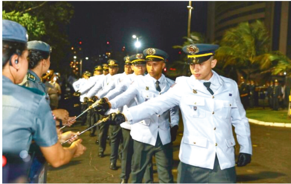
SOLENIIDADE DE FORMATURA OCORREU NO QUARTEL DO COMANDO GERAL DA PMMA

O secretário de Estado da Segurança Pública, coronel Silvío Leite, afirma que a nova turma está pronta para servir a sociedade. “Estamos entregando excelentes profissionais capacitados para atender as necessidades de segurança da sociedade maranhense. Eles serão distribuídos por todas as regiões do estado e tenho a certeza de que farão um bom trabalho”.