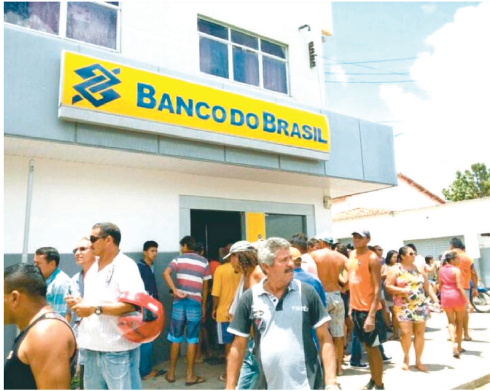
SINDICATO DOS BANCÁRIOS REVELOU QUE ESSE ANO FORAM 5 SAIDINHAS BANCÁRIAS

No site do Sindicato dos Bancários, é possível ver que neste ano, somente de saidinhas bancárias, foram 5 ocorrências, incluindo tentativa de assalto. "Saidinha bancária" é o nome dado ao crime contra o cidadão que acaba de fazer saque em dinheiro junto ao banco. A vítima é escolhida, geralmente por "olheiros", que se encarregam de observar e identificar as pes-