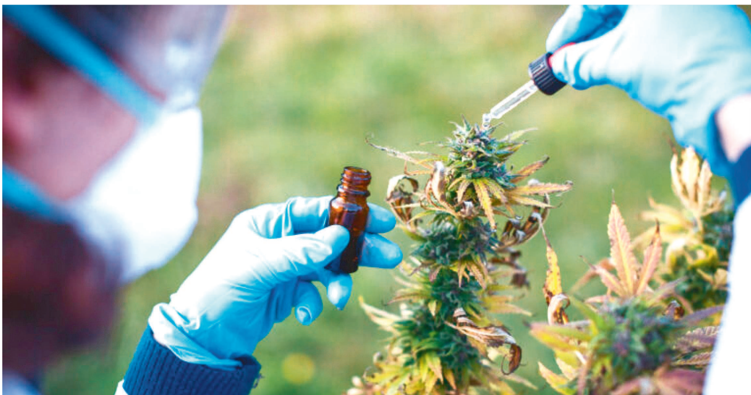
NO BRASIL, SEGUNDO A ANVISA, MAIS DE 100 MIL PACIENTES FAZEM USO DE ALGUM TIPO DE TRATAMENTO COM A SUBSTÂNCIA

O plenário do Conselho Federal de Medicina (CFM) decidiu suspender de forma temporária, nesta segunda-feira (24/10), a resolução que limitava a prescrição médica de canabidiol. Pacientes que fazem uso da cannabis realizaram, na última sexta-feira (21), um protesto silencioso contra a Resolução 2.324/22 em frente ao Conselho Federal de Medicina, em Brasília, e em outras capitais.