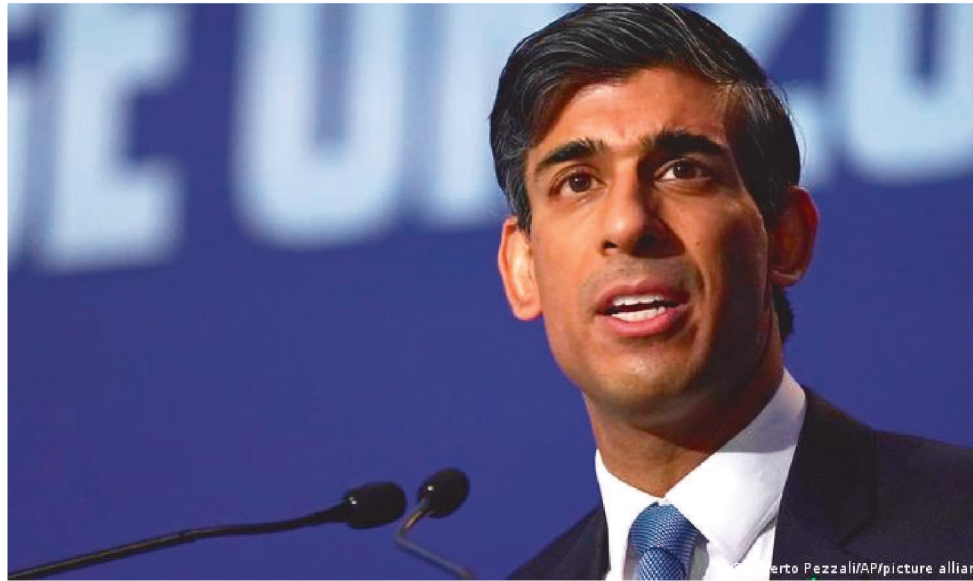
SUNAK PROMETEU COLOCAR ESTABILIDADE E CONFIANÇA ECONÔMICAS COMO FOCO

Sunak foi designado na segunda-feira o novo líder do governante Partido Conservador. Nesta terça, durante