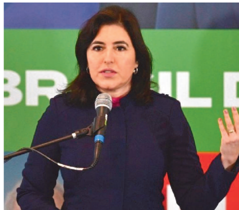
SEGUNDO ANTÓNIO COSTA, “O BRASIL E O MUNDO” PRECISAM DE LULA

Na ocasião, Bolsonaro disse que não viu “nenhum depoimento mais contundente de qualquer mulher”. Em seu Twitter, Tebet disse que a fala