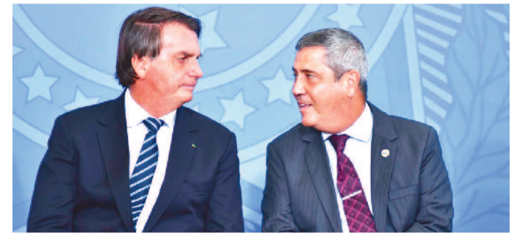
BOLSONARO E BRAGA NETTO SERÃO INVESTIGADOS PELO TSE

O ministro Benedito Gonçalves, corregedor-geral eleitoral do Tribunal Superior Eleitoral (TSE), abriu nesta quarta-feira (14/12) uma investigação para apurar a conduta do presidente Jair Bolsonaro (PL) e de seus aliados por tentarem desacreditar o processo eleitoral brasileiro e o resultado das urnas eletrônicas — que definiu Luiz Inácio Lula da Silva (PT) como presidente da República. Os alvos da investigação são: Jair Bolsonaro, ex-ministro Braga Netto, senador Flávio Bolsonaro (PL-RJ); deputados federais Eduardo Bolsonaro (PL-SP), Carla Zambelli (PL-SP) e Bia Kicis (PL-DF); deputados eleitos Nikolas Ferreira (PL-MG) e Gustavo Gayer (PL-GO); e senador eleito Magno Malta (PL-ES).