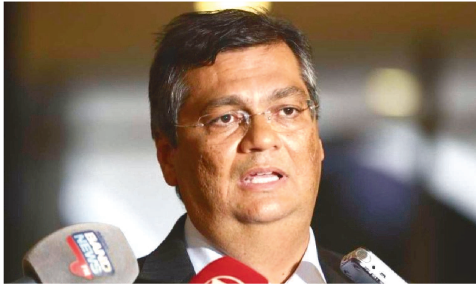
SEGUNDO DINO, A POLÍCIA SÓ PODERÁ EFETUAR PRISÕES POR MEIO DE INQUÉRITOS

“Legalmente falando, as prisões em flagrante são um dever, mas, quando elas não acontecem no momento, já não podem ocorrer porque, como indica, só são viáveis no momento do flagrante. A partir do momento que não houve a prisão, o que deve e está sendo feito é a realização dos inquéritos policiais para que, eventualmente, se for o caso, haja pedido de prisão preventiva ou temporária”, declarou Dino, em coletiva no Centro Cultural Banco do Brasil (CCBB).