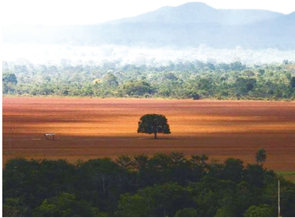
FORAM 10.688,73 KM 2 PERDIDOS DE VEGETAÇÃO, DE AGOSTO DE 2021 A JULHO DE 2022

O Cerrado se distribui por uma área de cerca de 1 milhão de km 2 de vegetação nativa remanescente, quase duas vezes a área da França. Essa savana tropical representa mais de 5% da bio-