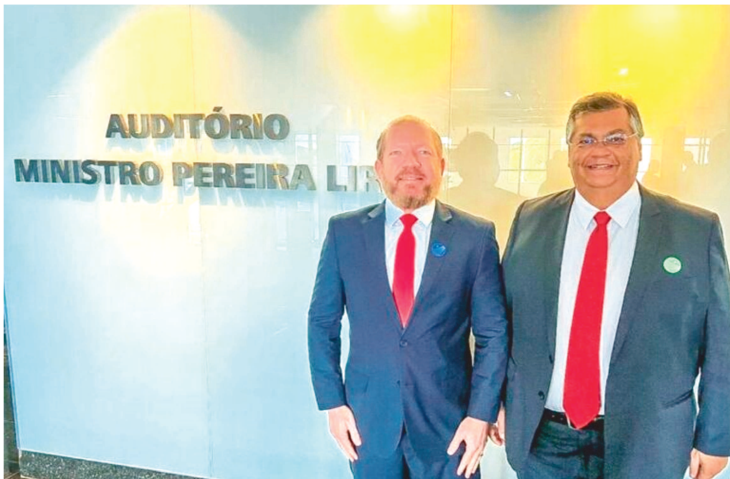
O DEPUTADO OTHELINO NETO E O MINISTRO FLÁVIO DINO PARTICIPARAM DA POSSE DO NOVO PRESIDENTE DO TCU, BRUNO DANTAS

O presidente da Assembleia Legislativa do Maranhão, deputado Othelino Neto (PCdoB), prestigiou, nesta quarta-feira (14), em Brasília, a posse do novo presidente do Tribunal de Contas da União (TCU), ministro Bruno Dantas. O parlamentar estava acompanhado do senador eleito Flávio Dino (PSB), que comandará o Ministério da Justiça e Segurança Pública no governo do presidente eleito Luiz Inácio Lula da Silva.