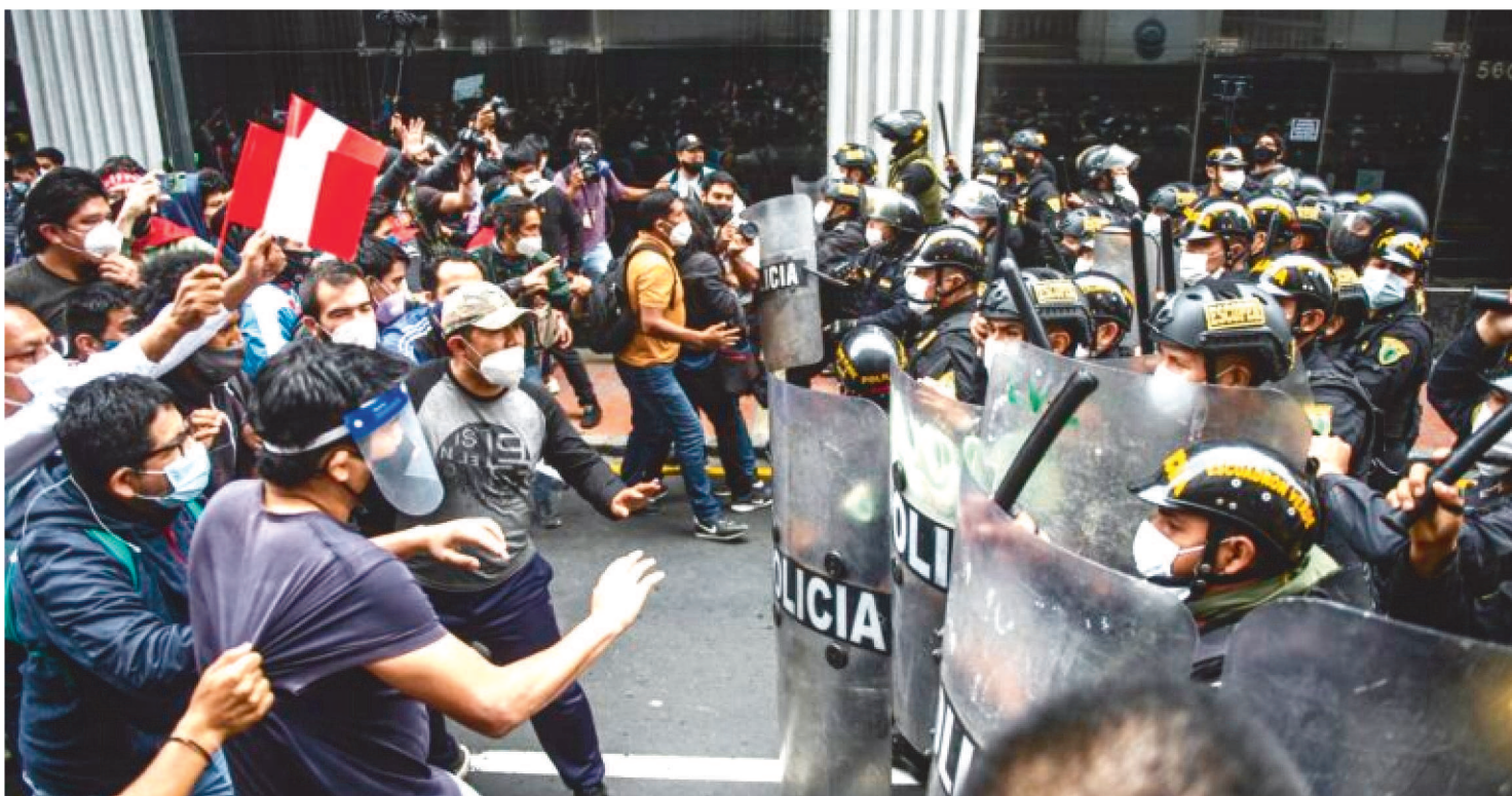
A MEDIDA DA DEFESA PERMITE A ATUAÇÃO DO EXÉRCITO PARA REPRIMIR ATOS QUE JÁ DEIXARAM SETE MORTOS E 200 FERIDOS NO PAÍS

O ministro da Defesa do Peru, Alberto Otárola, anunciou, no início da tarde desta quarta-feira (14/12), que o país está em estado de emergência por 30 dias.