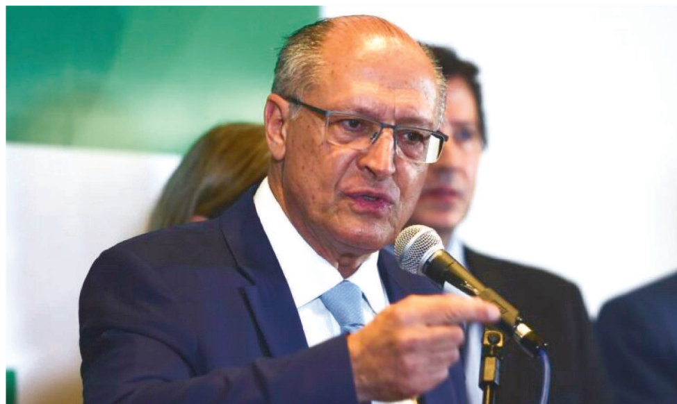
VICE-PRESIDENTE ELEITO SE REUNIU COM ENTIDADES E GOVERNADORES

“Quero dizer também que na PEC que está sendo discutida tem R$ 12 bilhões para melhorar o orçamento da educação. E, para a conectividade da educação, quando foi feito o 5G, foi separado R$ 3,1 bilhões só para conectividade na área educacional”, en-