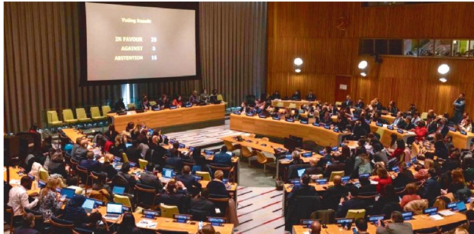
MEDIDA DE EXPULSÃO FOI APRESENTADA PELA DELEGAÇÃO DOS ESTADOS UNIDOS

"Foi perturbador ver quando a República Islâmica ganhou um assento