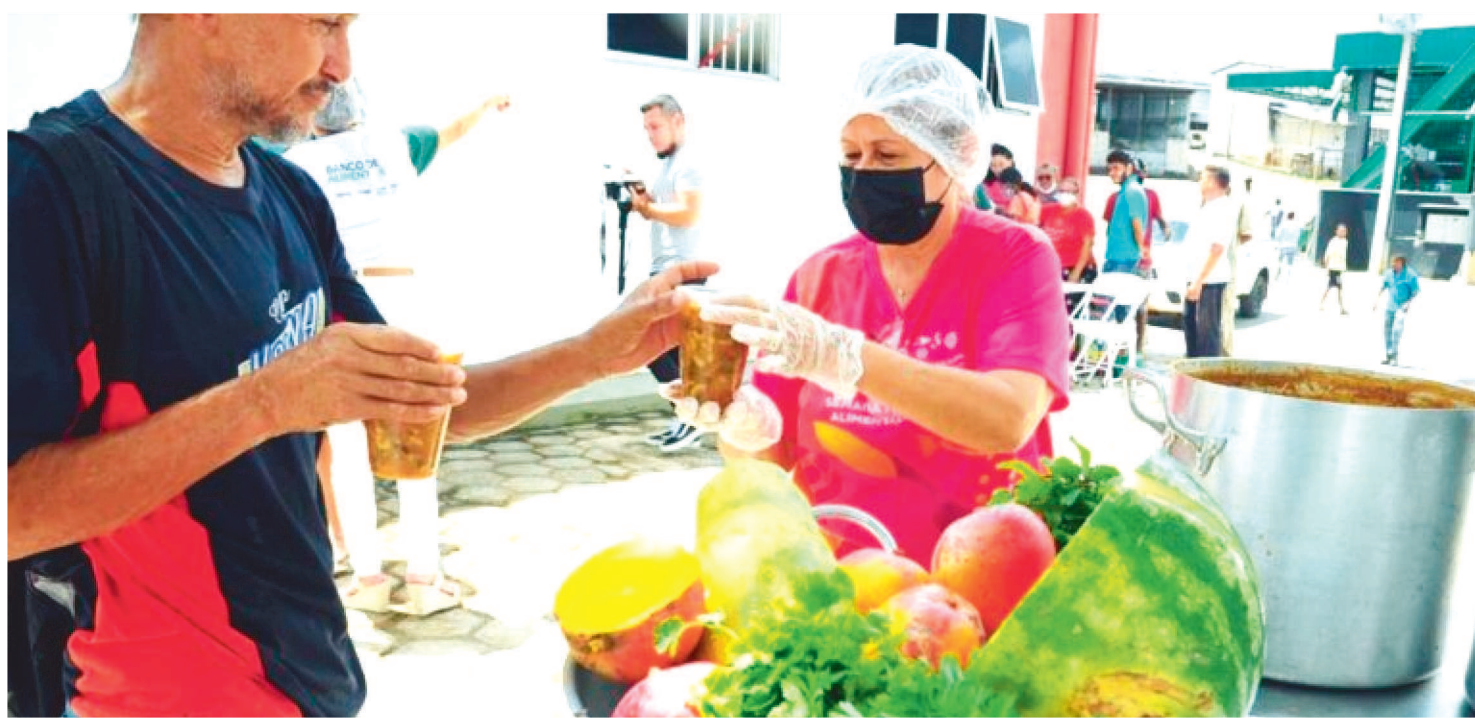
NESTA SEXTA-FEIRA (16), A PARTIR DAS 11H, NA CEASA, TERÁ DISTRIBUIÇÃO DE 200 COPOS DE SOPA PARA TRABALHADORES DA CEASA

A Secretaria de Estado do Desenvolvimento Social (Sedes), por meio do Banco de Alimentos, promove, nesta sexta-feira (16), o Sopão Solidário, a partir das 11h, com a distribuição de 200 copos de sopa para trabalhadores da Ceasa. Além disso, a partir das 9h30, o Banco, em parceria com o município, irá realizar mutirão de vacinação contra a Covid-19 e a Influenza H1N1. Ambas as ações ocorrerão na área externa do equipamento.