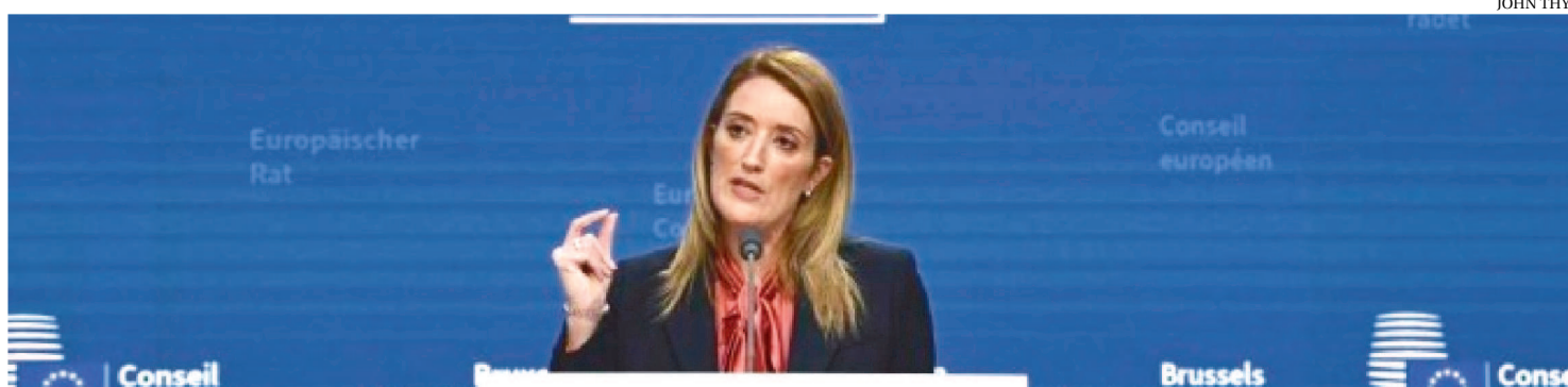
ROBERTA METSOLA FEZ O ANUNCIO DE REFORMA APÓS ESCÂNDALO QUE LEVOU À DETENÇÃO DE UMA INFLUENTE EURODEPUTADA

A presidente do Parlamento Europeu, a maltesa Roberta Metsola, anunciou nesta quinta-feira (15/12) o início de uma "ampla reforma" dos mecanismos de controle na instituição, em resposta ao escândalo que levou à detenção de uma influente eurodeputada grega.