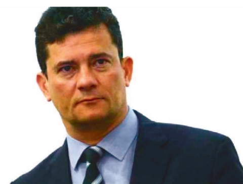
PARA RELATOR, EX-JUIZ TINHA CONDIÇÕES DE ELEGIBILIDADE

O Tribunal Superior Eleitoral (TSE) rejeitou, nesta quinta-feira (15/12), um pedido apresentado pela Federação Brasil da Esperança, formada por PT, PCdoB e PV, que pedia a cassação do registro de candidatura do senador eleito Sérgio Moro (União Brasil-PR). A alegação alegava que o ex-juiz não tinha filiação partidária válida no Paraná. No entanto, para o ministro Raul Araújo, relator da ação, foram satisfeitas as condições de elegibilidade.