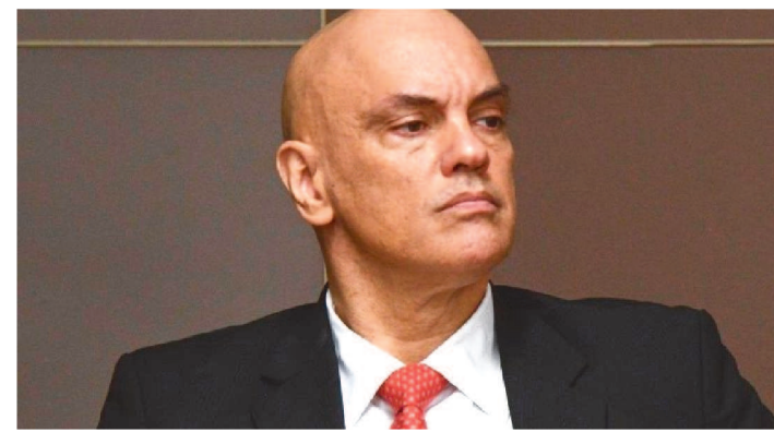
POR SEIS VOTOS A UM, O RECURSO DO PARTIDO FOI REJEITADO

O Tribunal Superior Eleitoral (TSE) negou o recurso do Partido Liberal (PL), nesta quinta-feira (15/12), para revogar a multa de R$ 22,9 milhões por litigância de má-fé pela tentativa da legenda de invalidar votos de uma parte das urnas usadas no segundo turno. A multa foi definida pelo ministro Alexandre de Moraes, presidente da corte.