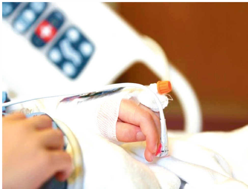
SÃO 12 DE UNIDADE DE TERAPIA INTENSIVA PEDIÁTRICA (UTI PED) E 12 DE ENFERMARIA

“A nova UTI pediátrica foi destinada para casos graves associados à síndrome gripal. Esta UTI possuirá suporte necessário para nível de atenção III. Ela foi dimensionada para oferecer terapia de suporte com complexidade muito alta, sendo monitorização, suporte hemodinâmico e/ou assistência respiratória ou terapia de substituição renal. O atendimento fornecido será feito por uma equipe multiprofissional especializada e habilitada”, detalhou a intensivista pediátrica.