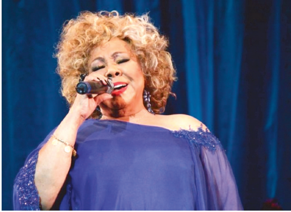
OBRA CONTA HISTÓRIAS DE MULHERES QUE ALCANÇARAM PATAMAR MAIS ALTO DA MPB