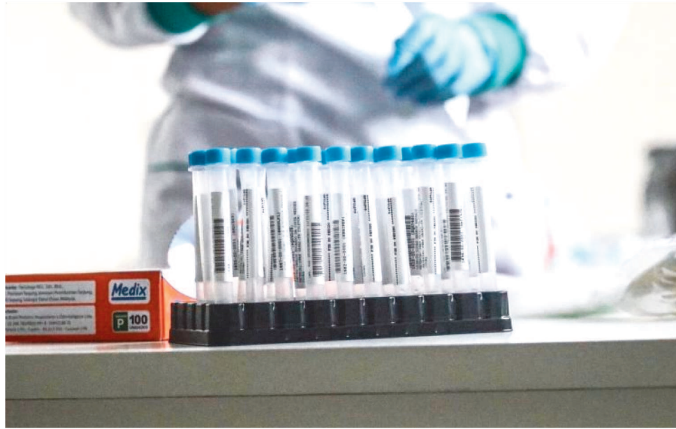
NO ÚLTIMO DIA 30, 264 NOVOS CASOS FORAM REGISTRADOS E 6 ÓBITOS NO ESTADO

“Infelizmente, o Brasil não investiu o que deveria na testagem, então nós estamos com uma testagem baixa. Dessa maneira, a subnotificação é enorme. A boa notícia é que o Brasil já conseguiu vacinar bastante, mas o Maranhão é um dos lanternas, 64 com 51 das duas doses, o que ainda é uma performance considerada ruim. A ocupação de leitos segue abaixo dos 70 por cento, ela pode ainda aumentar, mas ainda existe uma grande capacidade de atender novos leitos se precisar.