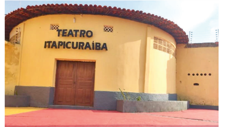
PROJETO SE CHAMA “GRUPO GRITA: UMA ESCOLA DE ARTE”

Cerca de 60 jovens da comunidade do Anjo da Guarda e bairros adjacentes da área Itaquí-Bacanga, entre 12 e 18 anos, foram selecionados para participar do projeto “Grupo Grita: Uma escola de arte”, que vai oferecer oficina interdisciplinar de teatro, canto e dança. As aulas começam nesta terça-feira (1) e terão duração de seis meses. O projeto está sendo realizado pelo Grupo Grita e tem patrocínio do Instituto Cultural Vale.