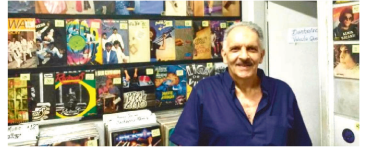
A MAIOR OBRA-PRIMA DE BIZARRO É O ÁLBUM NESSE INVERNO

Tony Bizarro, um dos pioneiros da soul music no Brasil, morreu aos 73 anos. O cantor e produtor enfrentava há anos uma série de problemas de saúde e vivia em uma casa de repouso. O baterista do Azymuth, Ivan Conti Mamão, foi quem comunicou o falecimento do amigo em suas redes sociais.