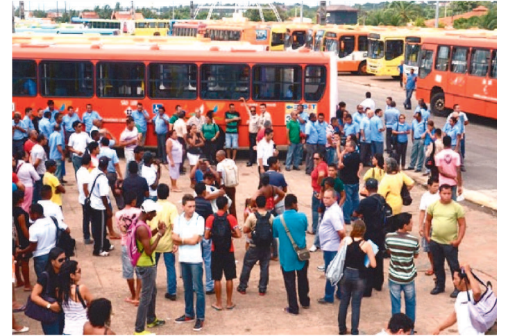
OS RODOVIÁRIOS DEFLAGRAM ESTADO DE GREVE NA ILHA

O sindicato dos Rodoviários do Maranhão, vai se reunir, nesta quinta-feira (10), às 9h40, em audiência de mediação no Ministério Público do Trabalho (MPT-MA).