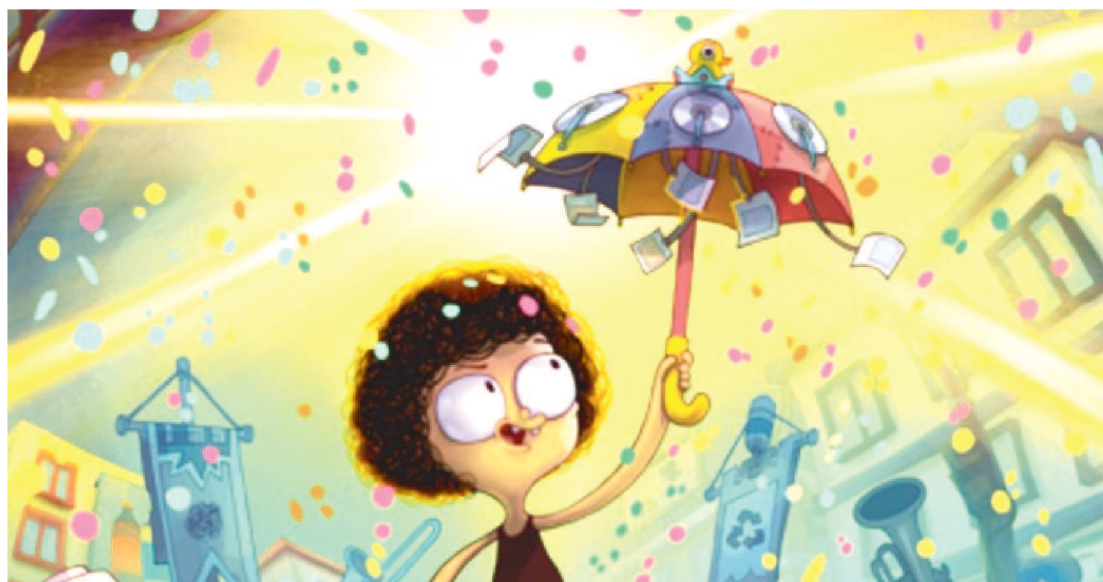
EPISÓDIO ESPECIAL DA ANIMAÇÃO SERÁ LANÇADO DIA 25 DESTE MÊS NO STREAMING HBO MAX

A animação Irmão do Jorel terá um especial de Carnaval, que estreia dia 25 de fevereiro no Cartoon Network e na HBO Max, às 19h15. No episódio especial, a família do Irmão do Jorel quase desiste do Carnaval quando uma marca de refrigerante patrocina a festa e acaba padronizando as fantasias e tocando a mesma marchinha. Tudo muda quando vovó Juju se perde na multidão.