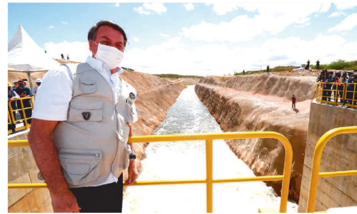
PRESIDENTE ESTEVE EM JUCURUTU, NO RIO GRANDE DO NORTE

O presidente Jair Bolsonaro visitou nesta quarta-feira (9) mais um trecho da obra de transposição do Rio São Francisco. O presidente esteve em Jucurutu, no Rio Grande do Norte, onde visitou as obras da barragem de Oiticica, que vai receber e armazenar as águas da transposição do Rio São Francisco no estado.