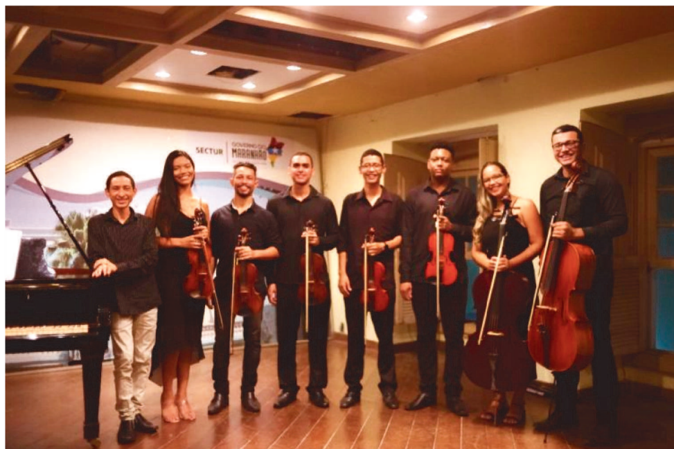
O CONCERTO DE ESTREIA SERÁ NO PALCO DO TEATRO JOÃO DO VALE, NO PRÓXIMO DIA 23

Formada por jovens instrumentistas que despontam com brilhantismo no cenário musical regional e até nacional, fomentará a Música de Concerto no Estado, dando vida à prática de orquestra, e possibilitando ao público local o acesso ao repertório dessa formação.