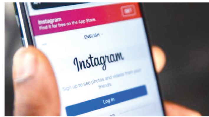
FUNÇÃO ESTARÁ DISPONÍVEL NA NOVA ABA “SUAS ATIVIDADES”

O Instagram começou a liberar funções para remover facilmente postagens, comentários e outras atividades de seus perfis na rede social. O aplicativo vai passar a oferecer um novo recurso para excluir conteúdos em massa e pesquisar por atividades antigas, por exemplo.