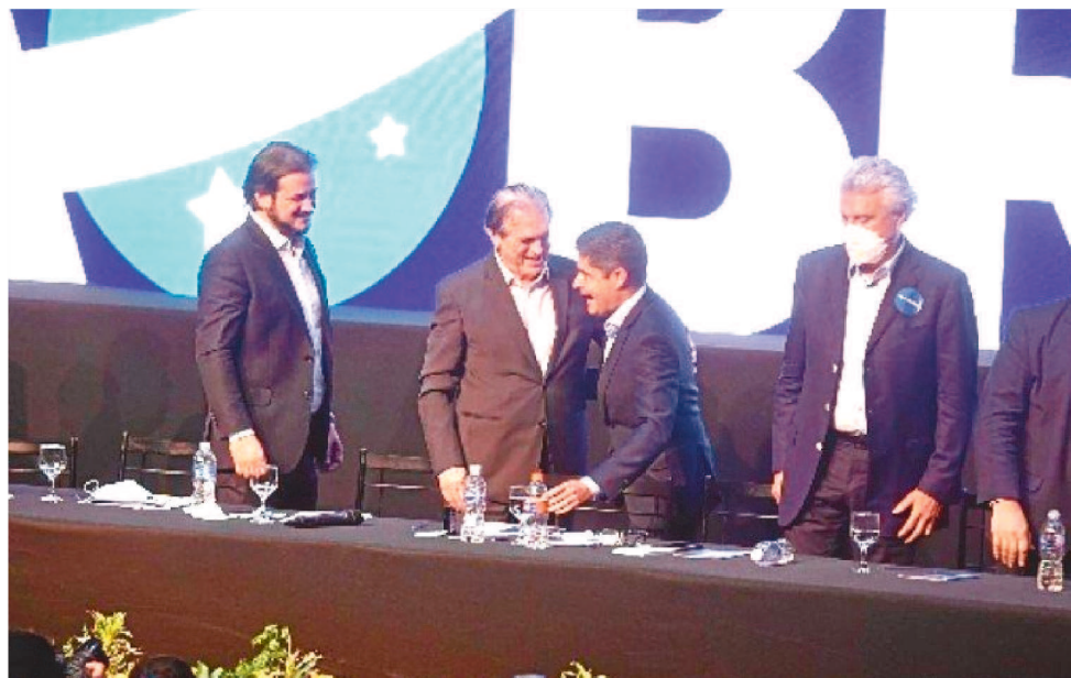
POR UNANIMIDADE, CORTE ELEITORAL AVALIZA A FUSÃO ENTRE PSL E DEM

O Tribunal Superior Eleitoral (TSE) aprovou, ontem, o pedido de registro do estatuto e do programa partidário do União Brasil — fusão do PSL com o DEM. A nova legenda terá a maior bancada na Câmara e, conseqüentemente, a principal fatia dos fundos partidário e eleitoral.