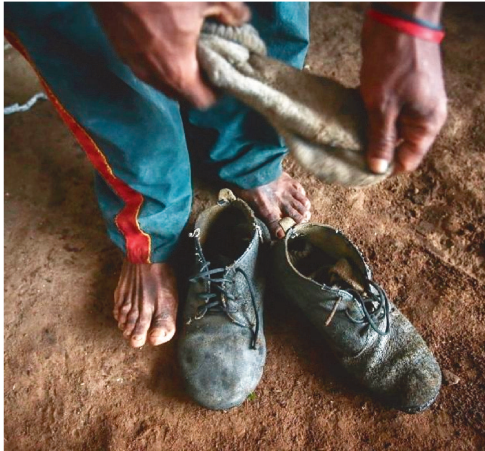
OS TRABALHADORES SAÍRAM DA CAPITAL MARANHENSE PARA O RIO GRANDE DO SUL

Além disso, acreditavam ter sido contratados como carpinteiros, todavia no Rio Grande do Sul descobriram que iriam trabalhar como montado-