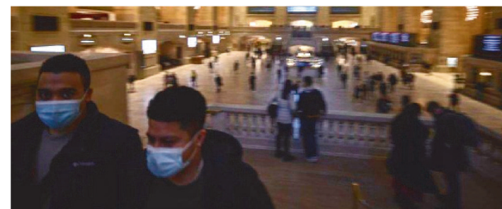
NA EUROPA, A SUÉCIA DERRUBOU QUASE TODAS AS MEDIDAS

A acentuada diminuição dos casos de covid-19 provocados pela variante ômicron em países europeus e nos Estados Unidos tem levado à revisão das restrições. Ontem, seguindo o exemplo de outros estados americanos governados por democratas, Nova York anunciou, oficialmente, o fim da obrigatoriedade do uso de máscaras em espaços fechados. Na Europa, a Suécia derrubou, ontem, quase todas as medidas, inclusive, a utilização do acessório em transportes públicos. O Reino Unido pode dar um passo ainda mais largo, com o fim do isolamento para quem testar positivo para o Sars-CoV-2. Em comum, a ideia de lançar as bases para aprender a viver com o coronavírus.