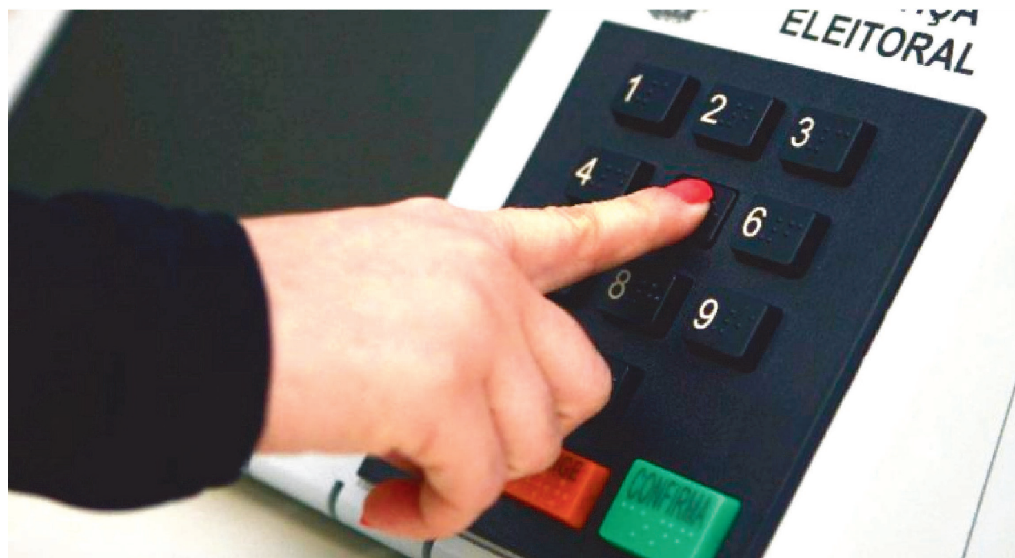
A NORUEGA FOI CONSIDERADA O PAÍS MAIS DEMOCRÁTICO DO MUNDO, AFGANISTÃO E MIANMAR ESTÃO NA ÚLTIMA COLOCAÇÃO

A Noruega foi considerada mais uma vez o país mais democrático do mundo em 2021. Na outra ponta, o Afeganistão e Mianmar desbancaram a última colocação da Coreia do Norte, que ocupava a lanterna em anos anteriores.