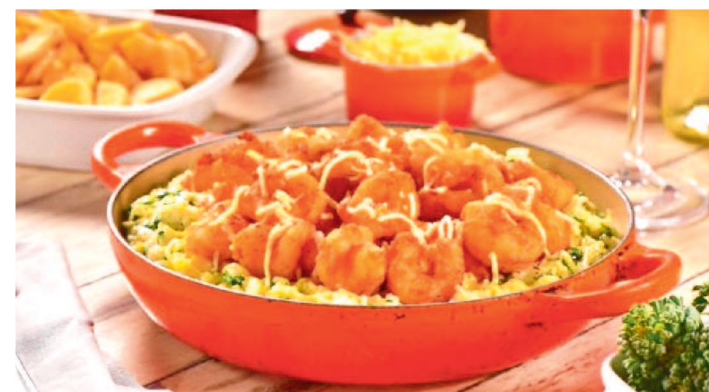
INSCRIÇÕES PARA O FESTIVAL VÃO ATÉ ESTE DOMINGO, 13

Com a proposta de atualizar o mapa da gastronomia maranhense, o Festival Maranhão de Sabores, evento realizado pelo Governo do Maranhão, por meio da secretaria de Estado de Indústria, Comércio e Energia (Seinc), prorrogou as inscrições para a primeira edição do evento.