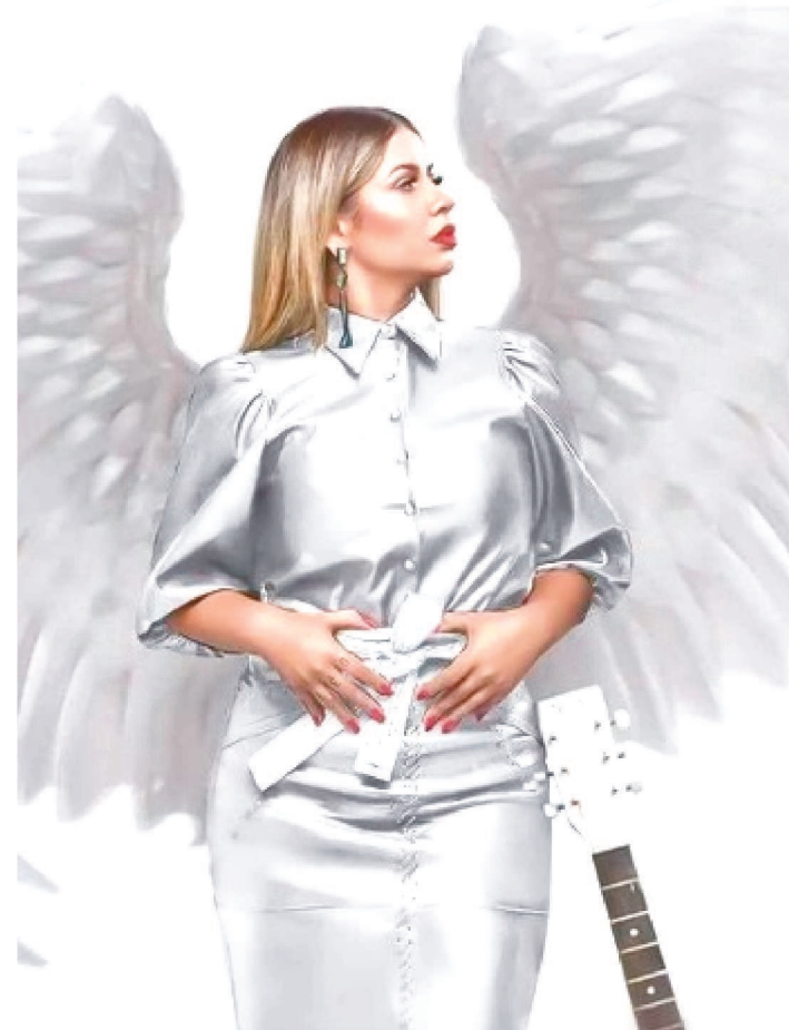
INFORMAÇÃO FOI CONFIRMADA PELO EMPRESÁRIO DE MARÍLIA