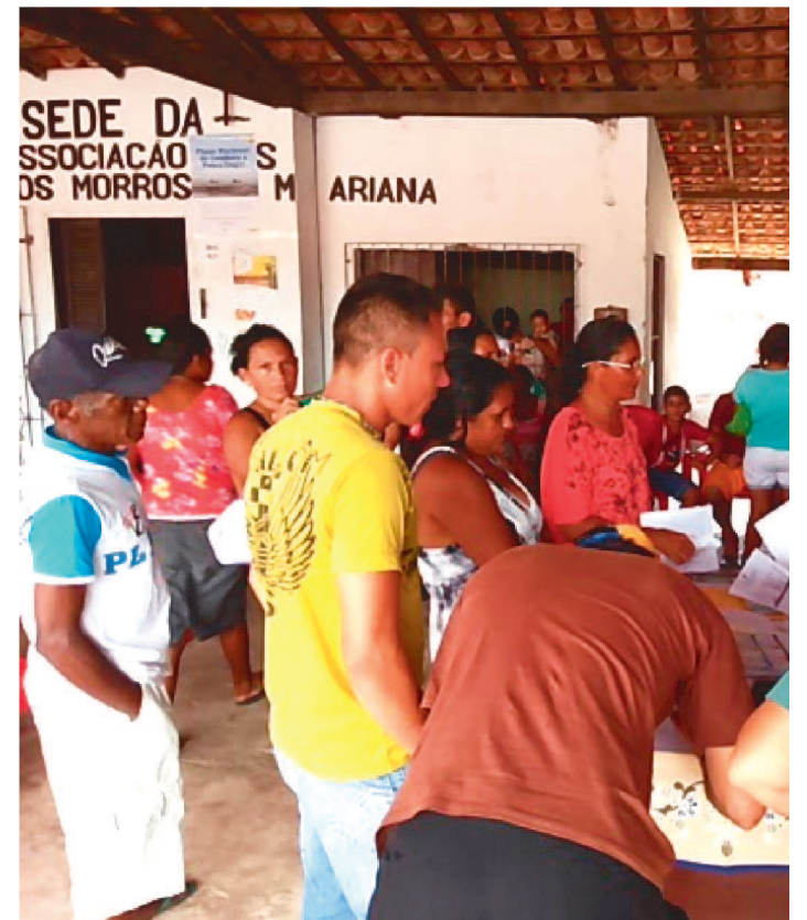
DOCUMENTOS FORAM APREENDIDOS DURANTE OPERAÇÃO

A Polícia Civil cumpriu mandado de busca e apreensão em uma Colônia de Pescadores da cidade de Rosário, expedido pela Vara da Comarca de Rosário.