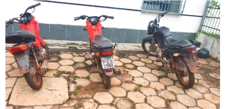
MOTOS FORAM APREENDIDAS DURANTE A OPERAÇÃO