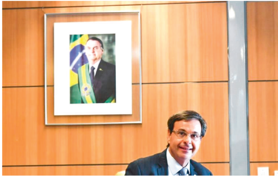
MINISTRO DO TURISMO, GILSON MACHADO ESTARÁ HOJE NO MARANHÃO

O Imparcial – Pela avaliação do Ministério do Turismo, qual o potencial real de desenvolver o turismo na região dos Lençóis Maranhenses,