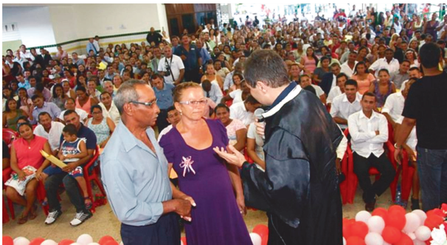
AS DESPESAS SERÃO RESSARCIDAS PELO PODER JUDICIÁRIO AOS CARTÓRIOS DO 2º OFÍCIO DE COROATÁ E OFÍCIO ÚNICO DE PERITORÓ

A 2ª Vara de Coroatá realizará duas edições do Projeto “Casamentos Comunitários”, no dia 9 de março, às 16h, para casais da sede e no dia 10 de março, no termo judiciário de Peritoró, às 16h. Para as duas cerimônias foram oferecidas 200 vagas para casais de baixa renda residentes nesses municípios, totalizando 400 uniões.