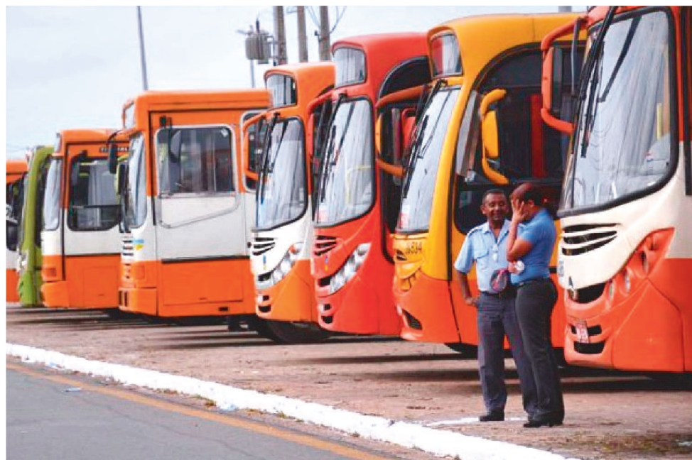
UMA NOVA GREVE DOS RODOVIÁRIOS PODE ACONTECER NOS PRÓXIMOS DIAS

Durante a audiência, o SET resolveu lançar uma contraproposta, que seria 5% de reajuste no salário e no valor do ticket alimentação, mas somente, se a entidade concordasse com a dispensa de todos os cobradores do sistema.