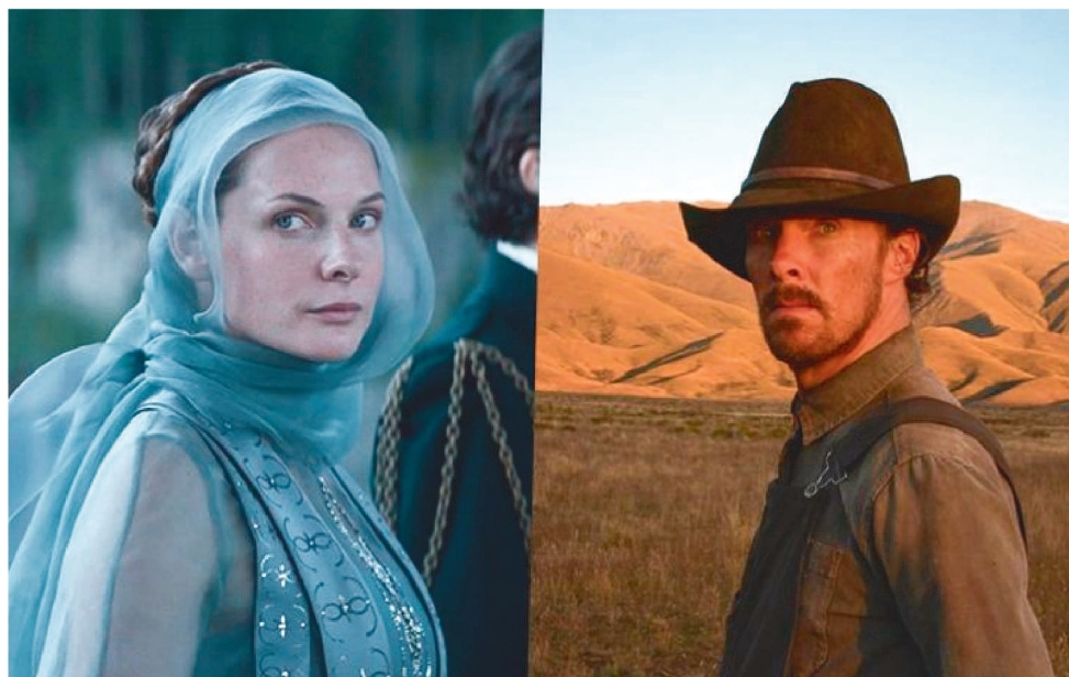
ATAQUE DOS CÃES LIDERA O OSCAR 2022 COM 12 INDICAÇÕES, SEGUIDO DE DUNA COM 10

O curta-metragem do diretor brasileiro Gustavo Milan, Seiva Bruta (Under the Heavens), sobre desafios en-