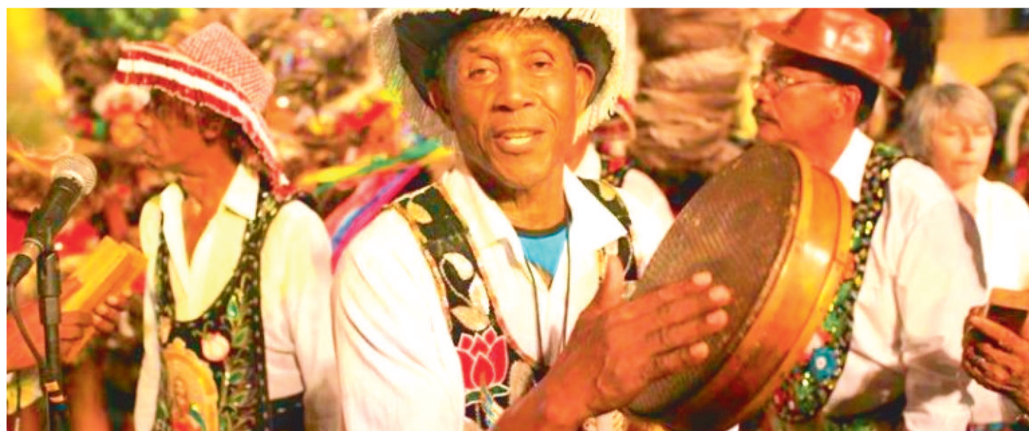
O PROJETO BECO CULTURAL ENCERRA ESTA EDIÇÃO HOJE, A PARTIR DAS 18 HORAS NA PRAÇA NAURO MACHADO, NA PRAIA GRANDE