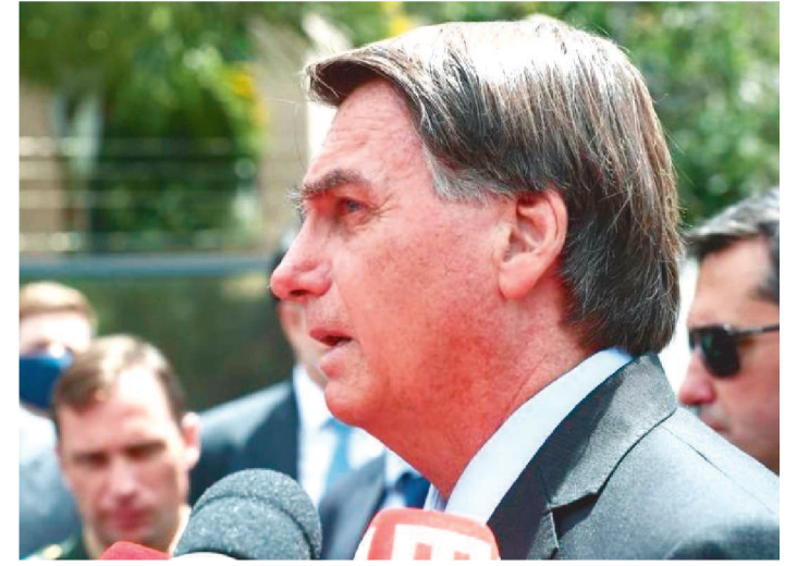
BOLSONARO ESTÁ EM ENCONTRO COM PRESIDENTE DO PERU

Em Porto Velho (RO), o presidente Jair Bolsonaro (PL) afirmou que a reforma ministerial será apresentada no dia 31 de março. O chefe do Executivo está na cidade para encontro com o presidente peruano Pedro Castillo.