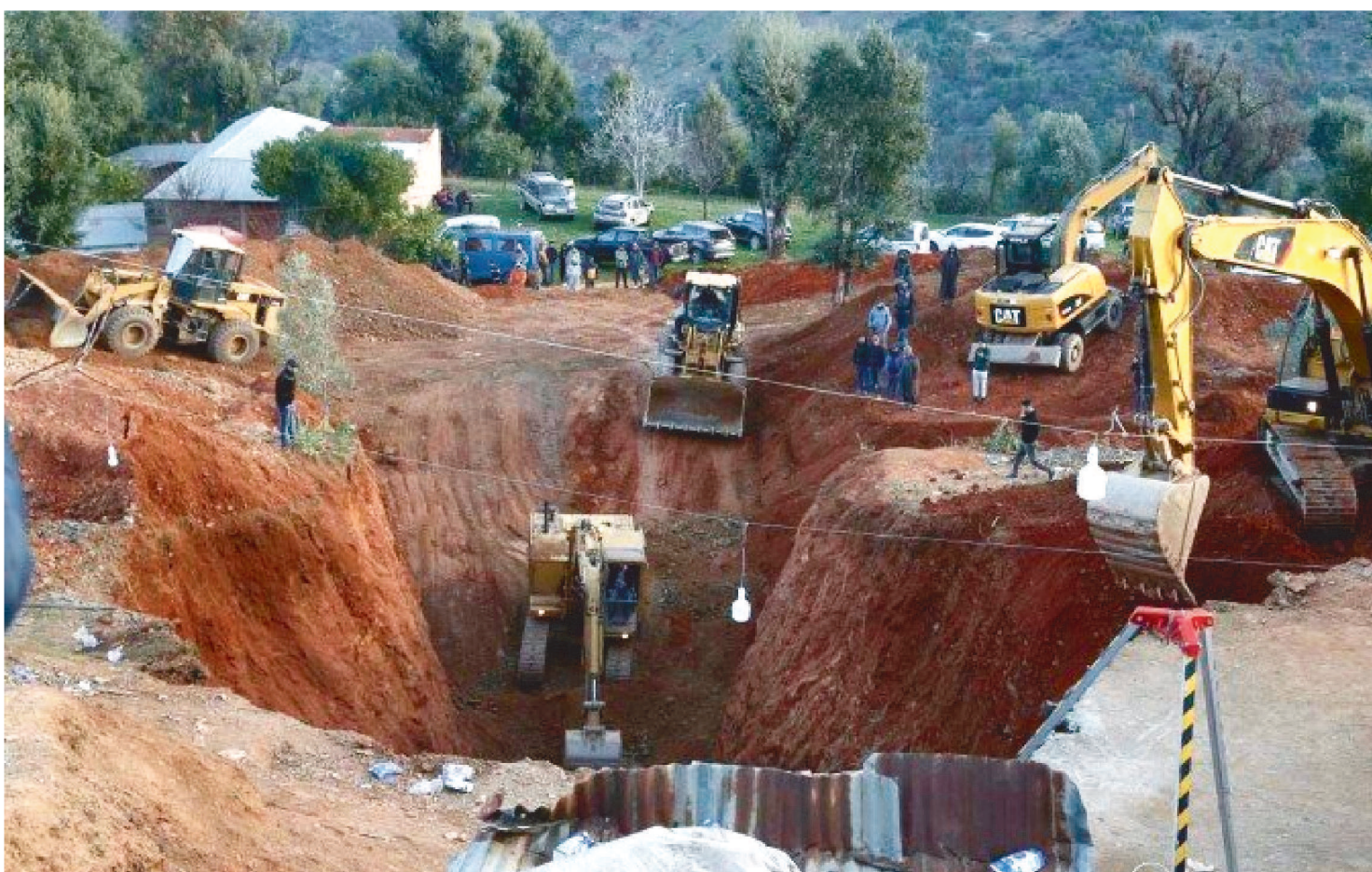
AS EQUIPES DE RESGATE NÃO PUDEAM ENTRAR DIRETAMENTE NO POÇO PORQUE “SEU DIÂMETRO É INFERIOR A 45 CENTÍMETROS”

O destino de um menino de cinco anos preso em um poço há mais de 36 horas provocava apreensão no Marrocos nesta quinta-feira (3), enquanto os socorristas tentam salvá-lo cavando um terreno adjacente, segundo relatos da imprensa local.