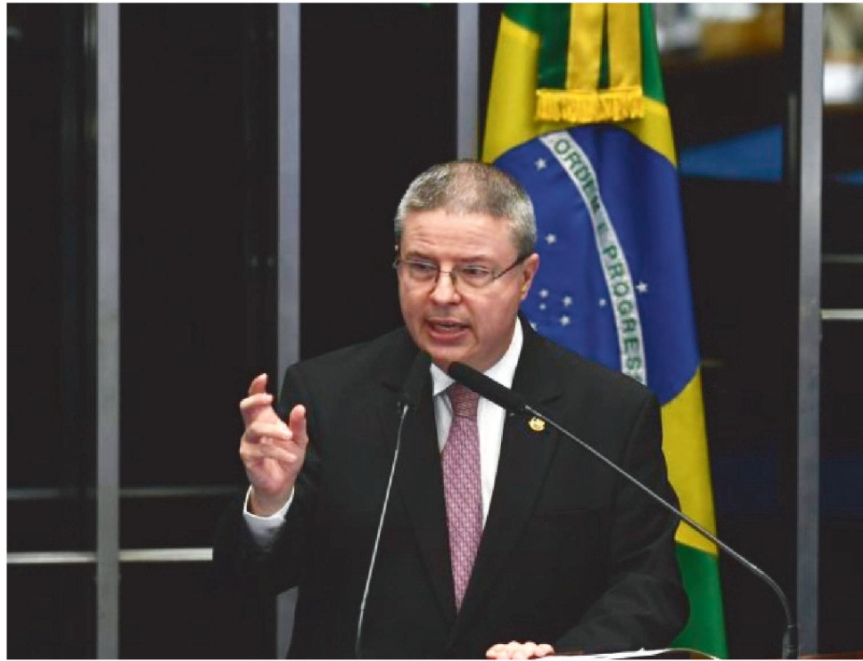
EX-SENADOR DESTACA LEI DE SEGURANÇA JURÍDICA ENTRE SEUS TRABALHOS

Antonio Anastasia é advogado. Ele nasceu em Belo Horizonte em 9 de maio de 1961 e poderá ficar no Tribunal de Contas até 2036, quando completará 75 anos e terá que se aposentar compulsoriamente.