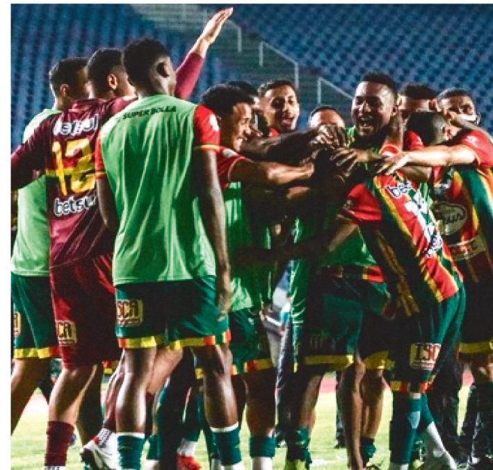
SAMPAIO VENCEU O PINHEIRO POR 4 X 0, NO CASTELÃO

Depois de golear (4 a 0) o Pinheiro na noite da última quarta-feira, no Castelão, pelo Campeonato Maranhense, o Sampaio Corrêa agora está focado na Copa do Nordeste.