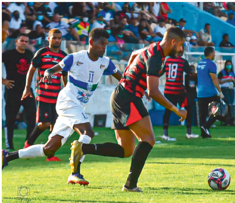
O MOTO CLUB QUER JOGAR NO ESTÁDIO NHOZINHO SANTOS, NA CAPITAL MARANHENSE

O Moto continua fazendo contatos com vistas à contratação de pelo menos três reforços para o Estadual e a Copa do Brasil. Inicialmente, deve