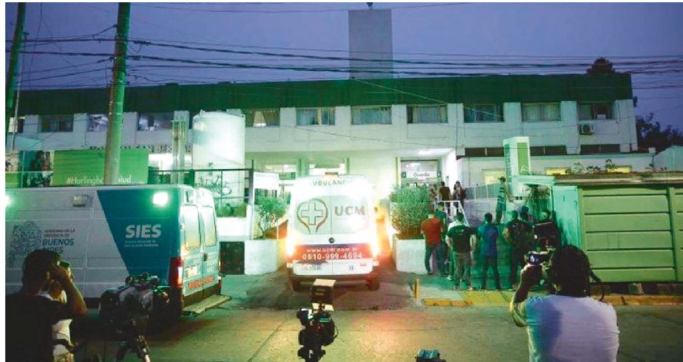
70 PESSOAS ESTÃO HOSPITALIZADAS NA PERIFERIA NOROESTE DE BUENOS AIRES

O Ministério Público pediu aos compradores de cocaína da populosa área que circunda a capital argentina, com quase 14 milhões de habitantes, que se desfaçam da droga adquirida recentemente. “Foi determinado que uma substância muito tóxica comercializada como cocaína está circulando”, disse a Promotoria do distrito de San Martín, uma das localidades que