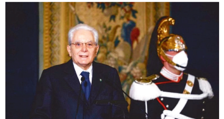
SERGIO MATTARELLA COMEÇA SEGUNDO MANDATO NA ITÁLIA

O presidente da República Italiana, Sergio Mattarella, eleito no sábado para um segundo mandato de sete anos apesar de sua relutância inicial, tomou posse, nesta quinta-feira (3), no Parlamento. “Chega de atrasos ou incertezas sobre as emergências do país”, pediu Mattarella, de 80 anos, convidando o Parlamento a “reconstruir” a Itália após a crise do coronavírus.