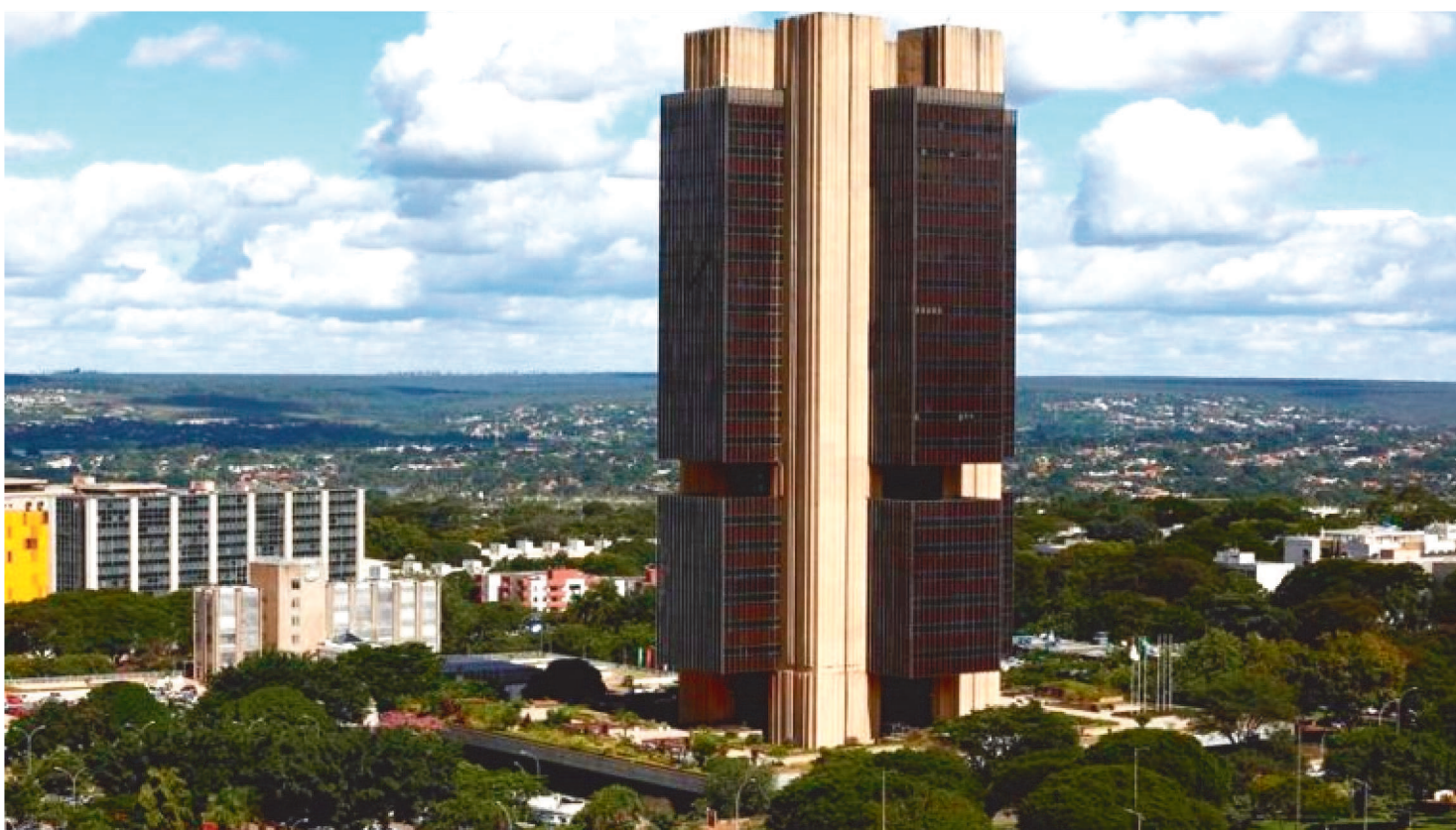
ECONOMISTA COMENTA QUE A MEDIDA ALIVIARIA A PRESSÃO DE CUSTOS SOBRE A INDÚSTRIA, QUE FOI BASTANTE AFETADA PELA CRISE

O governo estuda reduzir de 10% a 50% o Imposto sobre Produtos Industrializados (IPI). De acordo com o ministro da Economia, Paulo Guedes, a redução seria possível devido ao aumento na arrecadação federal registrado em 2021.