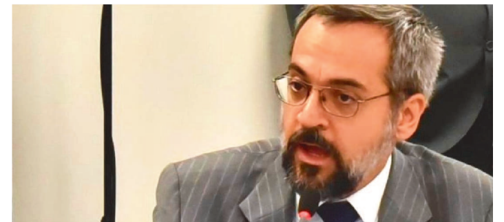
EX-MINISTRO DA EDUCAÇÃO ACUSOU MINISTRO DO STF

O ministro do Supremo Tribunal Federal (STF) Alexandre de Moraes determinou que a Polícia Federal tome o depoimento do ex-ministro da Educação Abraham Weintraub nesta sexta-feira (4/2). Há uma investigação preliminar aberta contra o bolsonarista desde o mês passado, por conta de declarações polêmicas em um podcast veiculado no YouTube.