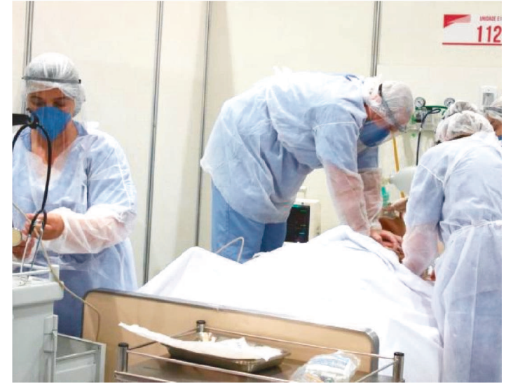
13 CAPITAIS BRASILEIRAS ESTÃO NA ZONA DE ALERTA CRÍTICA

A ocupação de leitos de terapia intensiva do Sistema Único de Saúde (SUS) para adultos com covid-19 superou 80% em nove unidades da federação e 13 capitais, alertou hoje (3) uma nota técnica do Observatório Covid-19, da Fundação Oswaldo Cruz (Fiocruz).