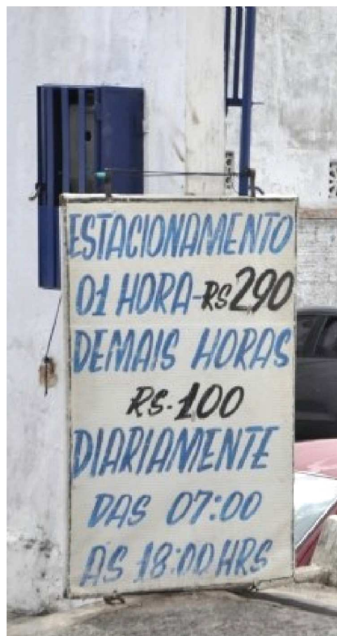
A sentença obriga a implantação de

Por fim, o Município de São Luís deverá promover a implantação das medidas de controle de estacionamento e circulação de veículos no Centro Histórico, conforme a previsão contida no Plano Diretor de Acessibilidade e Mobilidade da Área Central de São Luís.