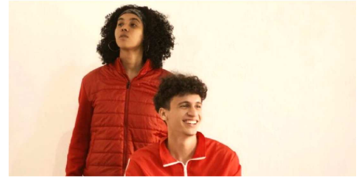
O GUIZO TRAZ UMA NOVA TÉCNICA PARA O MARANHÃO