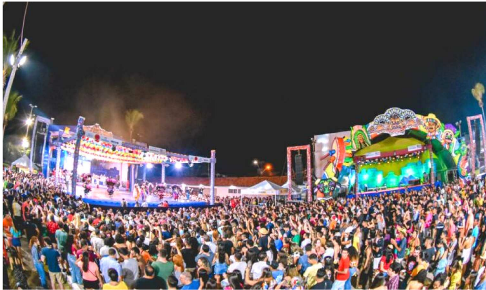
O ARRAIAL DO IPEM, ABERTO DE DOMINGO A DOMINGO, TEVE MAIS DE 15 MIL VISITANTES

motorizado e montado, além de blitz educativa, operações da Lei Seca, delegacia móvel, operações da Polícia Militar, Civil e do Corpo de Bombeiros nos arraiais.