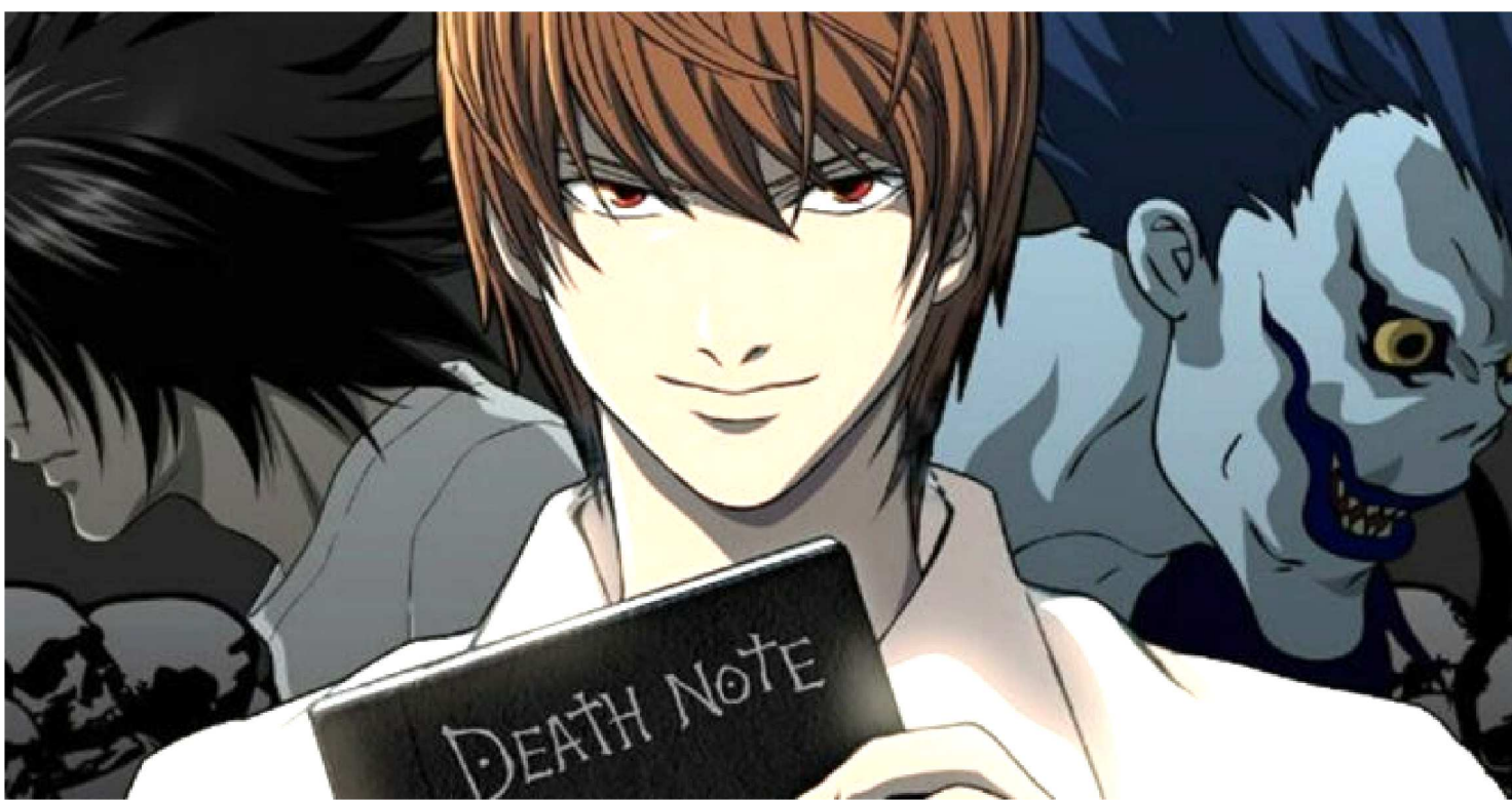
PARA CUIDAR DE TODOS OS TRABALHOS, MATT E ROSS, CRIADORES DE STRANGER THINGS ABRIRAM A UPSIDE DOWN PICTURES

Matt e Ross Duffer, os Duffer Brothers, criadores de Stranger Things, estão desenvolvendo vários projetos com apoio da Netflix. Além de uma nova série live-action do mangá Death Note, a dupla trabalha em uma série de O Talismã, livro de Stephen King e Peter Straub.