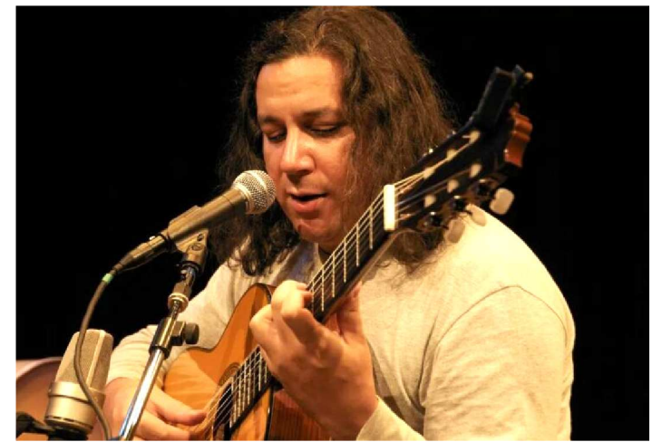
A ESTREIA DE "SONORIDADES" ACONTECE NO SÁBADO, 9