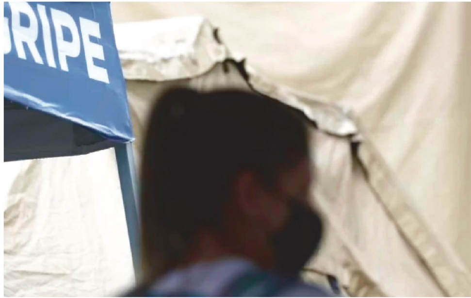
OS SINAIS DE CRESCIMENTO APARECEM EM MAIS ESTADOS DO NORTE E NORDESTE