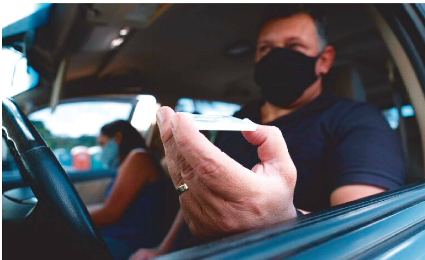
O SERVIÇO TEM CAPACIDADE PARA REALIZAR ATÉ DOIS MIL TESTES POR DIA E CONTA COM TRÊS TENDAS E CERCA DE 40 PROFISSIONAIS

O Drive-thru de Testagem do Parque do Rangedor será prorrogado por mais uma semana.