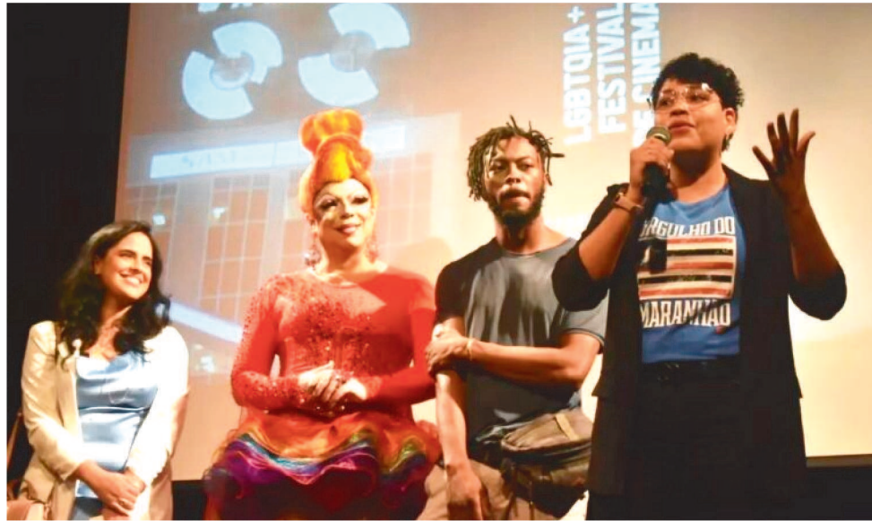
"DE REPENTE DRAG" CHEGARÁ AOS CINEMAS NO DIA 4 DE AGOSTO

A narrativa tem como trama a história de Julião, um repórter de TV que decide mudar os rumos de sua carreira e descobre um universo completamente novo para ele. Em determinado dia, ele conhece a drag queen Lohanny, envolvida em um caso de tráfico de pessoas. Para descobrir porque as drags estão sumindo, ele resolve se camuflar como drag para se infiltrar em um concurso e entender o que acontece ali dentro. Julião quer deixar de ser chacota no ambiente de traba-