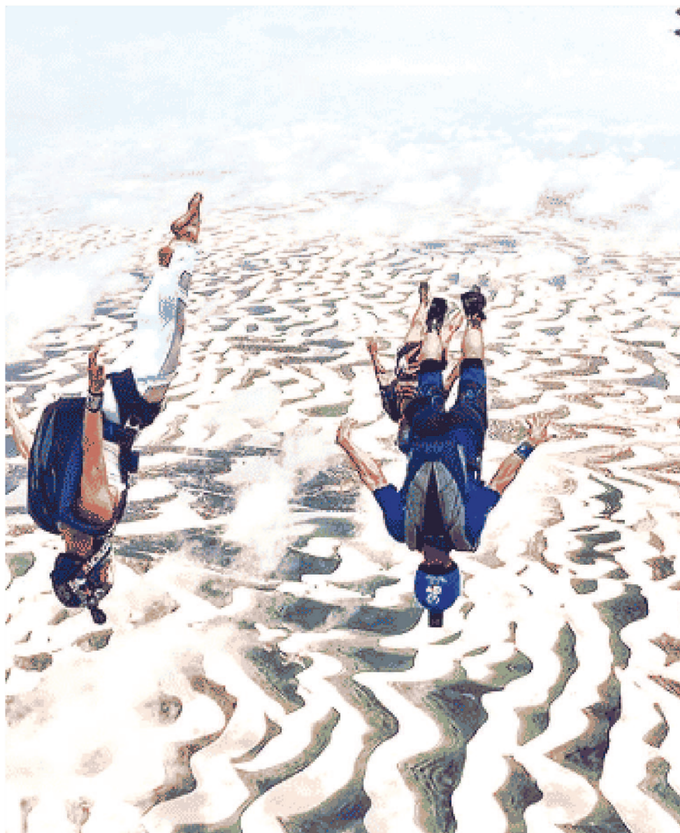
O SALTO É REALIZADO A APROXIMADAMENTE 4.000 METROS DE ALTITUDE

O salto é realizado a aproximadamente 4.000 metros de altitude, a uma velocidade de mais de 200 km/h. Após a abertura do paraquedas, o passeio continua sobre os Lençóis Maranhenses até o pouso suave nas dunas, ao la-