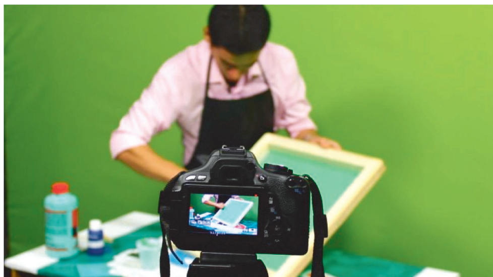
CURSOS SÃO OFERTADOS NO ÂMBITO DO PROGRAMA MARANHÃO PROFISSIONALIZADO

As inscrições seguem até 13 de julho, e a confirmação da matrícula ocorrerá nos dias 14 e 15 de julho, nos Polos de Atendimento Vocacionais previstos no Edital. Realizadas gratuitamente, as inscrições ocorrem de forma presencial nos