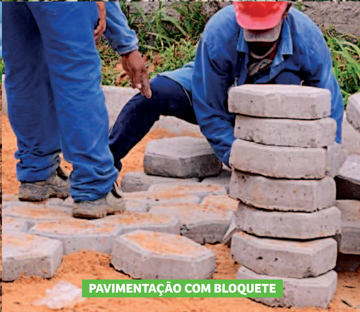
PAVIMENTAÇÃO COM BLOQUETE