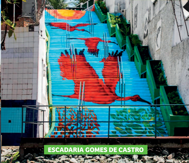
ESCADARIA GOMES DE CASTRO