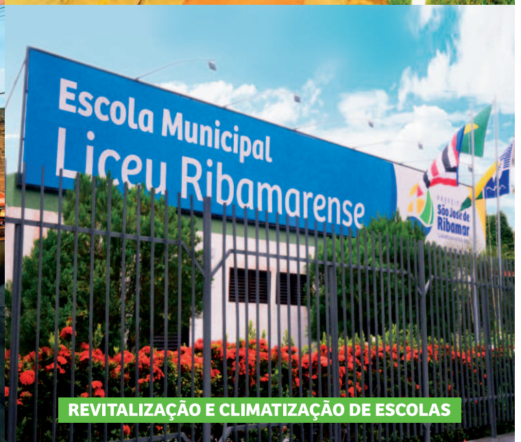
REVITALIZAÇÃO E CLIMATIZAÇÃO DE ESCOLAS