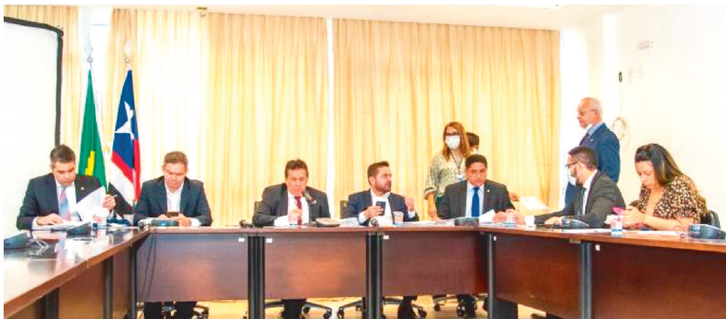
MEDIDAS PROVISÓRIAS REFERENTES À MATÉRIA FORAM ENVIADAS PELO GOVERNADOR CARLOS BRANDÃO NO MÊS DE MAIO

A Comissão de Constituição, Justiça e Cidadania (CCJ) aprovou, no último dia 28 de junho, parecer favorável às Medidas Provisórias 387/2022 e 388/2022. As MPs foram enviadas pelo governador Carlos Brandão, no mês de maio passado. As matérias tratam, respectivamente, da criação da Agência Executiva Metropolitana do Leste Maranhense (AGEMLESTE) e da Secretaria da Pesca e Aquicultura (SEPA).