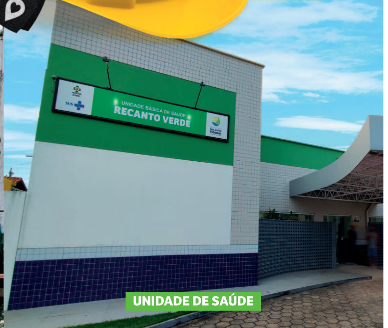
UNIDADE DE SAÚDE