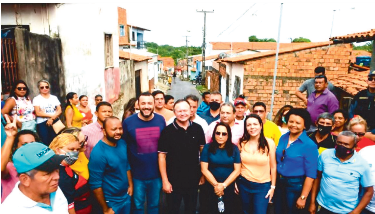
OS SERVIÇOS NAS VIAS DO BAIRRO INCLUEM MELHORIA DA PAVIMENTAÇÃO, CONSTRUÇÃO DE SARJETA, MEIO-FIO E DRENAGEM

Diversas vias do bairro Vila Isabel Cafeteira, em São Luís, estão recebendo melhorias em pavimentação e outros serviços que vão garantir mais mobilidade urbana.