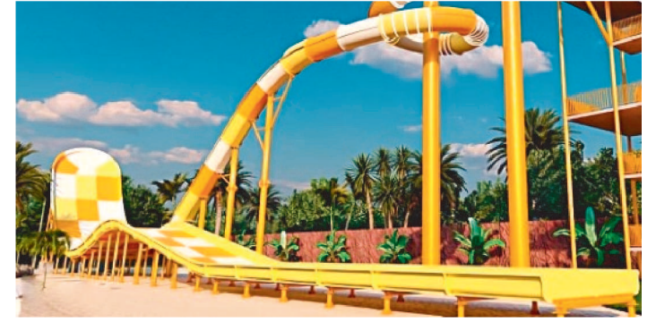
A MAIS NOVA ATRAÇÃO AQUÁTICA DO PARQUE TEM 19 METROS

Pensando em curtir incríveis momentos de diversão e aventura com a sua galera? O Valparaíso Adventure Park é o lugar perfeito para isso! Localizado no Município de Paço do Lumiar, no Maranhão, o parque é um incrível complexo turístico voltado para turismo de aventura da melhor qualidade e conta com ingressos que podem ser comprados através do site oficial.