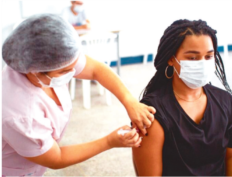
SERÃO DISPONIBILIZADOS 16 PONTOS DE VACINAÇÃO, DISTRIBUÍDOS NA GRANDE ILHA

No município de São José de Ribamar, das 8h às 13h, a vacinação contra a Covid-19 será disponibilizada no