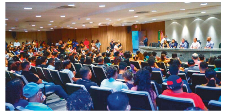
PROGRAMA INCLUI JOVENS MARANHENSES NO MERCADO

Cerca de 300 alunos da rede pública estadual de ensino participaram do ato de posse simbólica dos estagiários da nova etapa do programa Trabalho Jovem/Prepara Maranhão. A ação do Governo do Estado potencializa oportunidades de trabalho aos jovens do Maranhão.