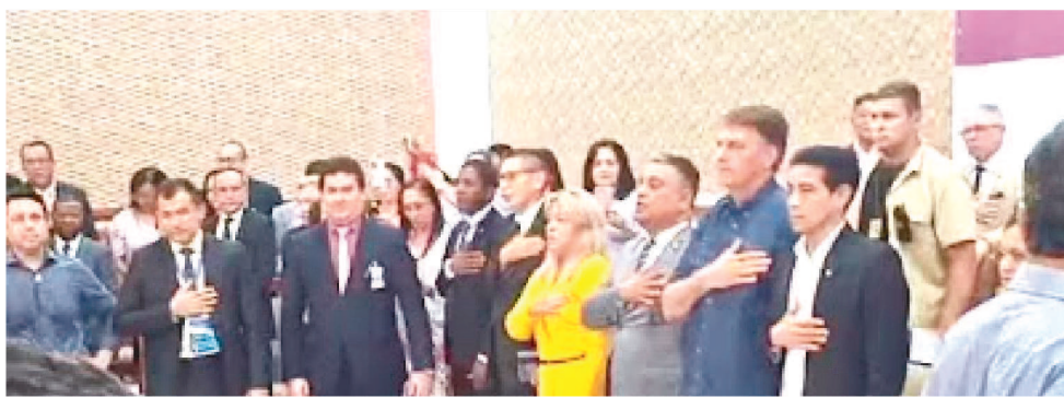
O PRESIDENTE DISSE QUE CONVERSARÁ SOBRE A QUESTÃO DO FERRY BOAT

Ministros das Igrejas Evangélicas Assembleias de Deus, Bolsonaro seguiu no Maranhão nesta quinta-feira (14), dessa vez, em Vitória do Mearim.