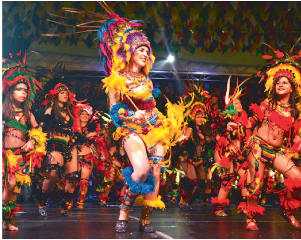
O ARRAIAL DO SHOPPING DA ILHA FUNCIONA NO ESPAÇO RESERVA, DE 14 A 29 DE JULHO

“Estamos continuando o São João do Maranhão, o maior São João Brasil, para oferecer ao público entretenimento, grandes atrações juninas do nosso estado e 60 dias de festa, con-