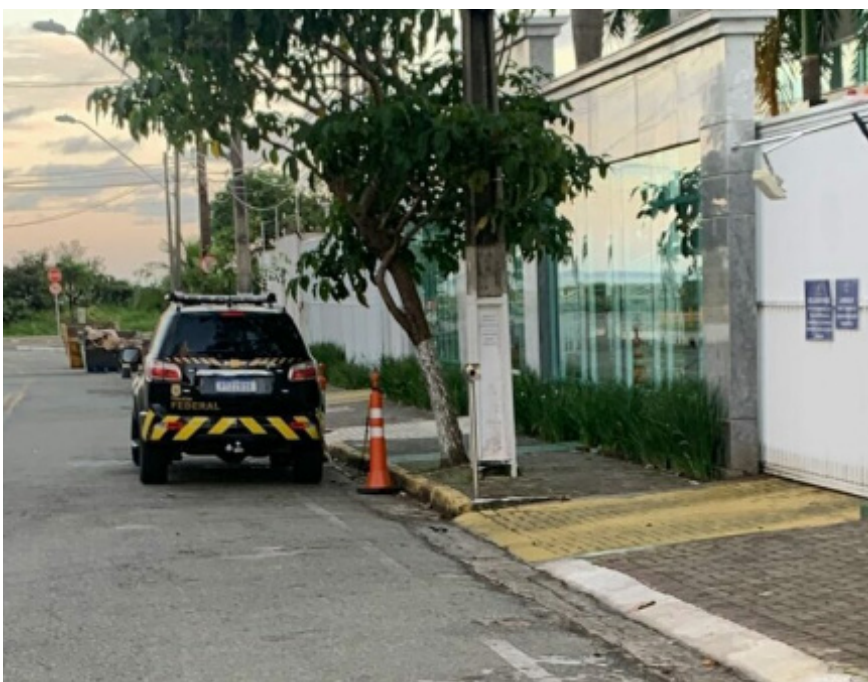
PF atuo em São Luís, Dom Pedro, Codó, Santo Antônio dos Lopes e Barreirinhas