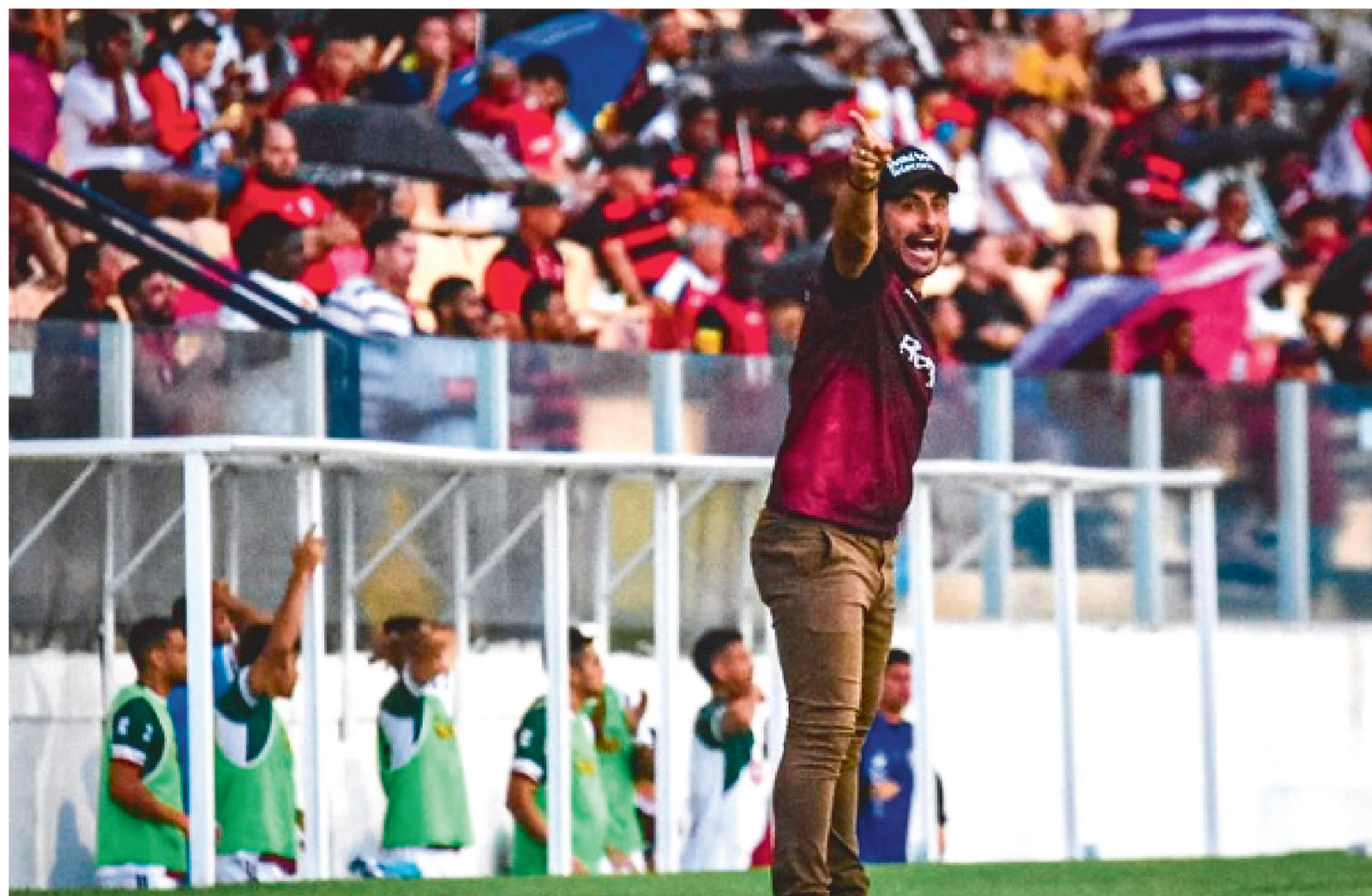
PAPÃO DO NORTE ESTÁ DE OLHO NO PRIMEIRO CONFRONTO DO MATA-MATA DA SÉRIE D DO CAMPEONATO BRASILEIRO 2022

GAUDÊNCIO CARVALHO Especial para O Imparcial