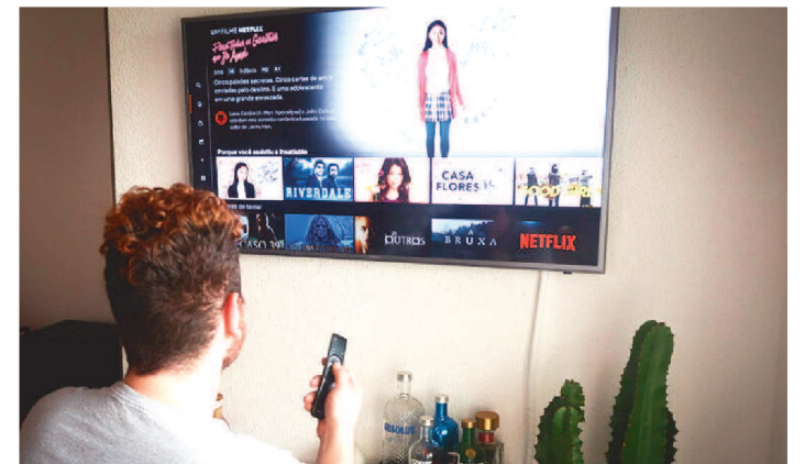
A COBRANÇA EXTRA COMEÇOU EM PAÍSES DA AMÉRICA LATINA

Sabe aquela prática que todo mundo nega, mas que muita gente faz, de "emprestar" as senhas da Netflix de suas contas pessoais para os amigos? Pois bem, segundo a própria plataforma de streaming, isso afeta bastante seu faturamento, já que cerca de 100 milhões de lares fazem isso.