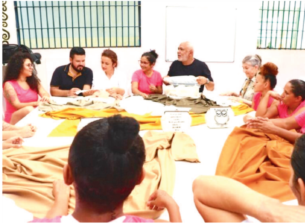
INTERNAS DO COMPLEXO PRISIONAL PARTICIPARÃO DA PRODUÇÃO DO FIGURINO