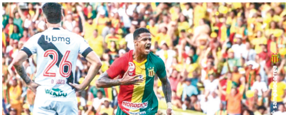
EM CASA, O SAMPAIO CORRÊA É "TRITURADOR" DE ADVERSÁRIO, MAS FORA SÓ APANHA

sai dos seus domínios, parece ter esquecido o futebol no Centro de Treinamento José Carlos Macieira. Longe de casa, o Sampaio ainda não conseguiu vencer e conquistou apenas 2 pontos de 30 disputados.