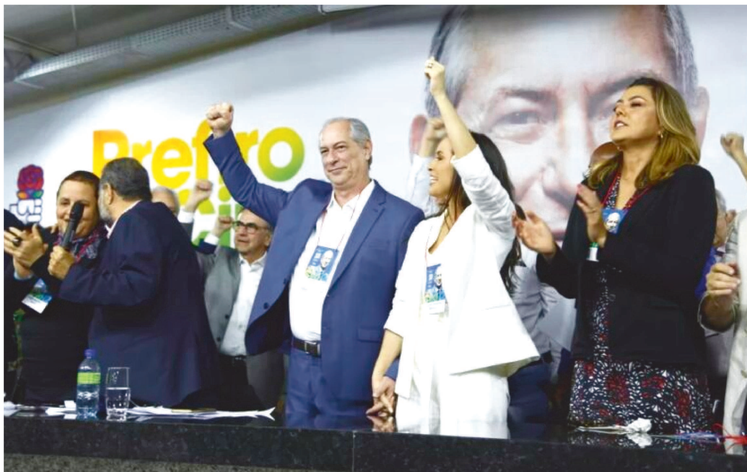
A CONVENÇÃO NACIONAL DO PDT ACONTECEU NESTA QUARTA-FEIRA (20/7), EM BRASÍLIA. ATÉ O MOMENTO, SEM NOME PARA VICE

O PDT confirmou, nesta quarta-feira (20/7), em convenção nacional, o nome do ex-governador do Ceará, Ciro Gomes, como o candidato do partido à Presidência da República.