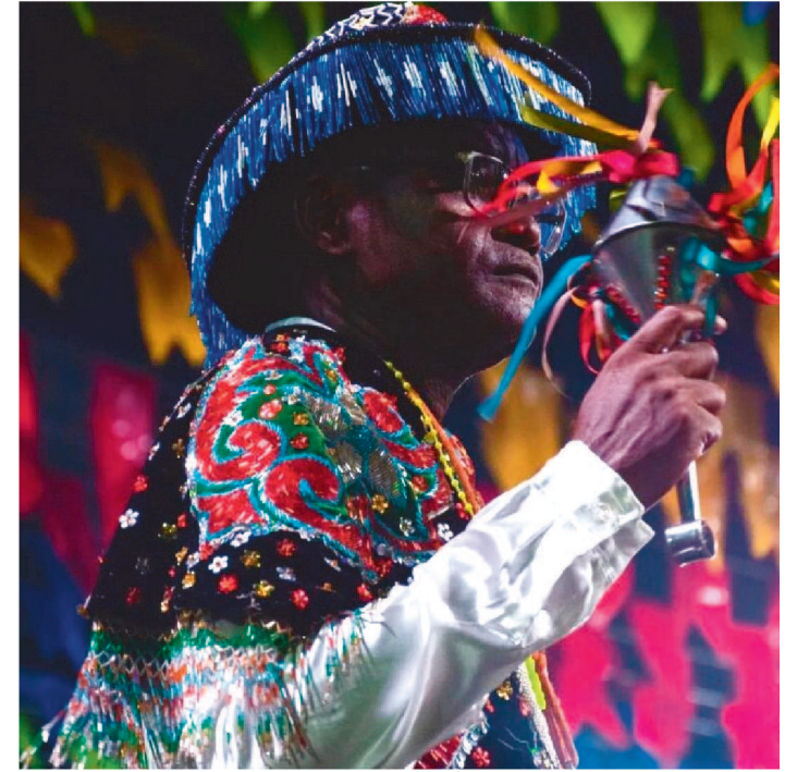
ESPETÁCULO ACONTECERÁ NESTA QUINTA, 21, ÀS 19H, NO CCVM

O Bumba Meu Boi da Fé em Deus apresenta nesta quinta-feira, 21, o Auto do Boi – Rumo ao Centenário da Fé em Deus.