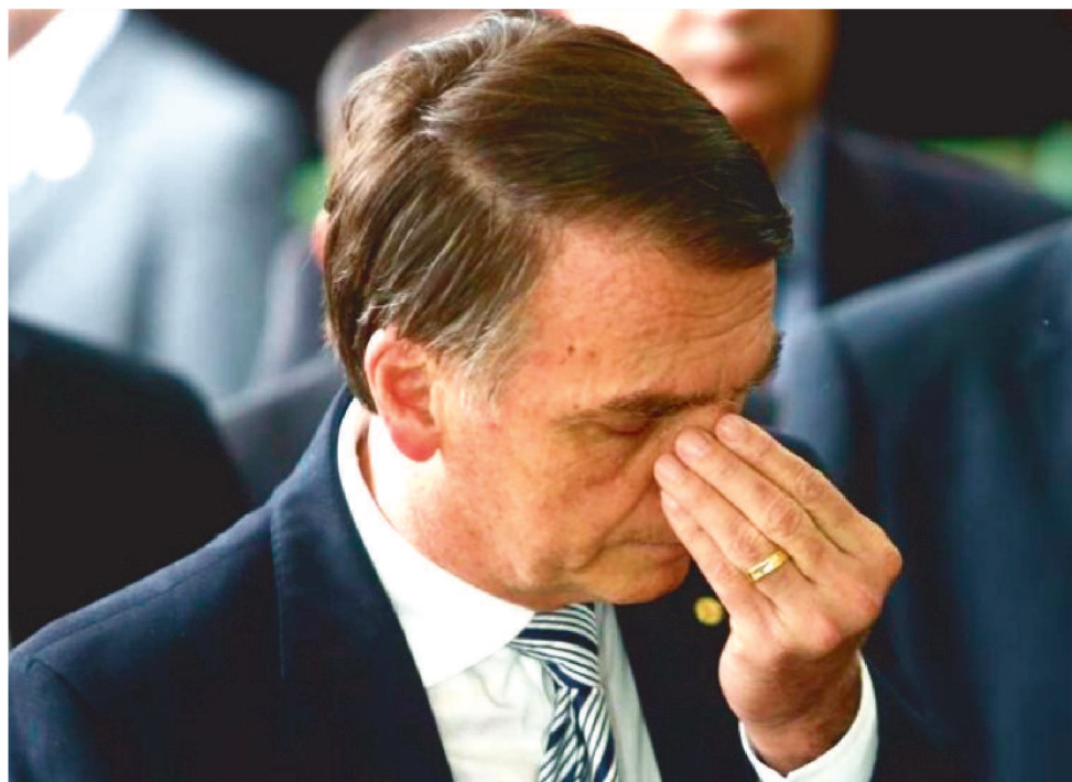
A CONVENÇÃO OCORRERÁ NO PRÓXIMO DOMINGO (24), NO MARACANZINHO

No WhatsApp e pelas redes sociais, grupos difundiram mensagens estimulando as inscrições em massa. Uma das mensagens, intitulada “Um protesto pacífico”, diz que se inspirou em um episódio semelhante que, em 2020, esvaziou um comício do então presidente Donald Trump em Tulsa, Oklahoma.