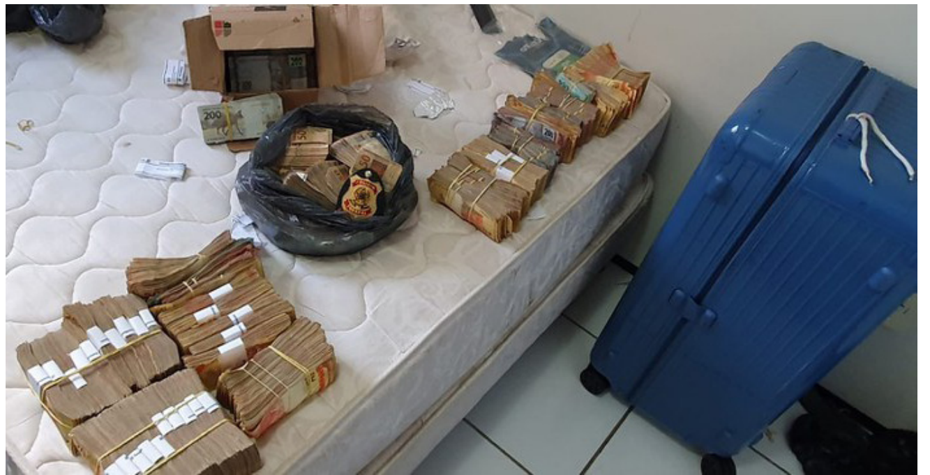
Durante o cumprimento de mandados de busca e apreensão, a PF apreendeu aproximadamente R$ 1,3 milhão em dinheiro