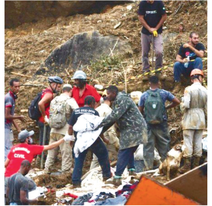
EQUIPES DA POLÍCIA CIVIL ESTÃO FAZENDO BUSCAS NO LOCAL

Até agora, 117 mortes foram confirmadas no município. A Polícia Civil está com equipes na cidade colhendo registros de pessoas desaparecidas.