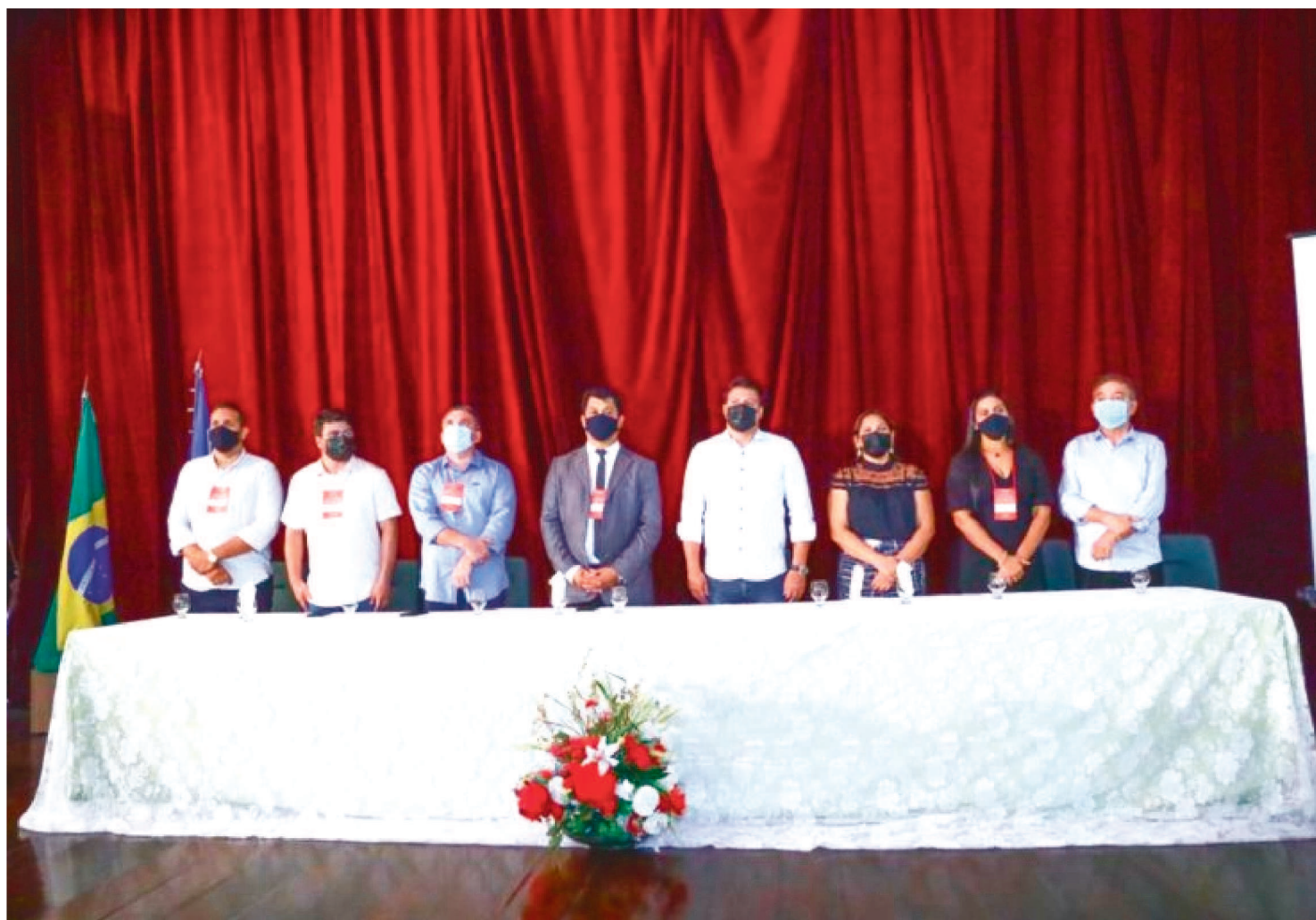
O GRUPO DE TRABALHO, QUE JÁ CONTA COM 167 VICE-PREFEITOS ASSOCIADOS, PROPÕE O FORTALECIMENTO DO MUNICIPALISMO

Nesta sexta-feira (18), no IFMA do Monte Castelo, em São Luís, a União dos Vice-prefeitos e Vice-prefeitas do Maranhão (UNIVIMAR), oficializou a fundação da entidade. O grupo de trabalho, que já conta com 167 vice-prefeitos associados, propõe o fortalecimento do municipalismo e a inclusão dos vice-prefeitos e vice-prefeitas nas discussões que influenciam no destino dos municípios.