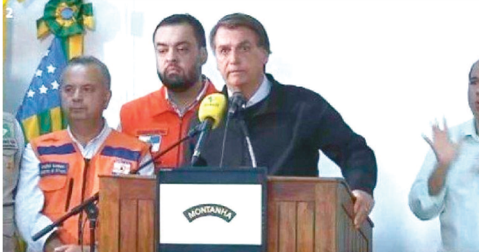
AS ENCHENTES JÁ DEIXARAM MAIS DE 110 MORTES E CENTENAS DE DESAPARECIDOS

Bolsonaro afirmou que, assim que soube da tragédia, quando ainda estava na Europa, entrou em contato com ministros para que a União desse “suporte necessário à população”. “Liguei para o ministro Rogério Marinho, do Desenvolvimento Regional, que já havia determinado um recurso extra