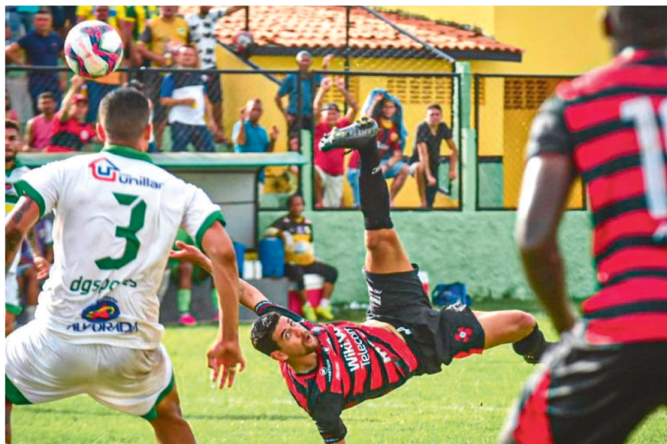
MOTO ESTÁ PRONTO PARA O DUELO DESTA TARDE CONTRA O PINHEIRO