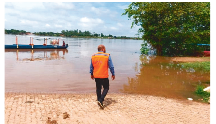
SUPERINTENDE DESTACA PREOCUPAÇÃO COM RIBEIRINHOS

Por conta das fortes chuvas ocorridas nos últimos dias em Imperatriz, o nível do Rio Tocantins voltou a subir, atualmente com sete metros acima de zero, com vazão de 9.500 metros/3s. Informação foi repassada pela Superintendência Municipal de Proteção e Defesa Civil (Sumpdec), da Prefeitura de Imperatriz, que monitora e acompanha os principais pontos próximos ao Rio que podem voltar a alagar novamente.