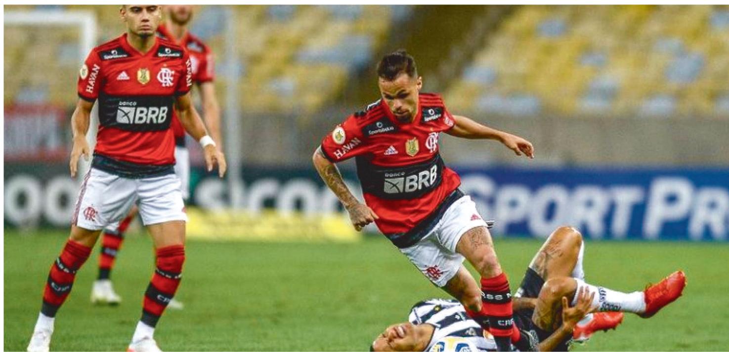
NO ÚLTIMO JOGO PELO BRASILEIRÃO 2021 O FLAMENGO FOI O VENCEDOR

Flamengo-RJ e Atlético-MG decidem neste domingo a Supercopa do Brasil em jogo marcado para a Arena Pantana, em Cuiabá, às 16h. Ao longo da história, o Flamengo leva vantagem no cara a cara direto. São 47 vitórias cariocas, contra 39 mineiras, além de 34 empates. O primeiro encontro entre o Urubu e o Galo se deu em 16 de junho de 1929, e o Mengão prevaleceu em Minas Gerais: 3 a 2.