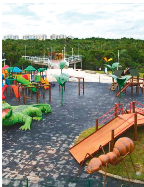
Com acesso pela Rua dos Búzios,

O Parque já conta com praças de esporte e playgrounds, pista para caminhada e ciclovia de 3,5km, borboletário, áreas para piquenique e outros atrativos.