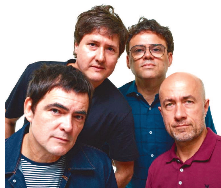
AINDA É POSSÍVEL COMPRAR MEIA PROFESSOR OU IDOSO

Os mineiros do Skank se apresentam em São Luís (MA), no pavilhão de eventos do Multicenter Sebrae, dia 29 de abril (sexta-feira), com a “Turnê de Despedida”, a partir das 20h30. Ainda é possível comprar ingressos de meia professor ou idoso.