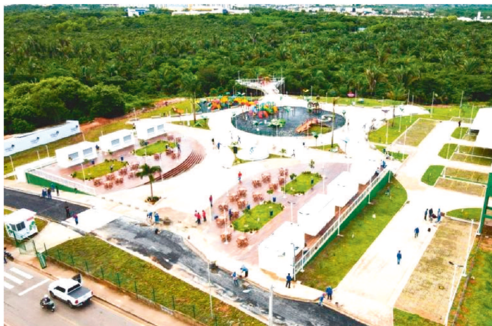
A NOVA EXTENSÃO DO PARQUE CONTA COM 12 QUIOSQUES DE LANCHONETES

A extensão do Parque conta com 12 quiosques que oferecem muitas opções gastronômicas. Hambúrgueres, açais e sorvetes, cachorro-quente, batata frita, beijos e cafés, pasteis podem ser degustados num final de tarde, em meio à exuberância do verde.