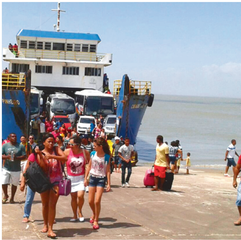
APENAS DOIS FERRY-BOATS TÊM TEM REALIZADO VIAGENS NA GRANDE ILHA

A MOB também prometeu entregar uma terceira embarcação para fazer a travessia entre São Luís e Baixada Maranhense neste sábado (21).