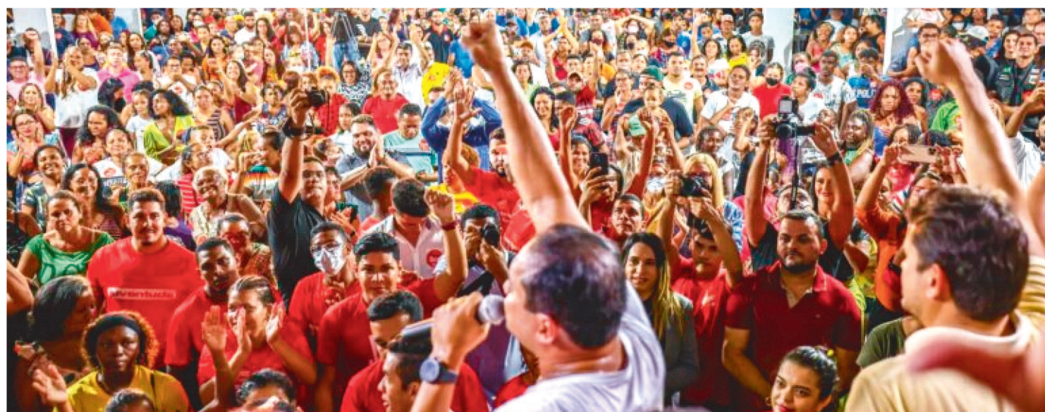
SENADOR WEVERTON (PDT), PRÉ-CANDIDATO AO GOVERNO DO MARANHÃO, REUNIU APOIADORES NO SÃO CRISTÓVÃO

O deputado Federal Juscelino Filho (União Brasil), destacou o sentimento que a caravana do Maranhão Mais Feliz tem levado por onde passa.