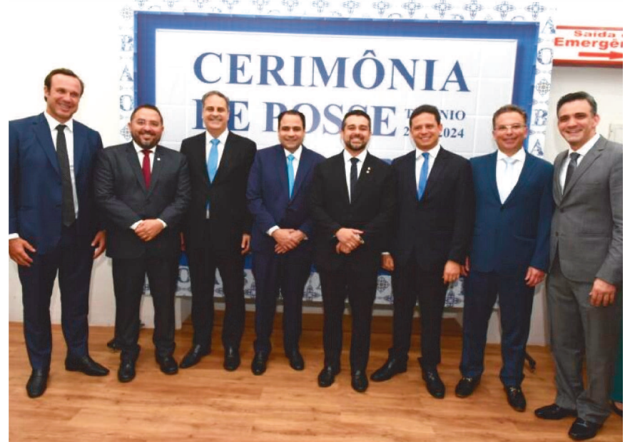
A nova gestão fortalece ainda mais a união entre a advocacia pública e privada com o trabalho de todo o Conselho Seccional e dos presidentes de Subseções.