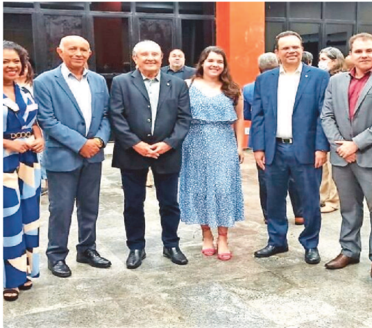
AUTORIDADES MUNICIPAIS, ESTADUAIS E ENTIDADES ESTIVERAM NO EVENTO NA FIEMA

Parte do sucesso da Rede Vila Galé deve-se à qualidade do seu produto, profissionalismo das suas equipes, crescimento econômico sustentável, social e ambientalmente responsável, com uma enorme paixão pela hotelaria e pelo turismo brasileiro.