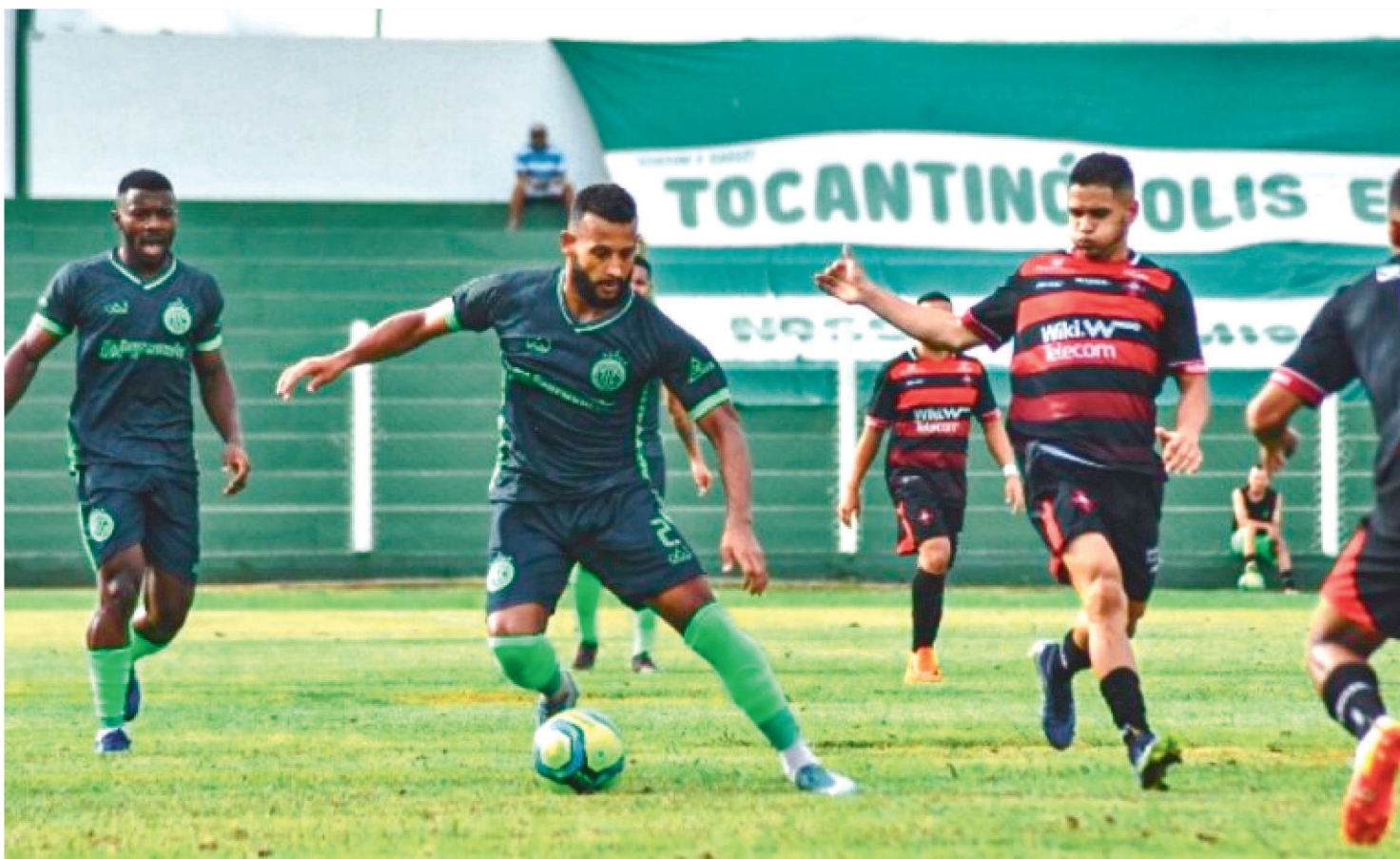
MOTO CLUB VEM DE DERROTA PARA O TOCANTINÓPOLIS-TO, POR 2 X 0, NA RODADA PASSADA DA SÉRIE D DO CAMPEONATO BRASILEIRO

Com o objetivo de se reabilitar na Série D do Campeonato Brasileiro, o Moto Club recebe o Fluminense-PI, às 17h, no Estádio Nhozinho Santos, em São Luís.