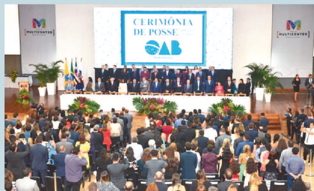
A posse da OAB/MA foi bastante prestigiada por autoridades e a sociedade maranhense