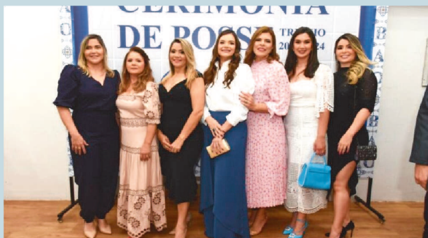
As mulheres ocupando lugares de decisão em vários setores da OAB/MA portodo o Estado: no Conselho Seccional e Federal, Subseções, ESA e na advocacia