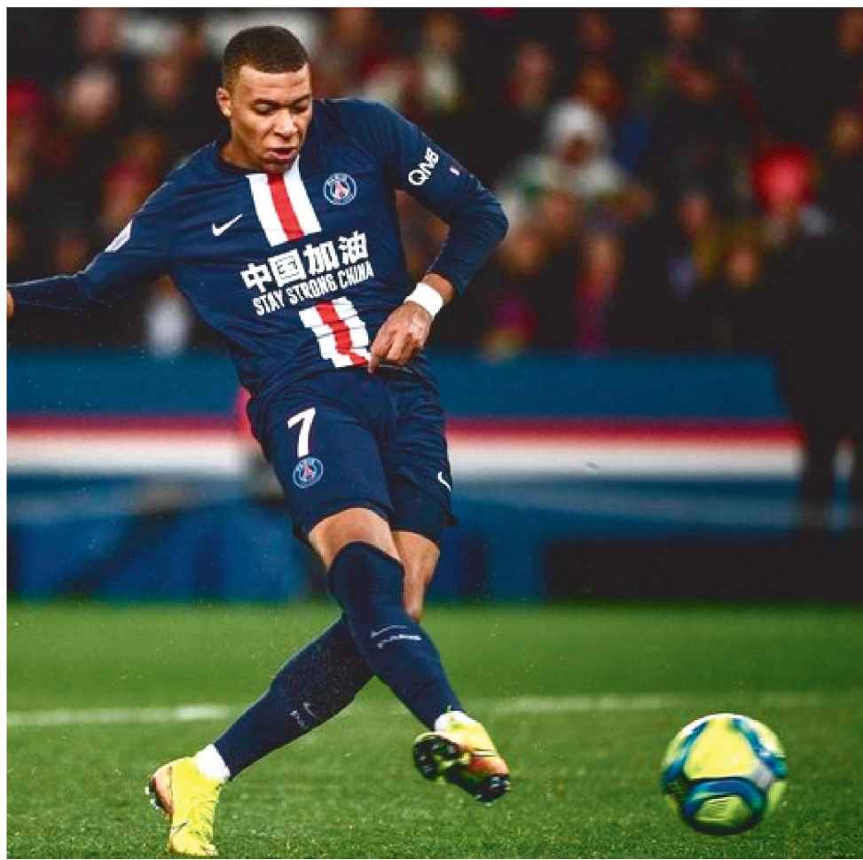
COM 25 GOLS E 17 ASSISTÊNCIAS, ATACANTE MBAPPÉ VEM DE EXCELENTE TEMPORADA

Na última vez que falou com os jornalistas, em uma premiação do Campeonato Francês, Mbappé indicou