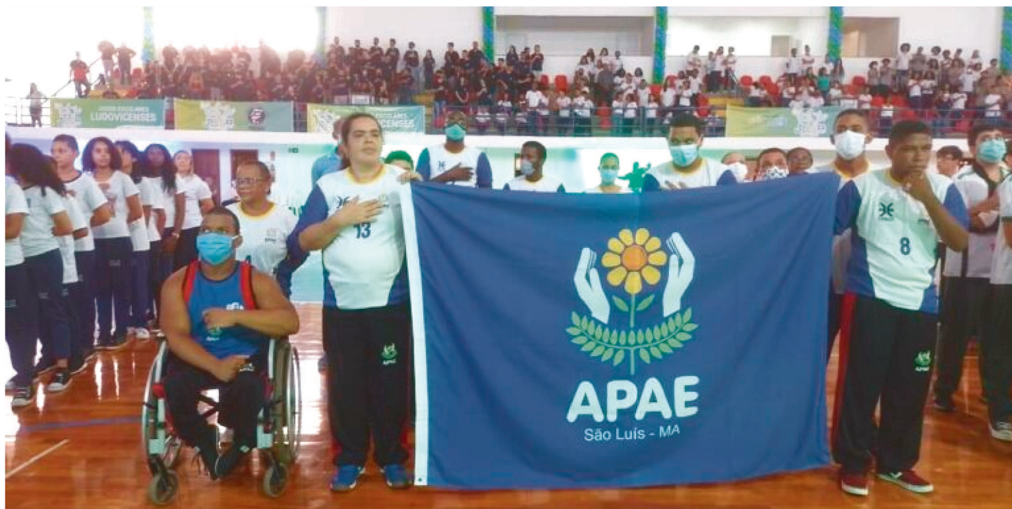
OS ATLETAS EXIBEM COM ORGULHO A BANDEIRA DA APAE DE SÃO LUÍS NA ABERTURA DO JEL'S NO GINÁSIO COSTA RODRIGUES

Em sua primeira edição, o JELs / Jogos Escolares de São Luís que reúne escolas da rede pública municipal, federal e 36 instituições da rede privada; também conta com a delegação da APAE de São Luís, composta por atletas com deficiência.