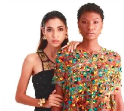
ESPAÇOS E PROGRAMAÇÃO

A 3ª edição Maranhão Fashion Week também integra a programação da Expo e pretende evidenciar o setor da moda maranhense. Na oportunidade, serão apresentadas as novas tendências do setor do vestuário com uma estrutura de arena de desfile e uma área de estandes montada para que marcas, multimarcas, microempreendedores e estilistas do Maranhão possam expor coleções e prospectar clientes.