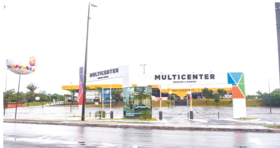
A FEIRA REFORÇA A INDÚSTRIA DO ESTADO, QUE CONTRIBUI COM 18,5% DA ECONOMIA

Para receber o público, uma vasta programação foi preparada – haverá rodadas de negócios (nacional e internacional), palestras, oficinas, bate-papos, e outras