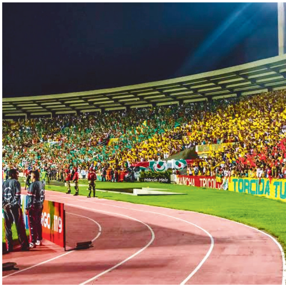
O OBJETIVO DA DIRETORIA DO SAMPAIO É ATRAIR MAIS PÚBLICO PARA OS JOGOS