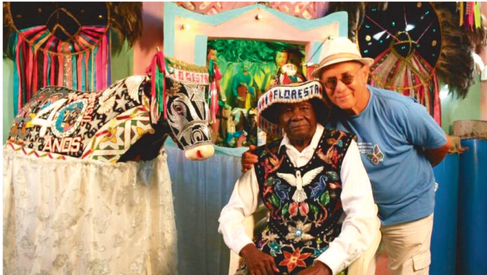
HÁ SEIS ANOS O MARANHÃO PERDIA UM DOS MAIORES PERCUSSIONISTAS DO MUNDO