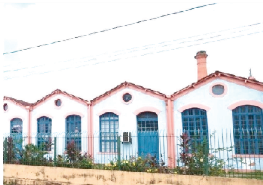
CARLOS LEVY CONTA CASOS, AVENTURAS E MEMÓRIAS VIVIDAS HÁ MAIS DE 50 ANOS, ENQUANTO MORAVA COM OS PAIS NO ANIL