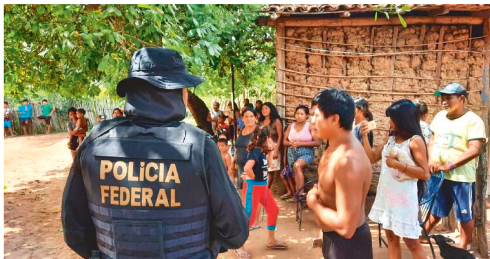
A FISCALIZAÇÃO DA POLÍCIA FEDERAL FOI REALIZADA JUNTAMENTE COM O IBAMA

Foram realizadas incursões no interior do território indígena Arariboia, percorrendo ramais detectados por alertas de desmatamento, oriundos de imagens do satélite Planet, através do Programa BRASIL M.A.I.S.