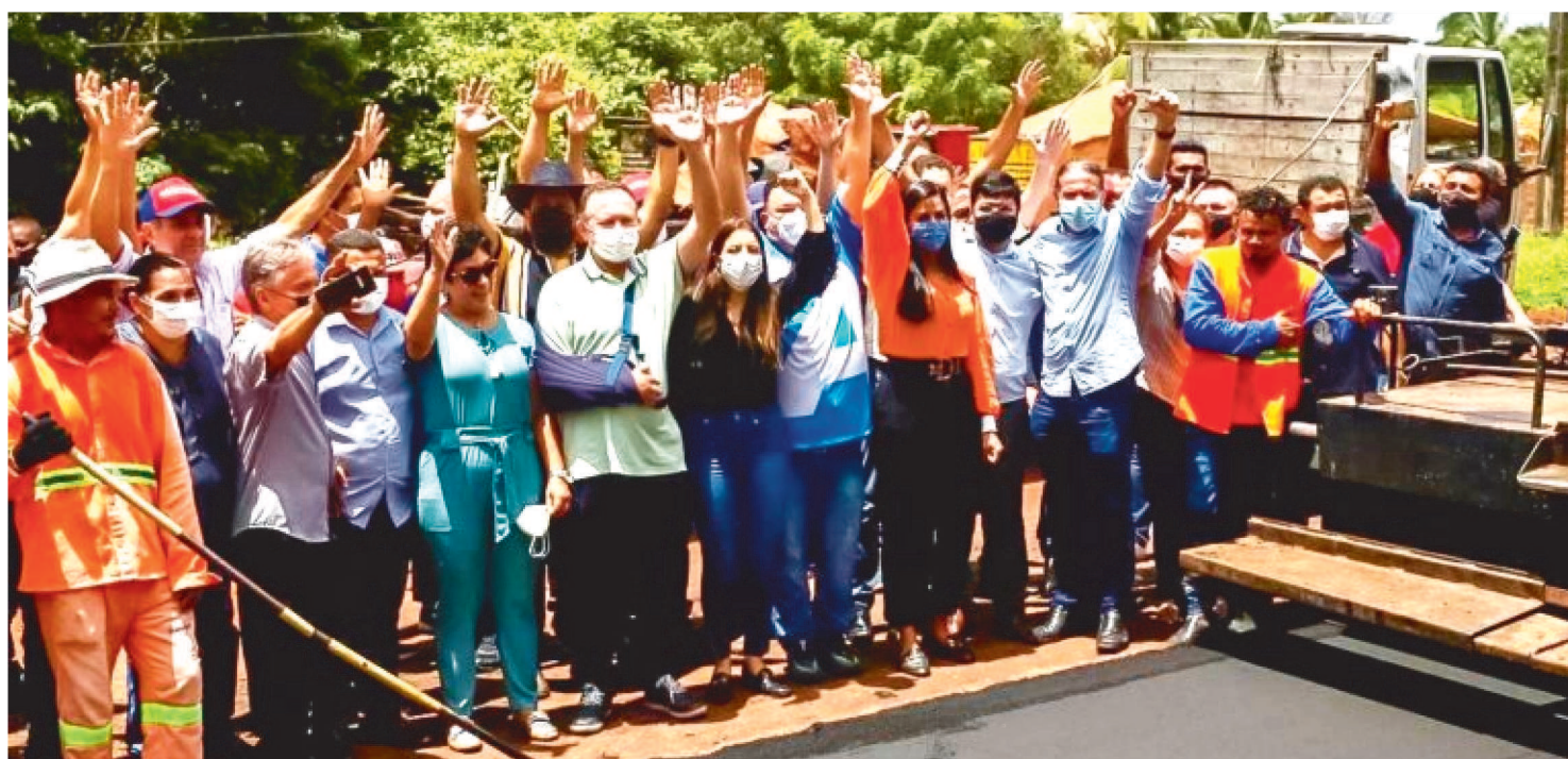
ALÉM DISSO, O GOVERNO DO MA OFERECERU 150 CIRURGIAS DE CATARATA E PTERÍGIO DURANTE O MUTIRÃO DE SAÚDE NO MUNICÍPIO

O vice-governador Carlos Brandão realizou entrega de obras do programa Mais Asfalto em Caxias. Ele também participou do Mutirão de Saúde realizado pela Empresa Maranhense de Serviços Hospitalares (Emserh).