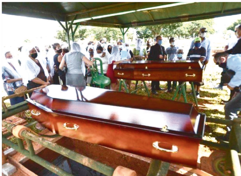
EM JANEIRO DE 2021, NO BRASIL, FORAM REGISTRADAS 137.431 FATALIDADES

pelos números de óbitos registrados pelos Cartórios brasileiros está relacionado ao crescimento de mortes por doenças do coração em janeiro deste ano na comparação com o primeiro mês do ano passado: AVC (20%), Infarto (17%) e Causas Cardiovasculares Inespecíficas (19%). Também registraram crescimento as mortes por Septicemia (23%), Síndrome Respiratória Aguda Grave (SRAG) (9%) e Indeterminada (9%). Já os óbitos por covid-19 tiveram redução de 55% no período.