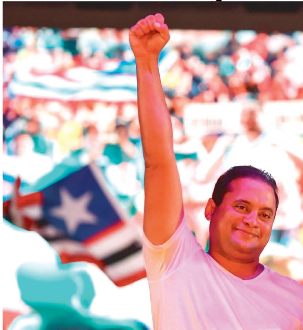
PESQUISA ELEITORAL SOBRE CENÁRIO FOI ENCOMENDADA PELO JORNAL O IMPARCIAL