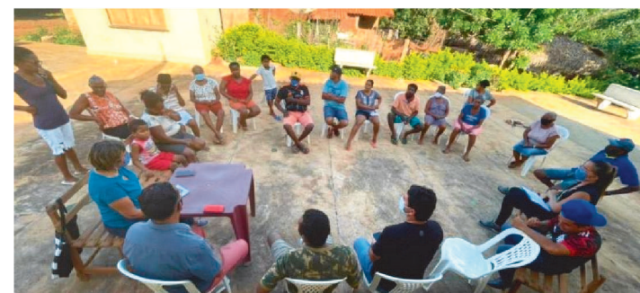
NO MARANHÃO UMA MÉDIA DE 1.500 COMUNIDADES

O Governo do Maranhão realiza ações de certificação estadual, identificação e mapeamento de povos, comunidades quilombolas e de matriz africana para garantir a essas comunidades acesso às políticas públicas estaduais e, também, para traçar um perfil mais detalhado sobre elas.