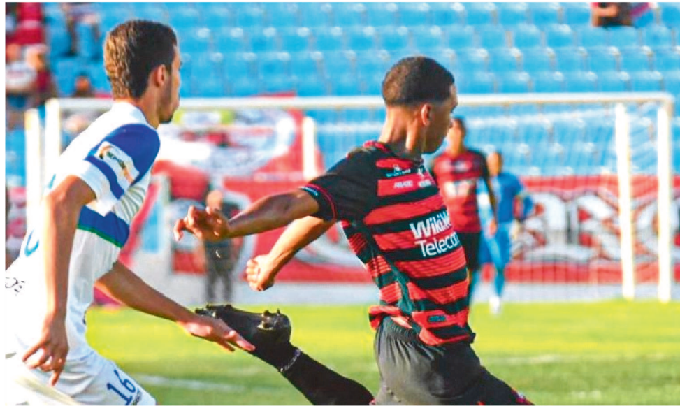
TIME MOTENSE FAZ O JOGO ÚNICO DA DECISÃO CONTRA O PAC EM SÃO LUÍS