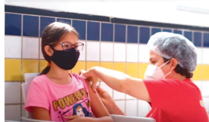
137.960 DOSES JÁ FORAM APLICADAS EM CRIANÇAS

Moradores das comunidades de Coqueiro, do Portinho e da Ilha de Jacamim, na Zona Rural de São Luís, receberam, no domingo (13), as equipes da Secretaria de Estado da Saúde (SES) para um mutirão de vacinação dos moradores contra a Covid-19. Durante a ação, foram aplicadas 388 doses de vacinas. Foram vacinadas crianças e adolescentes, e também adultos que ainda não haviam tomado a primeira, segunda ou dose de reforço da vacina.