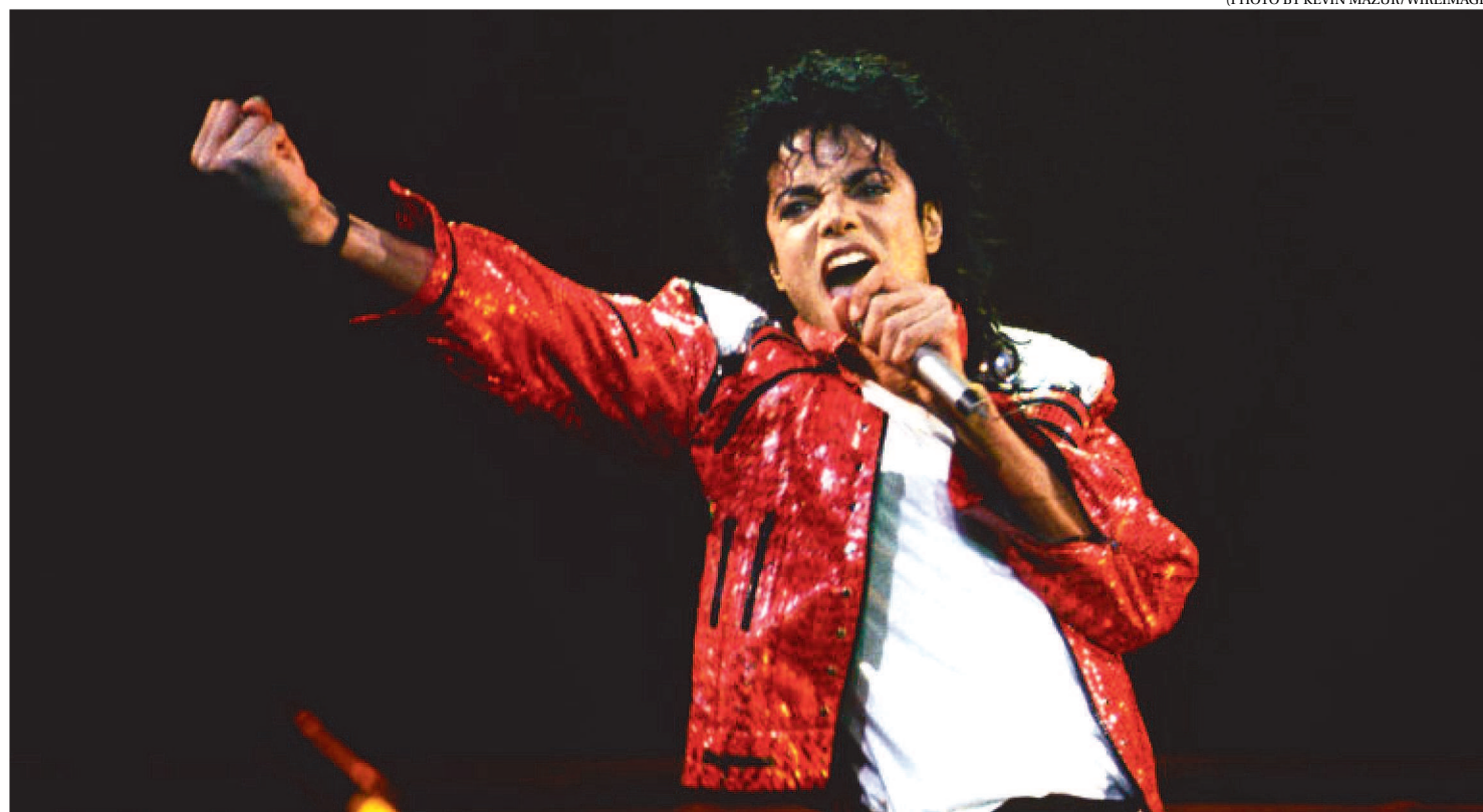
O LONGA SERÁ PRODUZIDO POR GRAHAM KING, RESPONSÁVEL POR BOHEMIAN RHAPSODY, QUE LONGA SOBRE FREDDIE MERCURY

A Lionsgate está preparando a distribuição mundial de um novo filme biográfico, desta vez sobre Michael Jackson, um dos maiores astros do pop, que morreu em 2009.