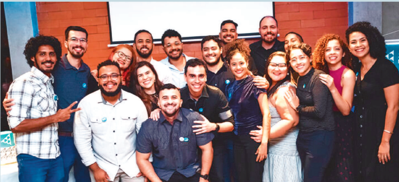
Grupo de ex-alunos dos programas de cultura empreendedora desenvolvidos no estado