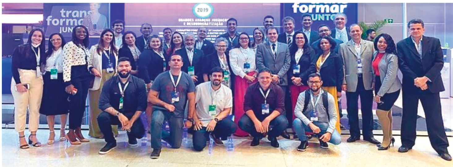
CARAVANA DO MARANHÃO EM BRASÍLIA-DF, É COMPOSTA POR 45 INTEGRANTES, E FOI COORDENADA PELO SEBRAE DO MARANHÃO

Uma caravana coordenada pelo Sebrae-MA e composta por 45 integrantes, participou do evento Transformar Juntos, que aconteceu no Centro Internacional de Convenções do Brasil, em Brasília-DF e foi o resultado da união "Fomenta e Brasil Mais Simples", ambos referência quando o assunto é discutir e incentivar maior participação das micro e pequenas empresas nas compras públicas.