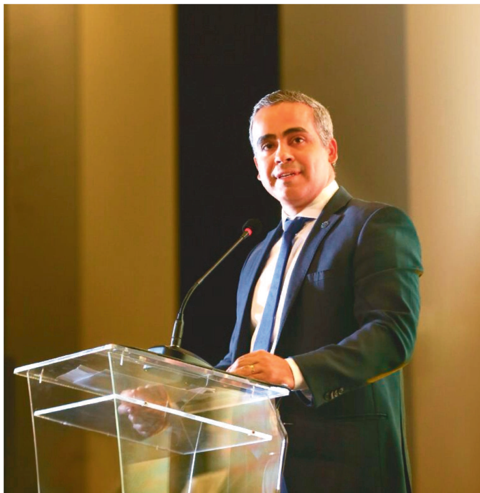
"A POPULAÇÃO NÃO PRECISA SE PREOCUPAR PORQUE O PROGRAMA NÃO IRÁ ACABAR"

No final do ano passado, trouxemos um valor de piso para esse benefício no valor de R$ 400. O Auxílio Brasil já veio com esse ganho financeiro para as famílias nesse momento de recuperação pós-pandemia. Após a