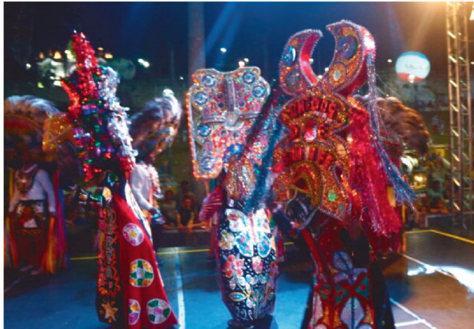
O CAZUMBA OU CAZUMBÁ É UM SER LÚDICO, CURANDEIRO E ZOMBETEIRO

A intenção do encontro é despertar o pertencimento e valorização não só do Cazumba, personagem homena-