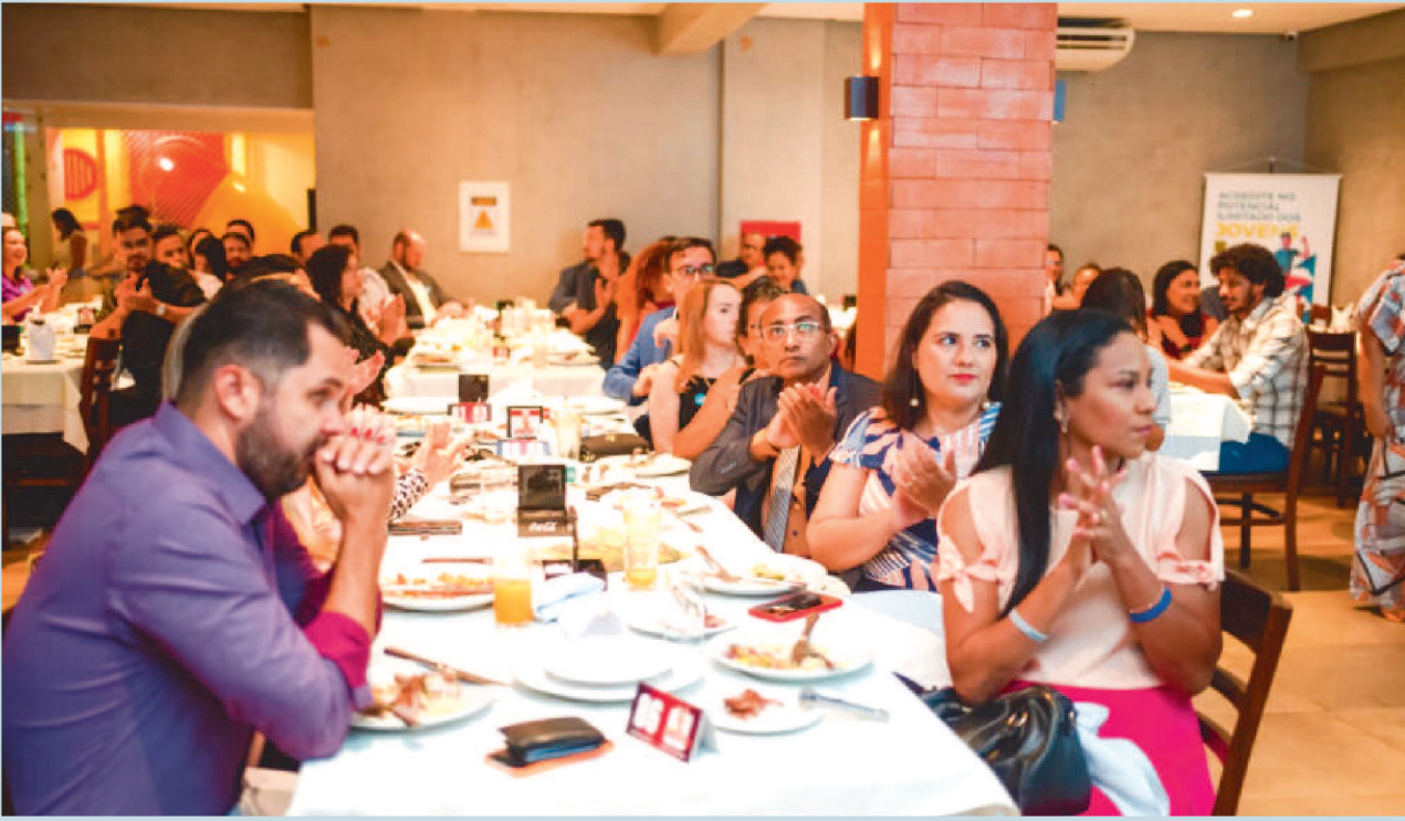
Convidados prestigiaram o evento de aniversário da JA Maranhão