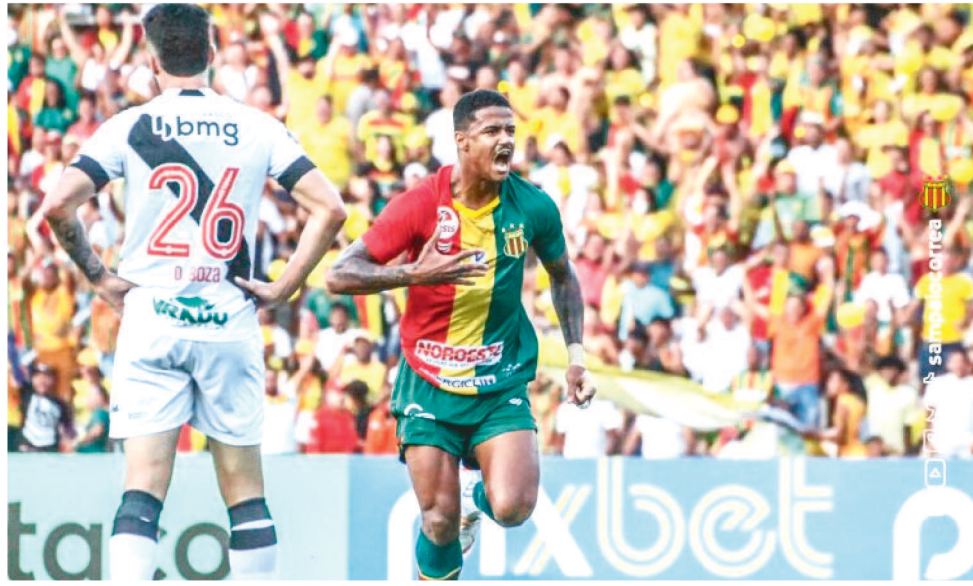
EM CASA, O SAMPAIO CORRÊA É "TRITURADOR" DE ADVERSÁRIO, MAS FORA NÃO RENDE