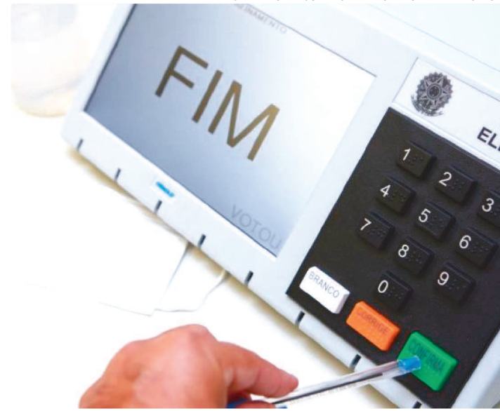
FERRAMENTA FOI IMPLANTADA NAS ELEIÇÕES DE 2014

TSE - TRIBUNAL SUPERIOR ELEITORAL URNA ELETRÔNICA