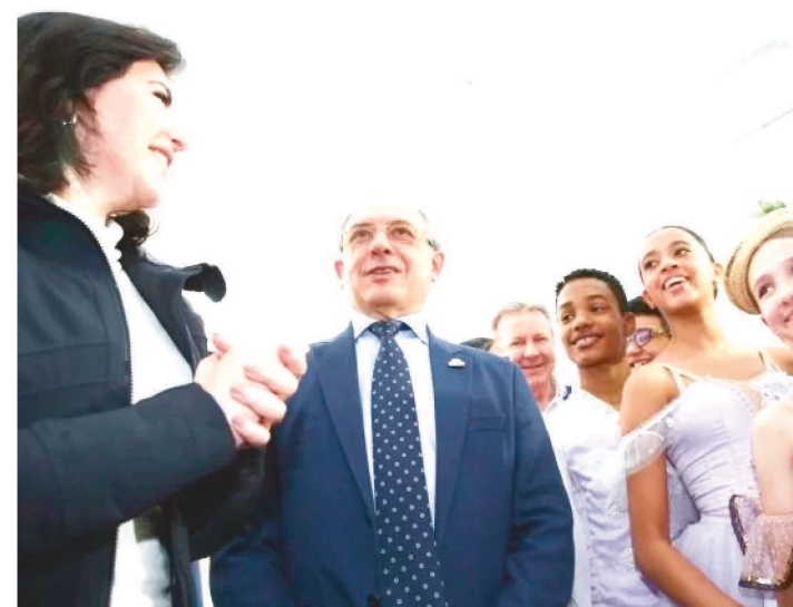
TEBET PROMETEU FOMENTAR A CULTURA, CASO SEJA ELEITA

Pré-candidata à Presidência da República pelo MDB, Simone Tebet esteve nesta terça-feira (23/8) em Joinville (SC), onde foi recebida com uma apresentação de ballet na escola Bolshoi. Na ocasião, Tebet prometeu fomentar a cultura e recriar o Ministério da Cultura em um possível governo.