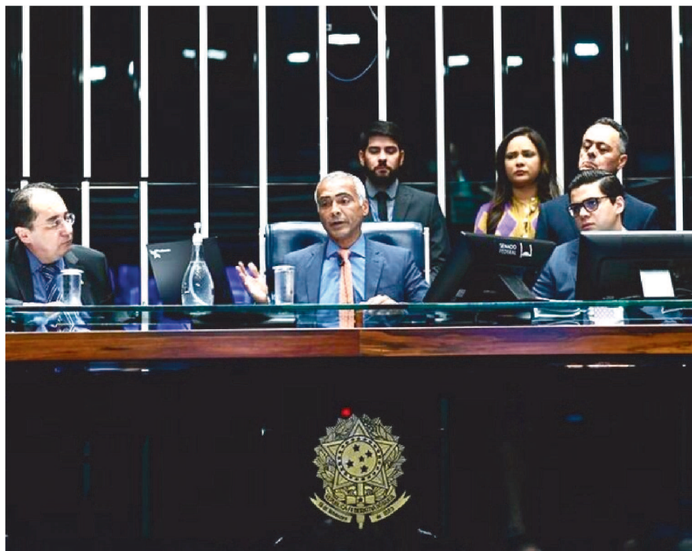
VOTAÇÃO DA PROPOSTA EM PLENÁRIO DEVE OCORRER NO PRÓXIMO DIA 29 DE AGOSTO

Romário sinalizou que apresentará parecer favorável ao texto já aprovado pela Câmara dos Deputados. "Não podemos negar a essas pessoas o direito de uma existência digna e com menos sofrimento. Muitos brasileiros