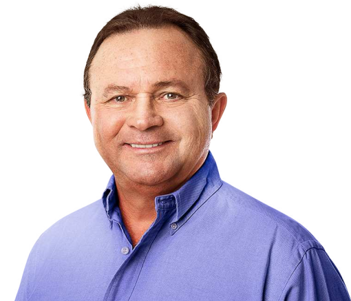
CARLOS BRANDÃO ■ PSB

De forma imediata, vamos afretar equipamentos, mas com controle de qualidade para que possam oferecer segurança para as pessoas. Com mais prazo, vamos adquirir novos equipamentos e licitar um operador privado para operar, com regras bem claras, bem amarradas para que o serviço funcione. E ainda vamos avançar no funcionamento dos aeroportos regionais. O Maranhão é um estado grande, com grandes distâncias, e até para o desenvolvimento do turismo, é necessário que tenhamos aeroportos de menor porte funcionando nas maiores cidades do estado"