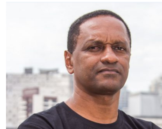
HERTZ DIAS ■ PSTU