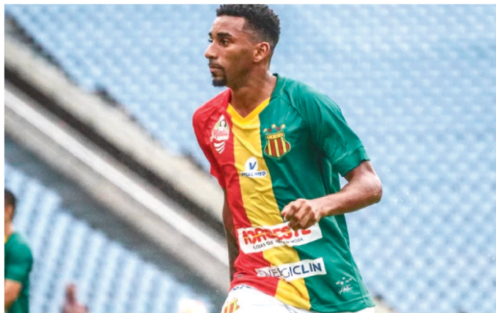
TIME DO SAMPAIO CORRÊA TEM MARATONA DE PARTIDAS NA SÉRIE B DO BRASILEIRO

Agora, dois jogos são considerados de maior risco para os bolivianos, pela campanha que vêm realizando os adversários. O Grêmio está no G4, com 41 pontos, vai enfrentar o Vasco neste domingo (11) e o Criciúma, que também está entre os 10 primeiros colo-