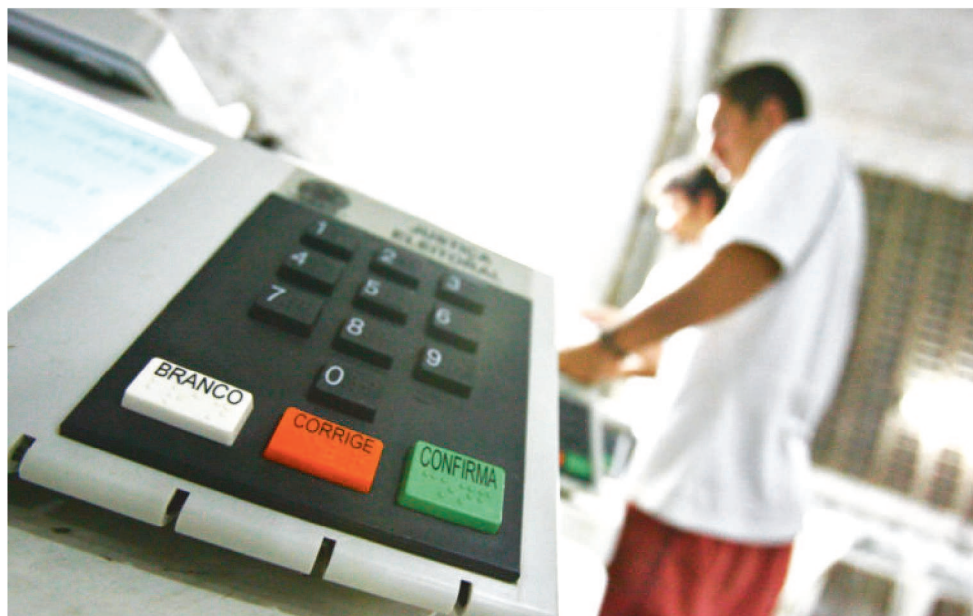
NO DIA 2 DE OUTUBRO, A VOTAÇÃO OCORRE DAS 8H ÀS 17H, HORÁRIO DE BRASÍLIA.

Até 2 de outubro, teremos a afirmação da lisura e transparência do processo com preparação das urnas em audiências públicas presididas pelos juízes (as) eleitorais e acompanhadas pelas entidades fiscalizadoras; auditoria no sistema de transmissão que ocorrerá na antevéspera da eleição, os chamados testes de autenticidade e integridade das urnas eletrônicas, que