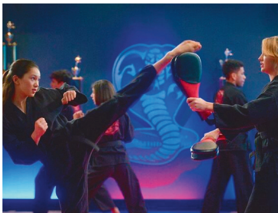
MUITAS QUESTÕES SÃO AGUARDADAS PELOS FÃS NOS NOVOS EPISÓDIOS DE COBRA KAI