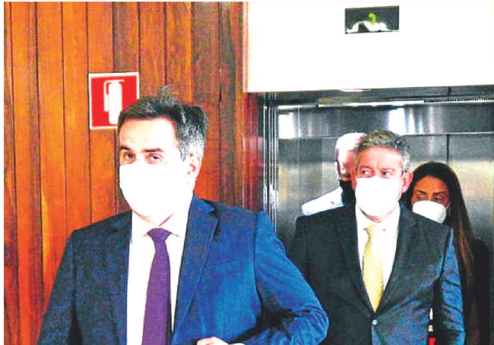
É A PRIMEIRA VEZ QUE TÃO POUCAS SIGLAS DETÊM TANTO PODER ORÇAMENTÁRIO