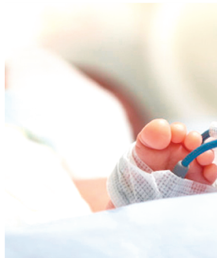
ALÉM DO ENVENENAMENTO, O BEBÊ CONTRAIU COVID-19

A polícia prendeu um homem suspeito de envenenar um bebê de apenas seis meses, para se vingar da mãe da criança, pois ele não aceitava o fim do relacionamento. O caso foi registrado na cidade de Magalhães de Almeida, mas a vítima foi transferida para a cidade de Parnaíba, por conta da gravidade do caso.