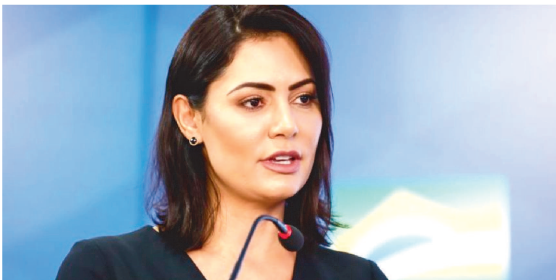
PRIMEIRA-DAMA TERIA TRATADO PESSOALMENTE EMPRÉSTIMOS DA CAIXA A AMIGOS