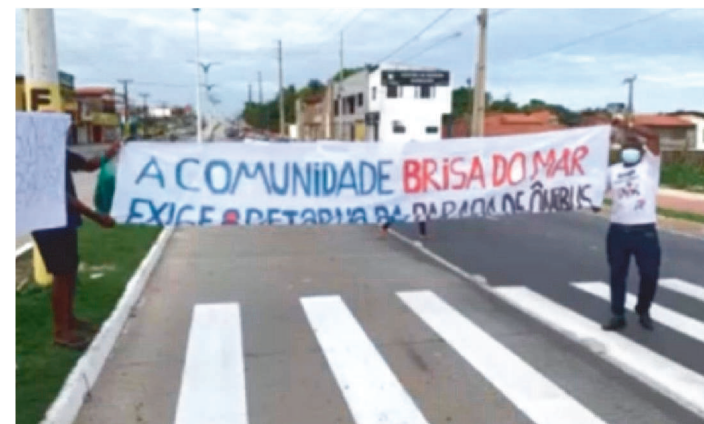
MORADORES DO BRISA DO MAR MANIFESTARAM NA MA-203

Na manhã de ontem, quarta-feira (26), moradores de bairros que ficam na região da MA-203, mais conhecida como Estrada do Araçagi, protestaram contra as mudanças no trânsito local realizadas pelo Governo do Estado, por meio da Agência de Mobilidade Urbana (MOB), pois as alterações mudaram os locais das paradas de ônibus.