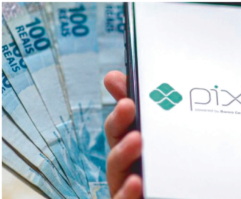
O VALOR PODE SER DEVOLVIDO DE VÁRIAS MANEIRAS, SENDO ATÉ POR PIX

O BC afirma que as informações disponibilizadas no novo serviço são de responsabilidade das próprias ins-