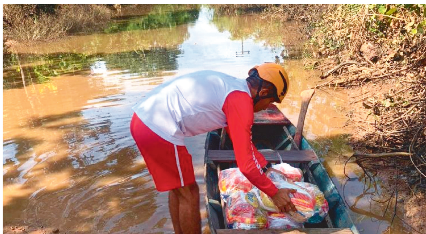
OS MILITARES DO CORPO DE BOMBEIROS DO MARANHÃO CONTINUAM NO TRABALHO DE OPERAÇÃO DE AUXÍLIO ÀS VÍTIMAS

O Corpo de Bombeiros Militar do Maranhão (CBMMA) informou que, atualmente, o Rio Tocantins segue uma tendência de diminuição do seu volume. Em Imperatriz, o rio encontra-se com nível abaixo da cota de inundação. Ainda assim, os militares do Corpo de Bombeiros trabalham na operação de auxílio às vítimas. Dezesete municípios já decretaram situação de emergência, são eles: