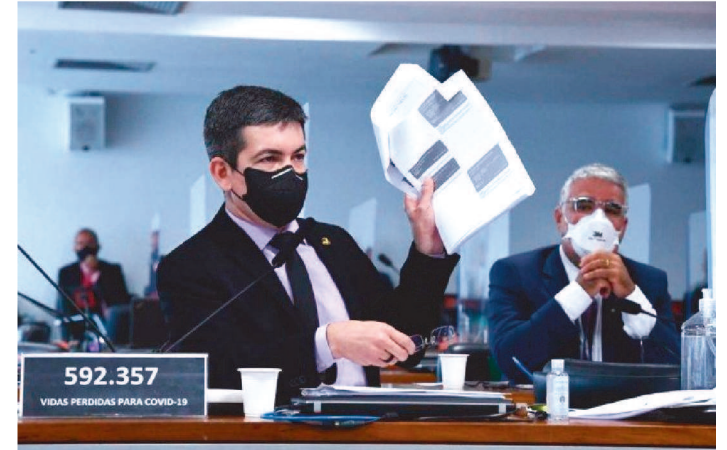
PARLAMENTAR NÃO DEU RESPOSTA DEFINITIVA AO PETISTA

O ex-presidente Luiz Inácio Lula da Silva (PT) convidou o senador Randolfe Rodrigues (Rede-AP) para integrar a equipe de sua campanha para a Presidência. Líder da Oposição no Senado, o parlamentar ainda não deu resposta definitiva ao petista porque pretende disputar o governo do Amapá, cargo para o qual está bem posicionado nas pesquisas, e por se considerar a única alternativa antibolsonarista no Estado.