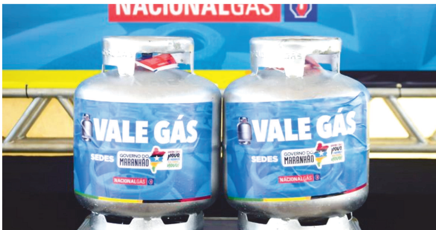
O PROGRAMA BENEFICIA, ATUALMENTE, 103 MIL FAMÍLIAS MARANHENSES INSERIDAS NO CADÚNICO EM EXTREMA VULNERABILIDADE

O Governo do Maranhão, através da Secretaria de Estado do Desenvolvimento Social (Sedes), juntamente com a Secretaria Adjunta de Transferência de Renda e Cidadania (SARC), realiza nesta terça-feira (28) o Encontro Estadual do Cadastro Único, cujo tema é ‘Sedes Promovendo Cidadania’.