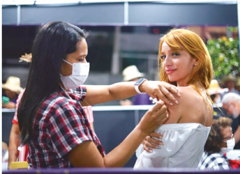
O ARRAIÁ DA VACINAÇÃO ACONTECE NO IPEM ATÉ A SEXTA-FEIRA (1º DE JUNHO)