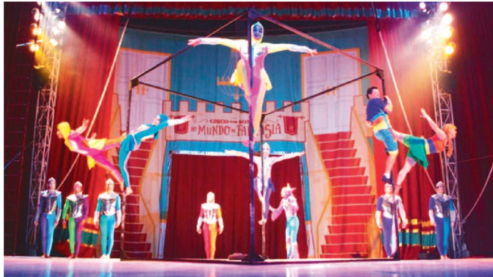
AS INSCRIÇÕES SÃO GRATUITAS E DEVEM SER FEITAS EXCLUSIVAMENTE PELA INTERNET

A Fundação Nacional de Artes (Funarte) recebe até quarta-feira (29) inscrições para a Bolsa Funarte de Pesquisa para Reconhecimento do Circo como Patrimônio Cultural Imaterial do Brasil. As inscrições são gratuitas e devem ser feitas exclusivamente pela internet, por meio do preenchimento de formulário disponível na internet.