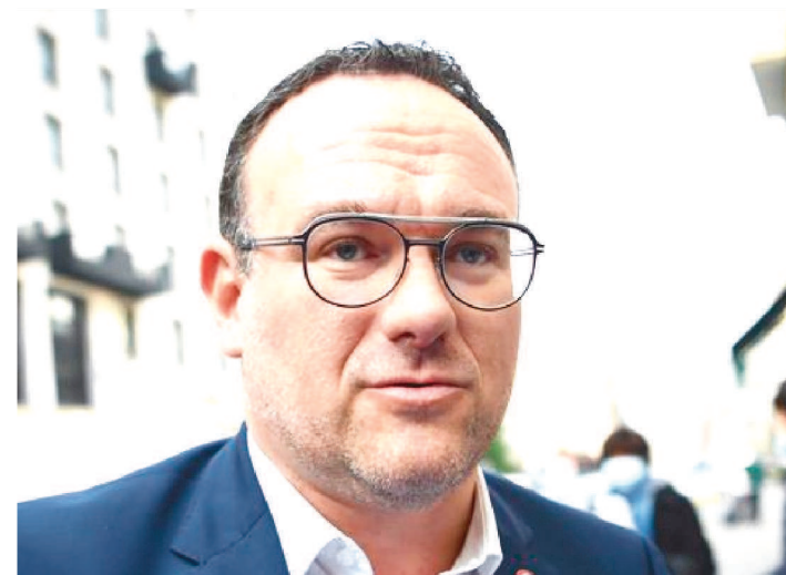
DUAS MULHERES JÁ HAVIAM ACUSADO DAMIAN ABAD

Uma denúncia por tentativa de estupro foi apresentada nesta segunda-feira (27) por uma deputada contra o ministro francês da Solidariedade, Damien Abad. Trata-se da terceira mulher a acusar o ministro de violência sexual. Em 20 de maio, um dia após a nomeação de Abad como ministro da Solidariedade, Autonomia e Pessoas com Deficiência, duas mulheres, citadas pelo site de investigação Mediapart, acusaram o novo ministro de tê-las estuprado em 2010 e 2011.