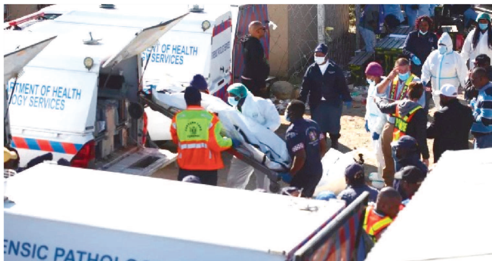
POLÍCIA PRECISOU ACALMAR UMA MULTIDÃO REUNIDA DO LADO DE FORA DO BAR

“Temos um filho que estava lá e morreu no local”, disseram os pais de um menino de 17 anos. “Nós nunca pensamos que ele morreria dessa ma-