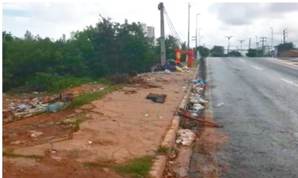
AGENTES DE LIMPEZA VOLTARAM A RECOLHER O LIXO NA MANHÃ DA TERÇA-FEIRA

Os trabalhadores que realizam a coleta de lixo em São Luís retomaram as atividades ontem na capital. A paralisação de advertência dos Agentes de Limpeza da empresa São Luís Engenharia Ambiental foi suspensa após reunião com representantes da Prefeitura de São Luís e a empresa, que se comprometeram em realizar os todos os pagamentos devidos até a próxima terça-feira (1º).