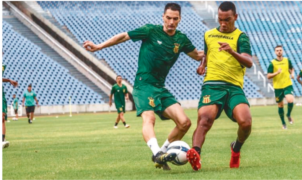
O TRICOLOR DEVERIA TER FEITO A ESTREIA DIANTE DO IAPE, MAS A PARTIDA FOI ADIADA