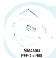
Máscaras PFF-2 e N95

■ Contam com dois tipos de filtragem: a mecânica, por meio da qual as partículas ficam presas nas fibras das máscaras, e a eletrostática, que contém fibras com cargas elétricas para atrair as partículas que escaparam da filtragem mecânica. Esses são os modelos mais recomendados para prevenir infecções por aerossóis — partículas menores do que gotículas — que podem permanecer no ar por mais tempo em ambientes fechados. Não é lavável e pode ser usada durante todo o dia, com possibilidade de reutilização após, no mínimo, três dias de descanso em local seco e à sombra.