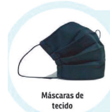
Máscaras de tecido

■ Previne a infecção por gotículas, mas aerossóis podem atravessar as camadas, especialmente nos casos em que a máscara não se fixa bem à face do usuário. Uma opção recomendada por especialistas da área de saúde é fazer nós nas laterais, de modo que o item de proteção vede mais o rosto, e usá-la com uma máscara de tecido por cima. O ideal são os modelos com três camadas. Caso apresentem umidade, é necessário descartá-las.