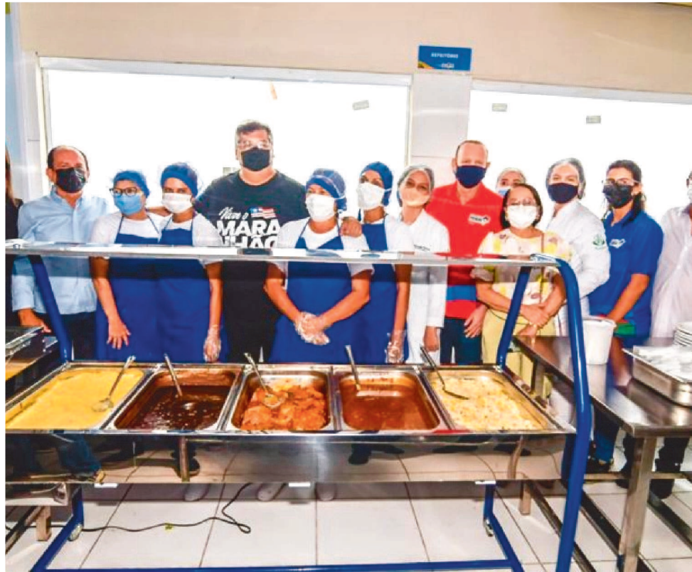
O ESPAÇO IRÁ OFERECER 750 REFEIÇÕES, SENDO 500 ALMOÇOS E 250 JANTARES

O espaço inaugurado irá oferecer 750 refeições, sendo 500 almoços e 250 jantares. As refeições são no valor de R$ 1, preço padrão em todo o estado. Quando Dino assumiu o seu mandato, em 2015, o Maranhão contava com apenas seis Restaurantes Popu-