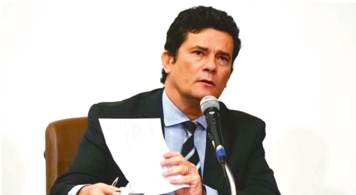
MORO TAMBÉM FALOU SOBRE A ARTICULAÇÃO PARA TENTAR CRIAR UMA CPI SOBRE A CONDUTA DELE NA INICIATIVA PRIVADA

O ex-juiz e presidenciável do Podemos, Sérgio Moro, criticou o Tribunal de Contas da União (TCU) e disse que vai divulgar nesta sexta-feira, 28, seus rendimentos do período em que trabalhou na consultoria americana Alvarez & Marsal.