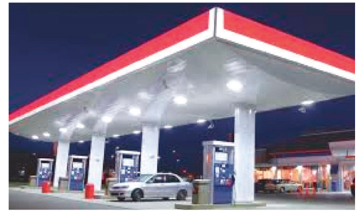
VALOR IRIA ATÉ DIA 31 DESTE MÊS, AGORA VAI ATÉ 31 DE MARÇO

O Comitê Nacional de Política Fazendária (Confaz) aprovou nesta quinta-feira (27) a prorrogação, até 31 de março, do congelamento do preço médio ponderado ao consumidor final (PMPF) do Imposto sobre Circulação de Mercadorias e Serviços (ICMS) incidente sobre os combustíveis.