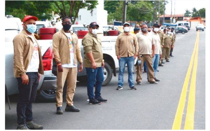
FUMACÊ PERCORREU ÁREAS DE RISCO DA GRANDE ILHA

Com o objetivo de reduzir a infestação do mosquito Aedes Aegypt, transmissor da Dengue, Chikungunya e Zika Vírus, o Governo do Estado iniciou, nesta quarta-feira (26), uma ação de nebulização espacial, mais conhecida como fumacê, em áreas de risco da Grande Ilha. A ação, executada pela Secretaria de Estado da Saúde (SES), acontece na época de maior proliferação do Aedes aegypti, causador de doenças que causam sofrimento e podem levar à morte.