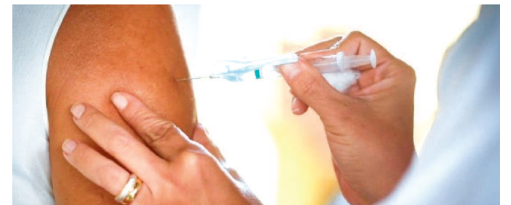
O MUTIRÃO ACONTECE DAS 8H ÀS 16H NA PRAÇA DA FAMÍLIA

As pessoas que forem se vacinar nesta sexta-feira (28), no Mutirão da Vacinação a ser realizada em Carutapera, concorrerão a prêmios em dinheiro de R$ 10 mil, R$ 5 mil e R$ 1 mil reais. A premiação faz parte do Dose Premiada, realizada pelo Governo do Estado com o objetivo de intensificar a cobertura vacinal no combate à Covid-19 e aumentar a imunização da população para o controle da pandemia. O mutirão em Carutapera acontece das 8h às 16h no Centro de Vacinação Covid-19, localizado na Praça da Família (próxima à Catedral). Para a vacinação, devem ser apresentados um documento de identificação com foto, cartão de vacinação e cartão do SUS.