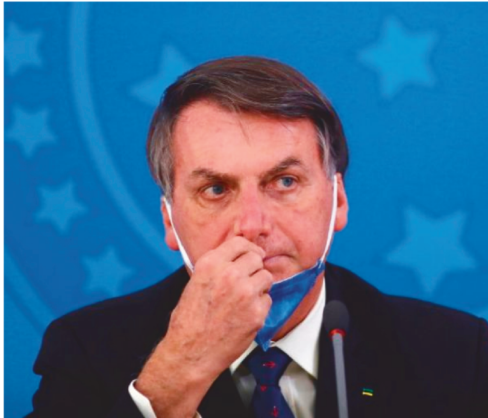
MAIS DE 1.7 MILHÕES DE DOCENTES DEVEM SER BENEFICIADOS EM TODO O PAÍS

Em nota, o Ministério da Educação comentou que o novo valor do Piso Salarial Profissional Nacional para os Profissionais do Magistério Público da Educação Básica (PSPN) em 2022