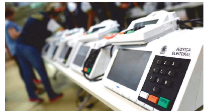
O TRIBUNAL PERMITIRÁ AS SUBSTITUIÇÕES DE CANDIDATOS

O Tribunal Superior Eleitoral (TSE) divulga nesta quinta-feira (27/1) as regras para o registro de candidatos para as eleições de 2022. Segundo a Corte, o registro já pode ser apresentado à Justiça Eleitoral e o prazo máximo é dia 15 de agosto.