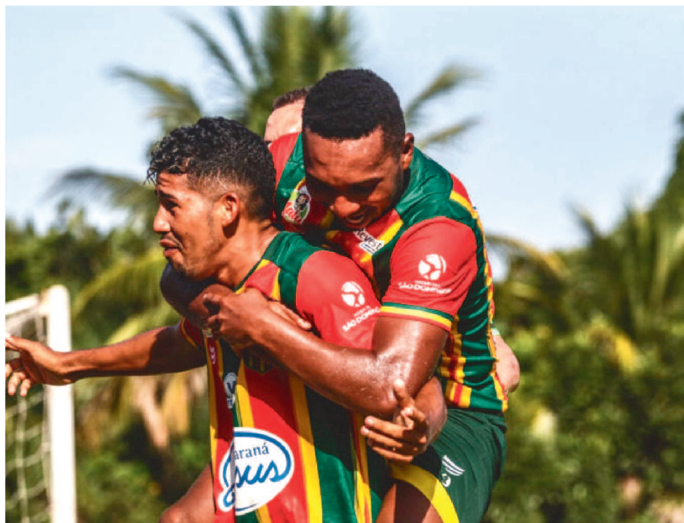
SAMPAIO VENCEU A PRIMEIRA PARTIDA OFICIAL DA TEMPORADA 2022 FORA DE CASA