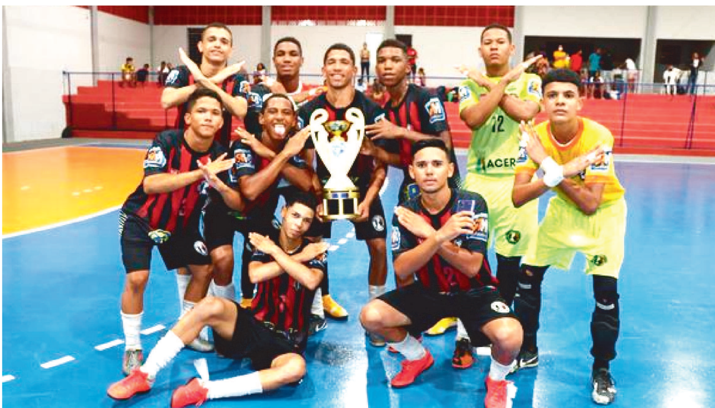
EQUIPE CODOENSE FESTEJOU A CONQUISTA DO TÍTULO DE FUTSAL

O título do Campeonato Maranhense de Futsal Sub-16 – temporada 2021, competição promovida pela Federação de Futsal do Maranhão (Fefusma), é da equipe do Codó Esporte Clube. O grito de campeão para o time do interior veio na noite dessa terça-feira (22) com a bela vitória por 4 a 2 sobre o Balsas Futsal. A partida foi realizada no Ginásio Guioberto Alves, no Bairro de Fátima, em São Luís.