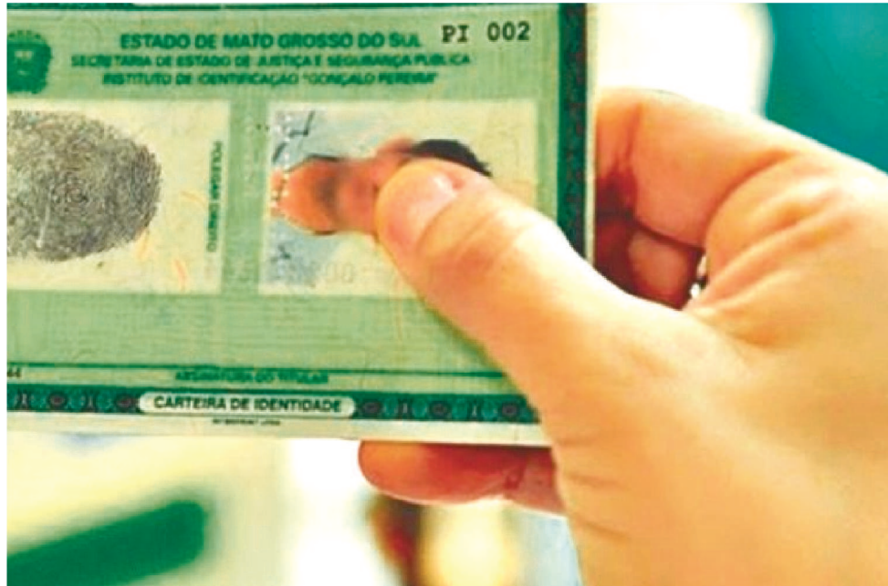
A EMISSÃO SERÁ GRATUITA E PERMANECERÁ SOB RESPONSABILIDADE ESTADUAL

Estiveram presentes na cerimônia os ministros Luiz Eduardo Ramos (Secretaria-Geral da Presidência da República), Anderson Gustavo Torres (Justiça e Segurança Pública), e Paulo