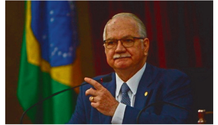
FACHIN TAMBÉM DISSE QUE REDES SOCIAIS TERÃO LIMITES

Presidente do Tribunal Superior Eleitoral (TSE), o ministro Edson Fachin afirmou, nesta quarta-feira (23/2), que a Justiça Eleitoral está preparada para agir em cenários extremos durante as eleições deste ano. Perguntado sobre a postura do presidente Jair Bolsonaro (PL), que já afirmou, em algumas ocasiões, que não irá aceitar o resultado das eleições, caso perca, Fachin garantiu a segurança das urnas eletrônicas e criticou os discursos negacionistas.