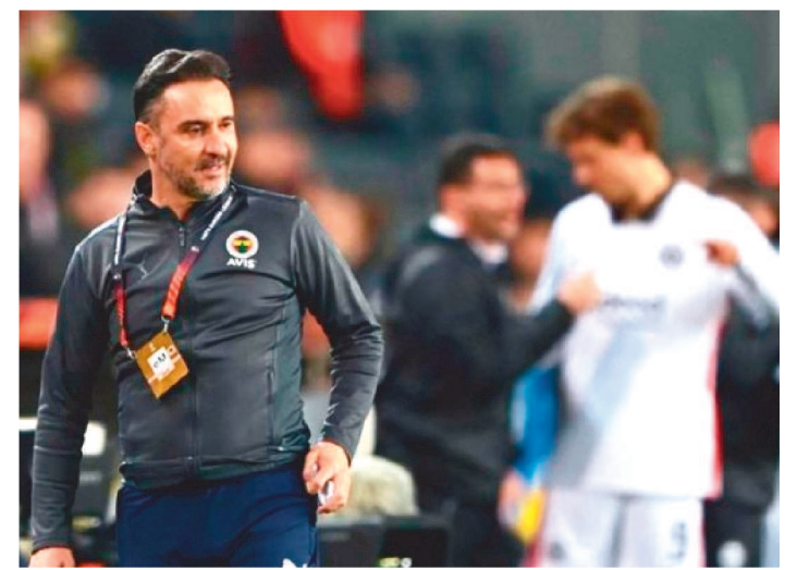
VITOR PEREIRA É MAIS UM TÉCNICO PORTUGUÊS NO BRASIL

Após 17 anos, o Corinthians volta a ter um técnico estrangeiro. Na manhã desta quarta-feira (23), o clube anunciou a contratação de Vitor Pereira, treinador português de 53 anos que estava livre no mercado desde dezembro de 2021, após deixar o Fenerbahçe, da Turquia. O contrato será válido até 31 de dezembro de 2022.