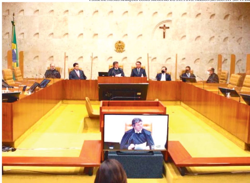
POSSE DE NUNES MARQUES COMO MINISTRO DO STF.

O Fundo Eleitoral é repassado aos partidos em anos de eleições. O repasse foi criado pelo Congresso em 2017 após a decisão do Supremo, que, em 2015, proibiu o financiamento das campanhas por empresas privadas. Além do Fundo Eleitoral, os partidos também contam com o Fundo Partidário, que é distribuído anualmente