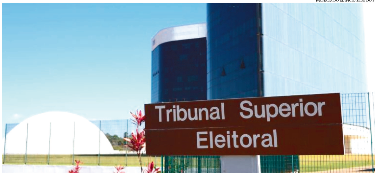
FACHADA DO EDIFÍCIO SEDE DO STF