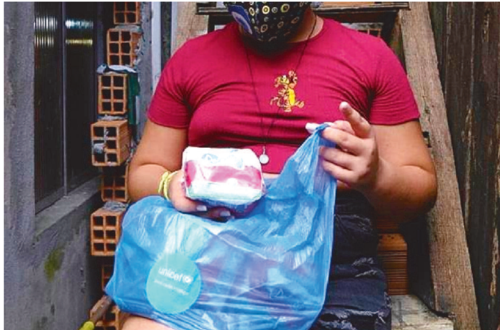
A EXPECTATIVA DE TÉCNICOS DA PASTA É DE BENEFICIAR 3,620 MILHÕES DE MULHERES

A expectativa de técnicos da pasta é de beneficiar 3,620 milhões de mulheres envolvendo três grupos de mulhe-