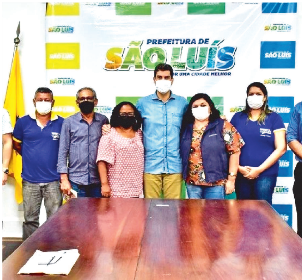
REAJUSTE SALARIAL VEM SENDO PLEITEADO PELO SINFUSP-SL HÁ SETE ANOS.

A concessão de reajuste salarial aos servidores e funcionários do Município de São Luís foi um compromisso firmado pelo prefeito Eduardo Braide ainda enquanto candidato ao executivo municipal. À época, ele assinou