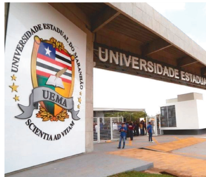
ESTÃO SENDO OFERTADAS 240 VAGAS PARA VÁRIOS CURSOS

A Universidade Estadual do Maranhão (UEMA) irá aplicar, dia 20 de março, às 13h, as provas do seletivo do Programa de Formação Profissional Tecnológica (Profitec) 2022.