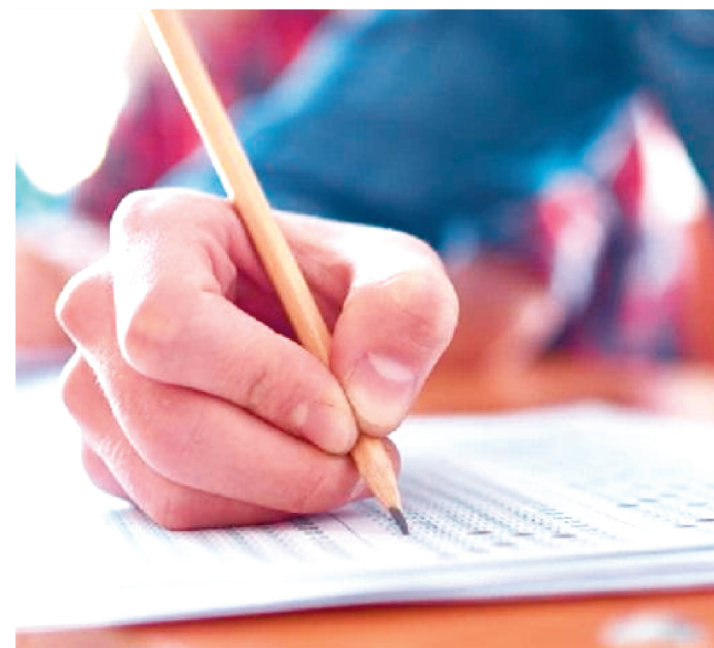
ESTÃO SENDO OFERECIDAS 136 VAGAS PARA ESTUDANTES

Foi publicado, no Diário Eletrônico do Ministério Público do Maranhão, o edital de abertura do processo seletivo simplificado para admissão e formação de cadastro de reserva de estudantes de graduação e de ensino profissional na modalidade de estágio não obrigatório. As inscrições poderão ser feitas, no período de 16 de março a 6 de abril de 2022, no endereço seletivos.mpma.mp.br .