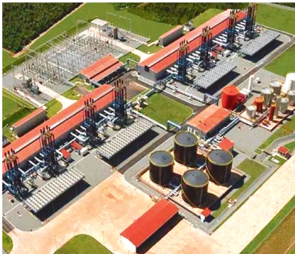
MUNICÍPIO DE SÃO LUÍS NEGOU EXPEDIÇÃO DE CERTIDÃO DE USO E OCUPAÇÃO DO SOLO

Com capacidade de 1.782,5 MW, uma das maiores do país, e movido a gás natural, o empreendimento ultrapassa os limites de poluição quanto à qualidade do ar, como previstos na resolução do Conselho Nacional do Meio Ambiente (Conama), e por meio