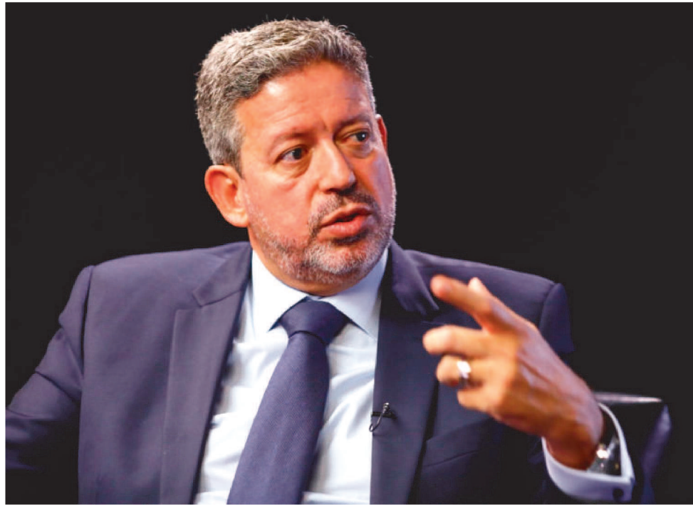
ARTHUR LIRA RECEBERÁ MEDALHA DO MÉRITO MUNICIPALISTA MARIA FÉLIX, NA FAMEM

Outra pauta considerada prioritária pelo movimento municipalista nacional e que também será tema do encontro entre Arthur Lira e os prefeitos maranhenses, será a PEC 13/2021, elaborada pela Confederação Nacional de Municípios (CNM), e que retira as penalidades para os Municípios que não atingiram os 25% da Educação em 2020, em decorrência da pan-