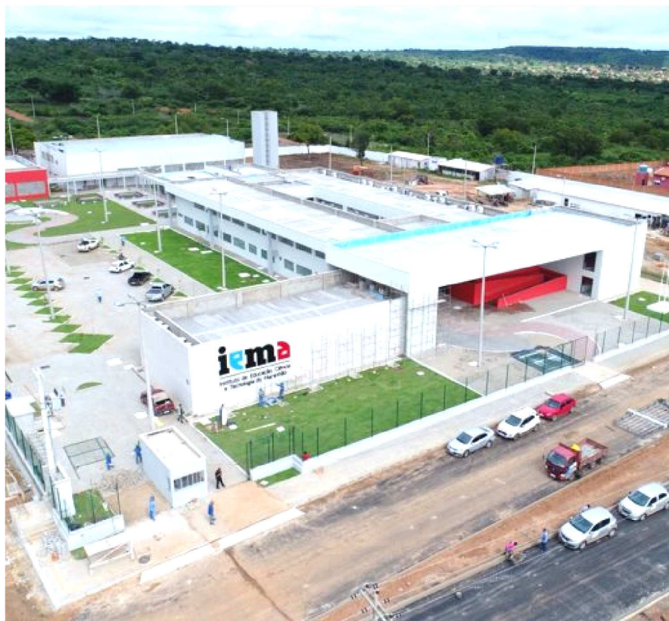
AS OPORTUNIDADES DE CAPACITAÇÃO SÃO PARA VÁRIOS CURSOS OFERECIDOS NO IEMA

As vagas estão distribuídas em 101 turmas em diversos municípios maranhenses. A confirmação de matrícula ocorrerá de 24 a 25 de março nos mesmos locais onde foram realizadas as inscrições. Estão sendo contemplados os municípios de Açailândia, Alcântara, Barra do Corda, Bequimão, Caxias, Codó, Carolina, Coroatá, Imperatriz, Loreto, Palmeirândia, Pimenteiras, Pedreira, Pindaré-Mirim, Ribirãozinho, São Luís, São Bento e São Mateus.