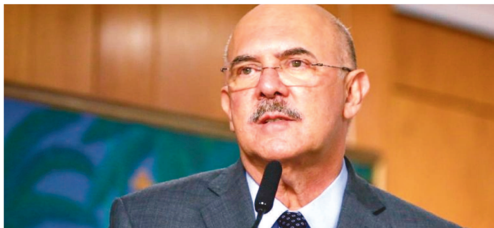
NO CONGRESSO, ATÉ MESMO ALIADOS DO GOVERNO PEDEM A APURAÇÃO DO CASO