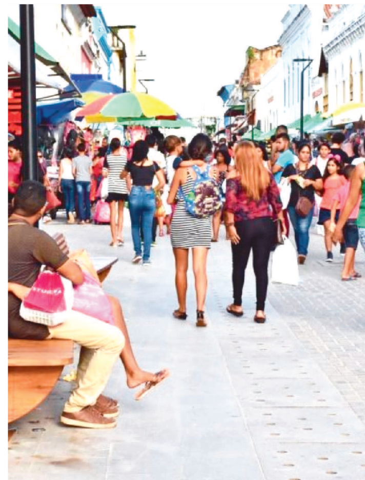
FUNCIONAMENTO É CONFORME AS CONVENÇÕES COLETIVAS

Durante os dias da Semana Santa (14 a 17 de abril), o comércio da Grande Ilha (São Luís, São José de Ribamar, Paço do Lumiar e Raposa) funcionará conforme as regras das Convenções Coletivas de Trabalho (2021/2022) das Categorias de Comércio e Serviços destes municípios, de acordo com a Federação do Comércio de Bens, Serviços e Turismo do Estado do Maranhão (Fecomércio/MA).