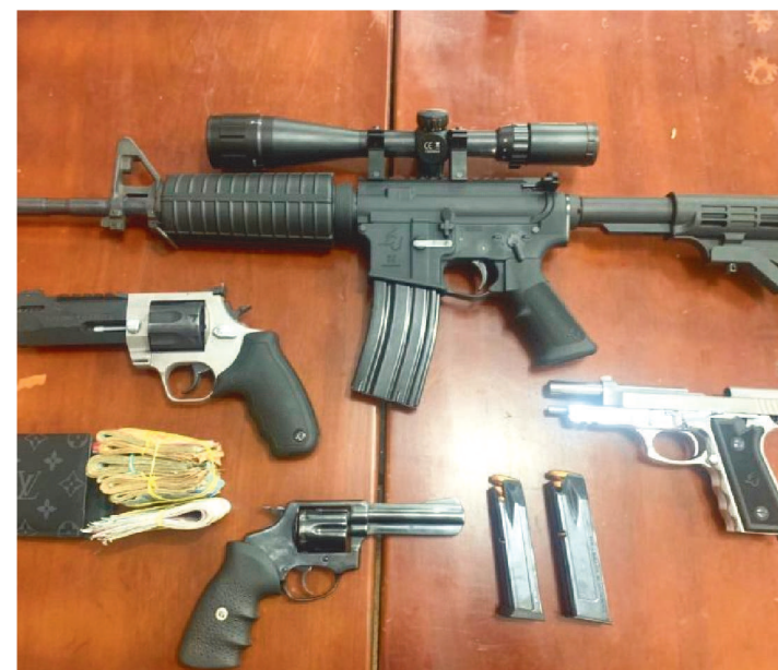
ELES TERIAM COMERCIALIZADO R$ 20 MILHÕES EM MUNIÇÃO