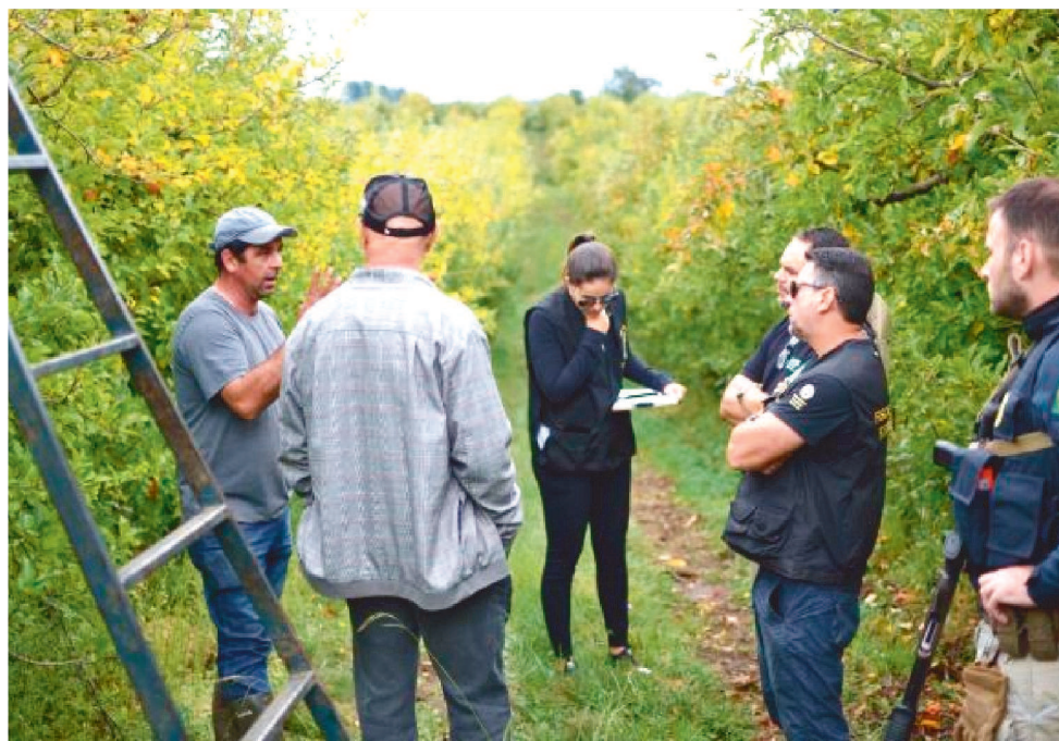
ELES FORAM ALICIADOS NO MARANHÃO PARA TRABALHAR EM TRÊS FAZENDAS

Num deles, com apenas três quartos pequenos, 22 trabalhadores se amontoavam em cinco ou seis pessoas por cômodo. A casa tinha apenas um banheiro para tomar banho e um