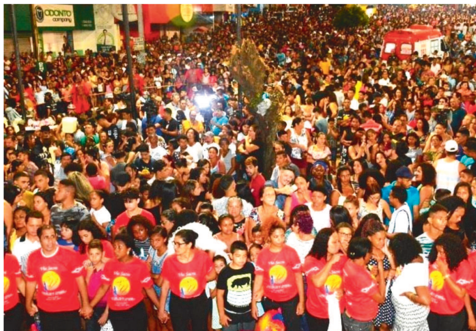
A DECISÃO FOI TOMADA EM CONJUNTO PELA DIRETORIA DO GRUPO GRITA.

A história de amor encenada tem como palco as ruas e praças do bairro e sempre teve grande apoio da comu-