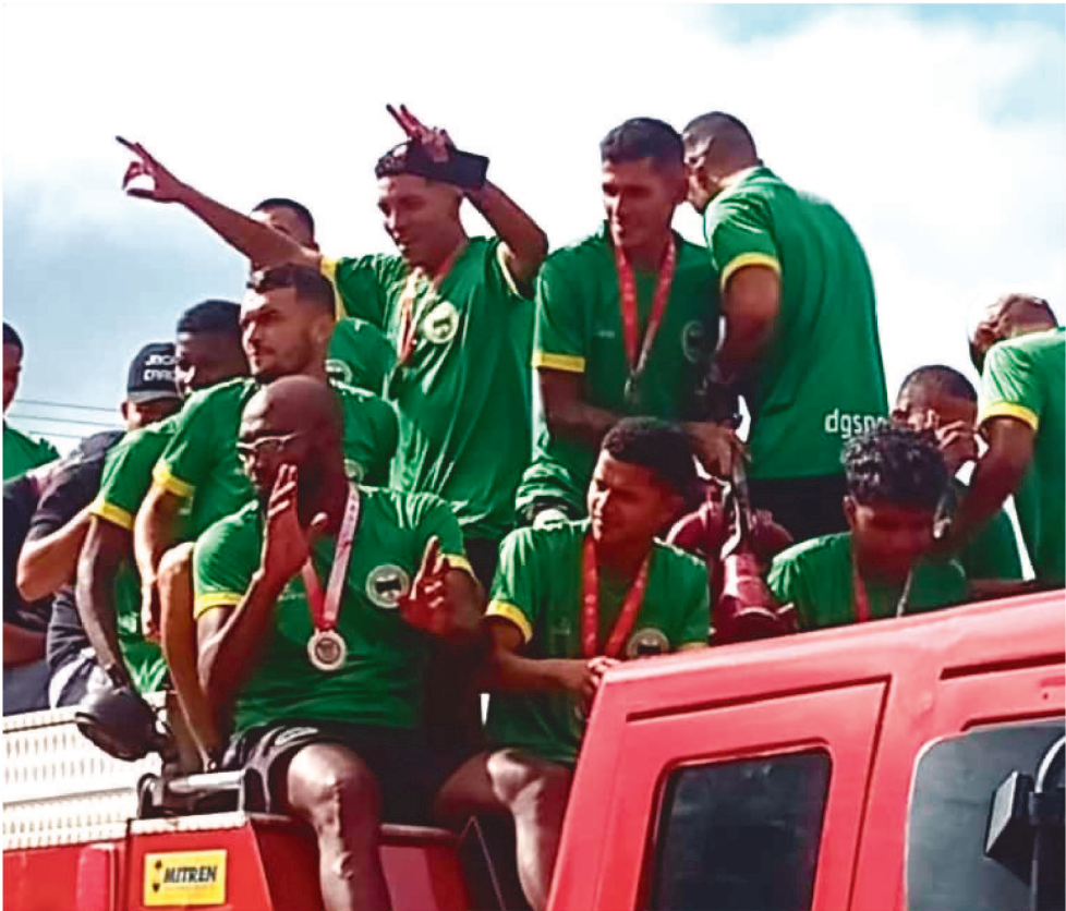
A EQUIPE DO CORDINO DESFILOU EM CARRO DO CORPO DE BOMBEIROS, NA CIDADE

A Federação Maranhense de Futebol (FMF) marcou o primeiro jogo das finais para quarta-feira (13), no Estádio Leandro Silva, em Barra do Corda, às 15h30. Em princípio, questionou-se a capacidade de público do Leandro para atender as exigências do regulamento, que exige espaço no mínimo para 2 mil torcedores. O local, no entanto, abriga 2.500, segundo a prefeitura da cidade, que recentemente promoveu uma reforma e ampliação