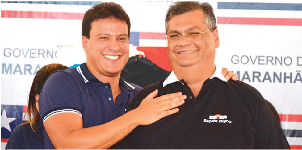
ELE SE TORNOU MESTRE EM DIREITO CONSTITUCIONAL E PROFESSOR DESDE 1994

Em setembro do ano passado, ao inaugurar uma praça na cidade de São Raimundo das Mangabeiras, sul do Maranhão, Dino ele lembrou que tão logo saísse do governo, voltaria a ser professor de Direito Constitucional da Universidade Federal do Maranhão. “Em abril serei obrigado pela lei a voltar de onde em vim, da sala de aula da UFMA. Voltarei a ser professor dos meus alunos de Direito Constitucional”, declarou.