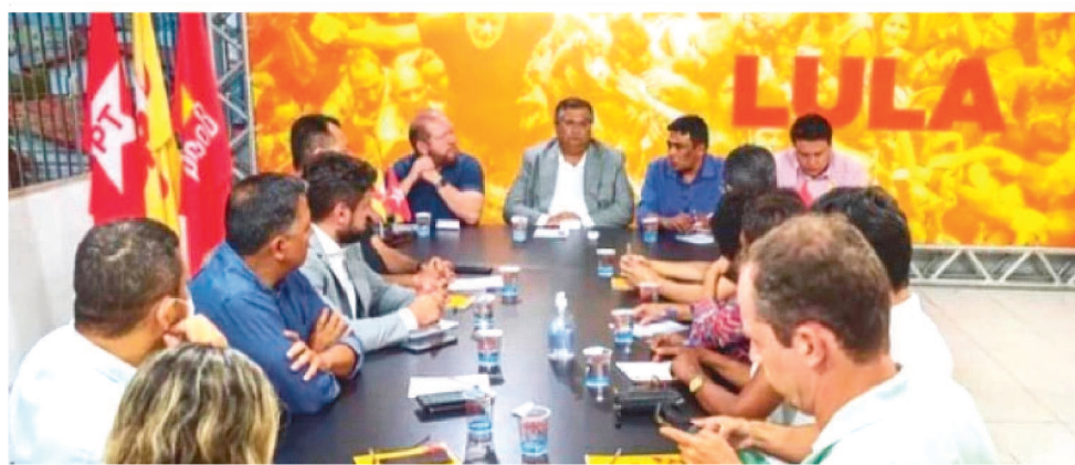
FLÁVIO DINO REUNIU-SE COM SUA BASE PARA TRAÇAR ESTRATÉGIAS PARA AS ELEIÇÕES

Flávio Dino (PSB) reuniu-se na noite da última quarta-feira com presidentes de partidos e aliados para traçar estratégias de como se dará esse projeto político que está em conformidade com a base de apoio do seu grupo. O encontro contou com a presença do presidente da Assembleia Legislativa, deputado Othelino Neto (PCdoB), deputados estaduais e ex-secretários de estado, como por exemplo, Felipe Camarão, que comandou por anos a pasta de educação no Maranhão. O ex-secretário também repercutiu a reunião em sua rede social. “É PSB, PT e PCdoB unidos pelo Brasil e pelo Maranhão. Nos reunimos para discutir a pré-campanha do presidente Lula no Maranhão, os novos passos, eventos, plenárias e comitês sociais que serão feitos para colher sugestões para o programa de governo”, escreveu Felipe Camarão. O presidente estadual do Partido dos Traba-