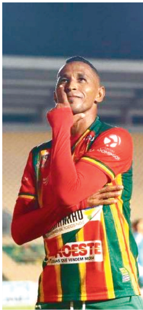
Na Tombense, as atenções estão