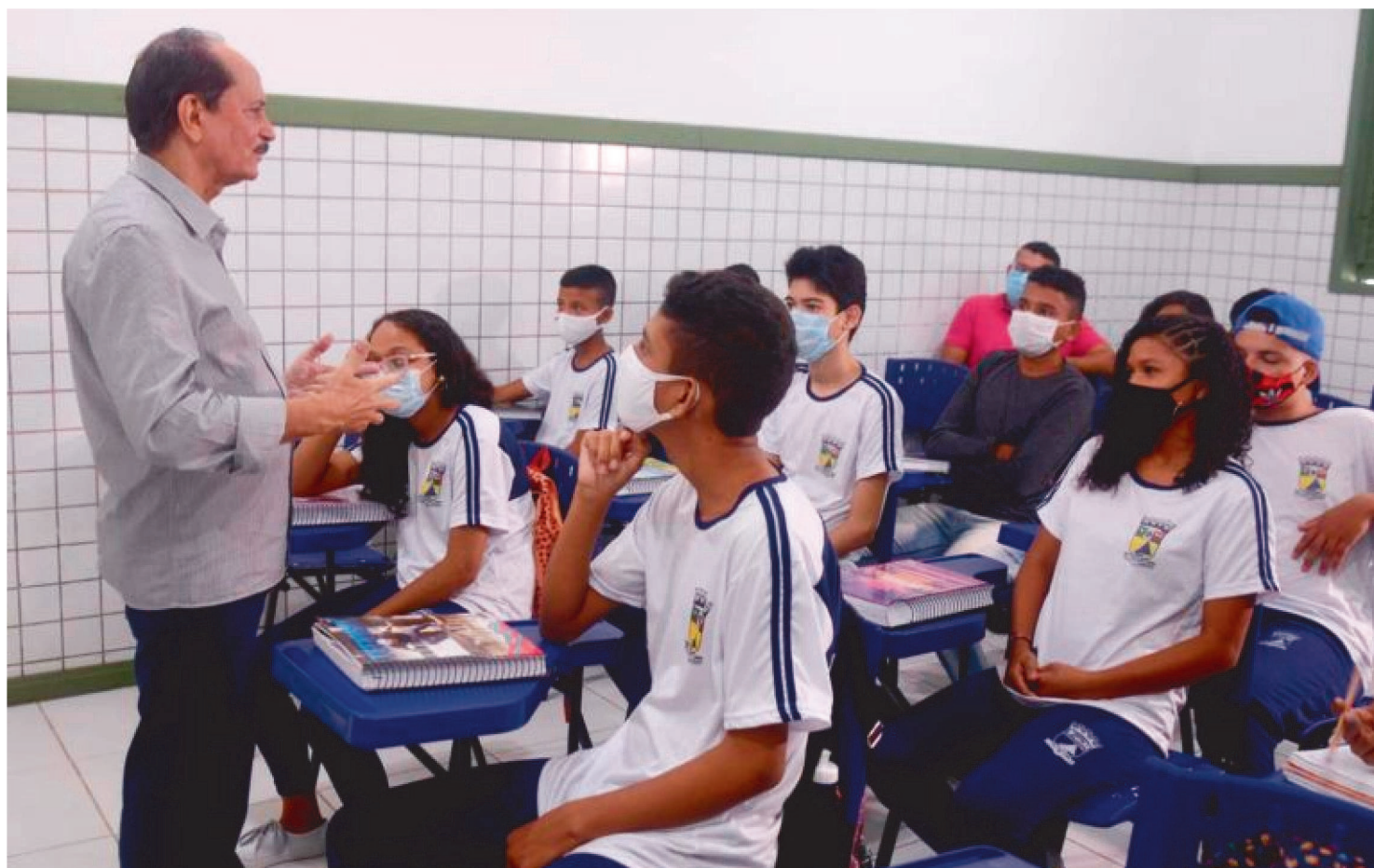
PROFISSIONAIS E ESTUDANTES RECEBERAM VALORIZAÇÃO E BENEFÍCIOS MESMO DURANTE PANDEMIA

Um dos pilares de uma gestão pública de qualidade é a Educação. Nesse quesito, São José de Ribamar, município da Grande Ilha de São Luís, tem avançado com a formação de uma base sólida para os ribamarenses e valorização dos seus alunos e professores.