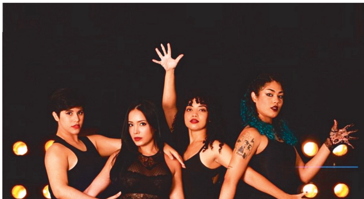
CAETANEAR É UM ESPETÁCULO POCKET COM NARRATIVA LEVE EMBALADA POR MÚSICAS DA CARREIRA DE CAETANO VELOSO