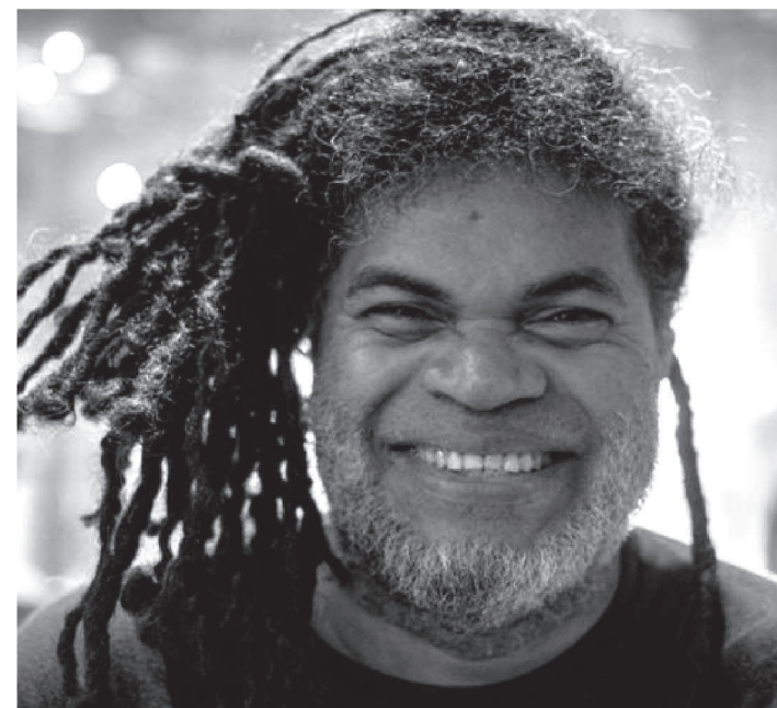
MARANHENSE FOI UM DOS MAIS CONHECIDOS DO REGGAE