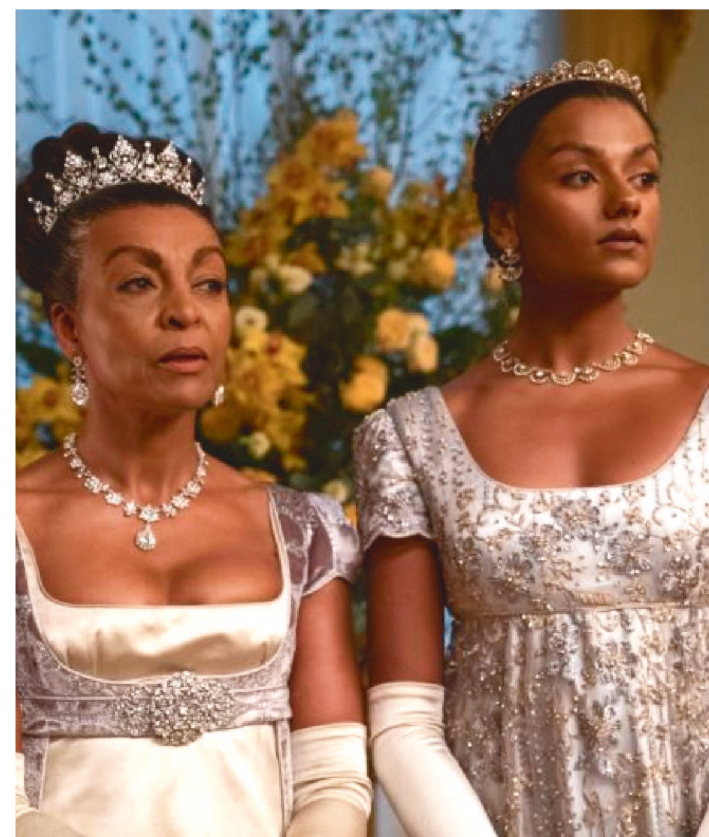
NOVA TEMPORADA BATEU RECORDE 28 DIAS APÓS ESTREIA

A segunda temporada de Bridgerton chegou com tudo ao catálogo da Netflix. Vinte e oito dias após a sua estreia, a produção se tornou o título mais assistido em língua inglesa da gigante do entretenimento.